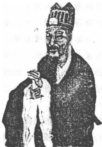
刘基：刘基，字伯温， 才华过人，辅佐朱元璋灭 陈友谅、张士诚，北伐中 原，南灭诸郡，战功赫赫。 为人正直，执法无私。

伯温找来商量，问他新宰相应当任命何人。刘伯温从国家利益的角度出发，不偏不倚的评断当时朝中几个有可能当上宰相高位的官员。其中的一个人叫杨宪，对刘伯温一向很不错，两个人交往甚密。朱元璋本来想立杨宪为相，不料刘伯温却反对，认为杨宪很有才能，足可以做宰相，但是却缺少做宰相的宽广心胸，不能公正持平的处理政事。朱元璋又提出一个人选汪广洋，刘伯温认为他比杨宪更糟糕。皇帝又提出第三个人选胡惟庸，这一下刘伯温更是坚决反对，认为如果任命胡惟庸做宰相，没有发生事情就是国家的最大福气，批评胡惟庸桀