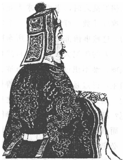
李善长：明朝开国功臣，被封韩国公，任左丞相，后因牵边胡惟庸案被迫自杀，终年77岁。

其实，李善长被杀时，已经是一位白发苍苍、行动不便的八十老翁了，他又怎么可能谋反？再说这时距胡惟庸案已经十多年过去了，又有什么理由非要去追究不可呢？归根结底，说他谋反而加以诛杀，只是明太祖的一个借口罢了。朱元璋在有生之年以杀尽功臣，为子孙开路为己任，又怎么会独留下李善长这个开国功勋呢？当时的大臣都知道李善长是冤死的，可是谁都不敢明确向朱元璋提出