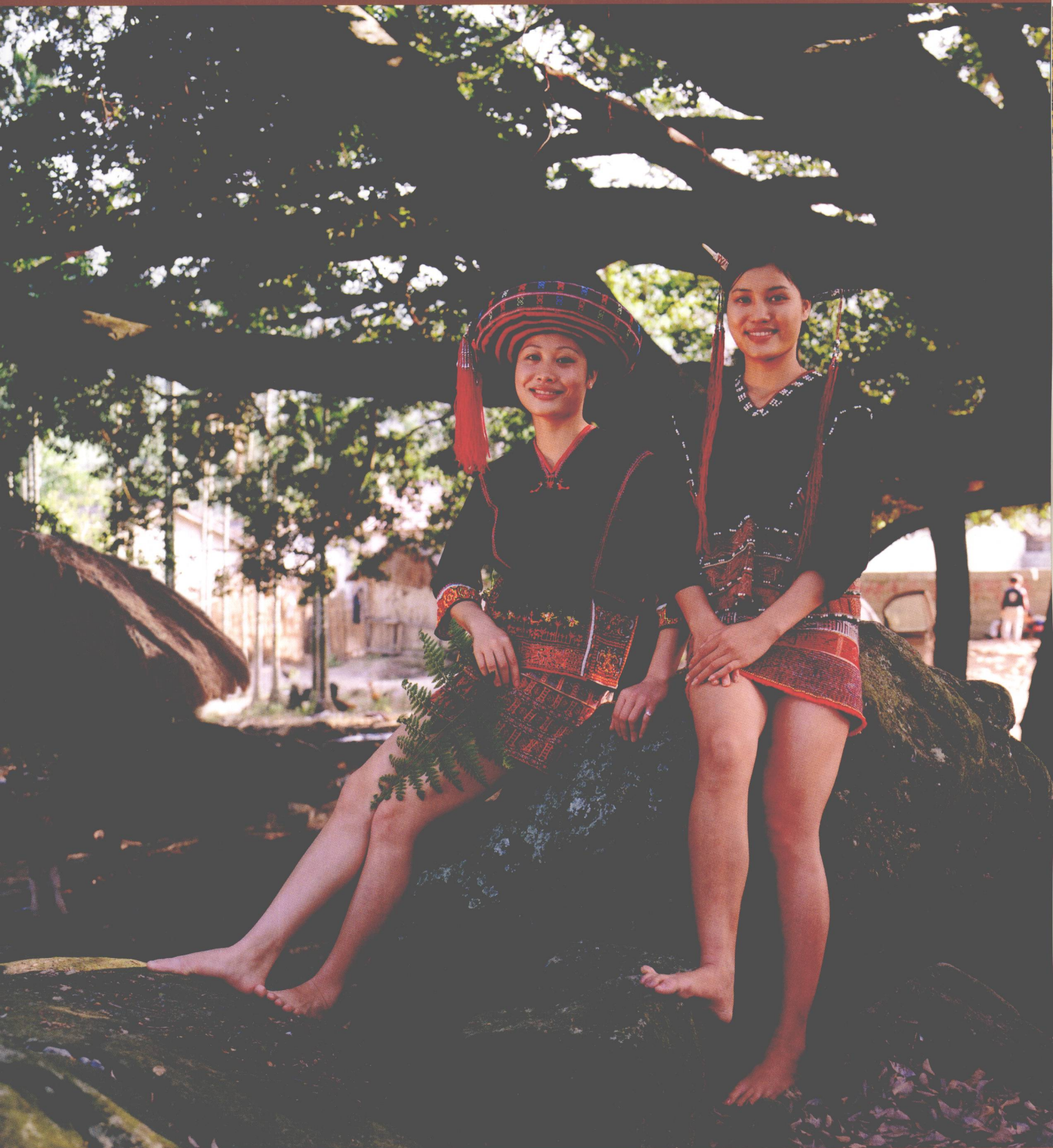
白沙黎族润方言妇女传统服饰 Traditional Li Style Dress For Run Women In Baisha