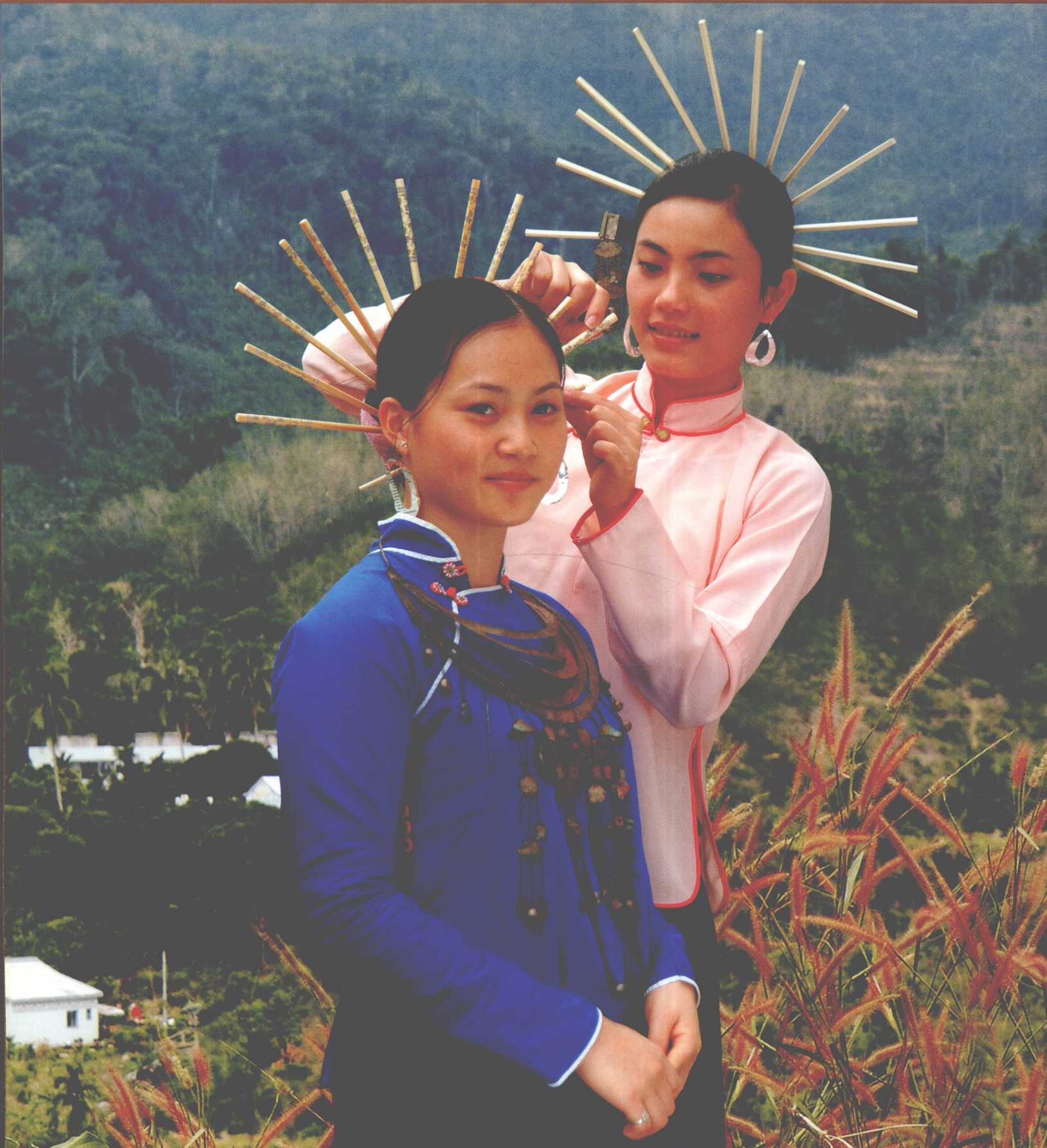
保亭黎族赛方言妇女传统服饰 Traditional Li Style Dress For Sai Women in Baoting