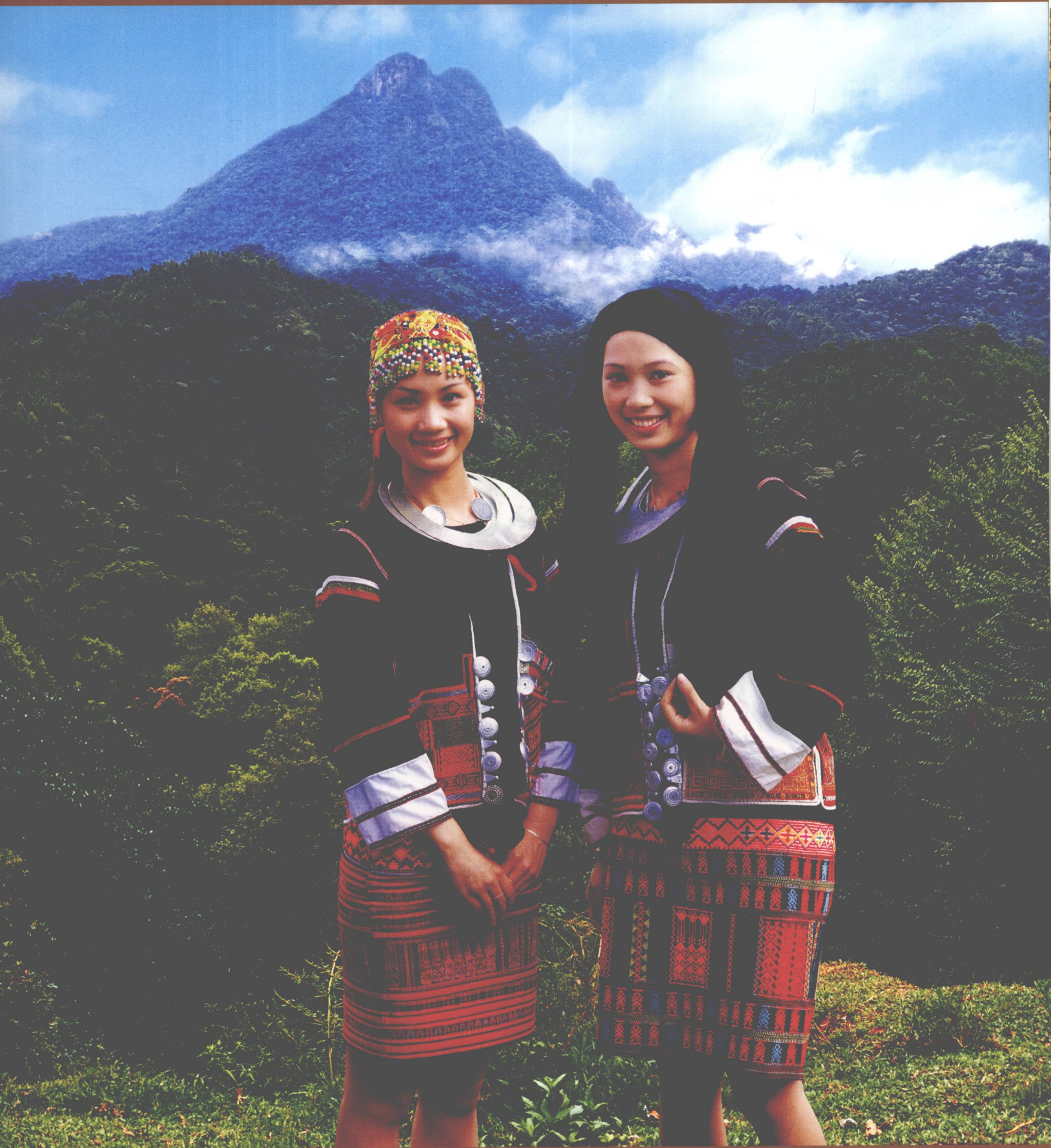
五指山黎族杞方言妇女传统服饰 Women's Dress In Shuiman, Wuzhi Mountain Area