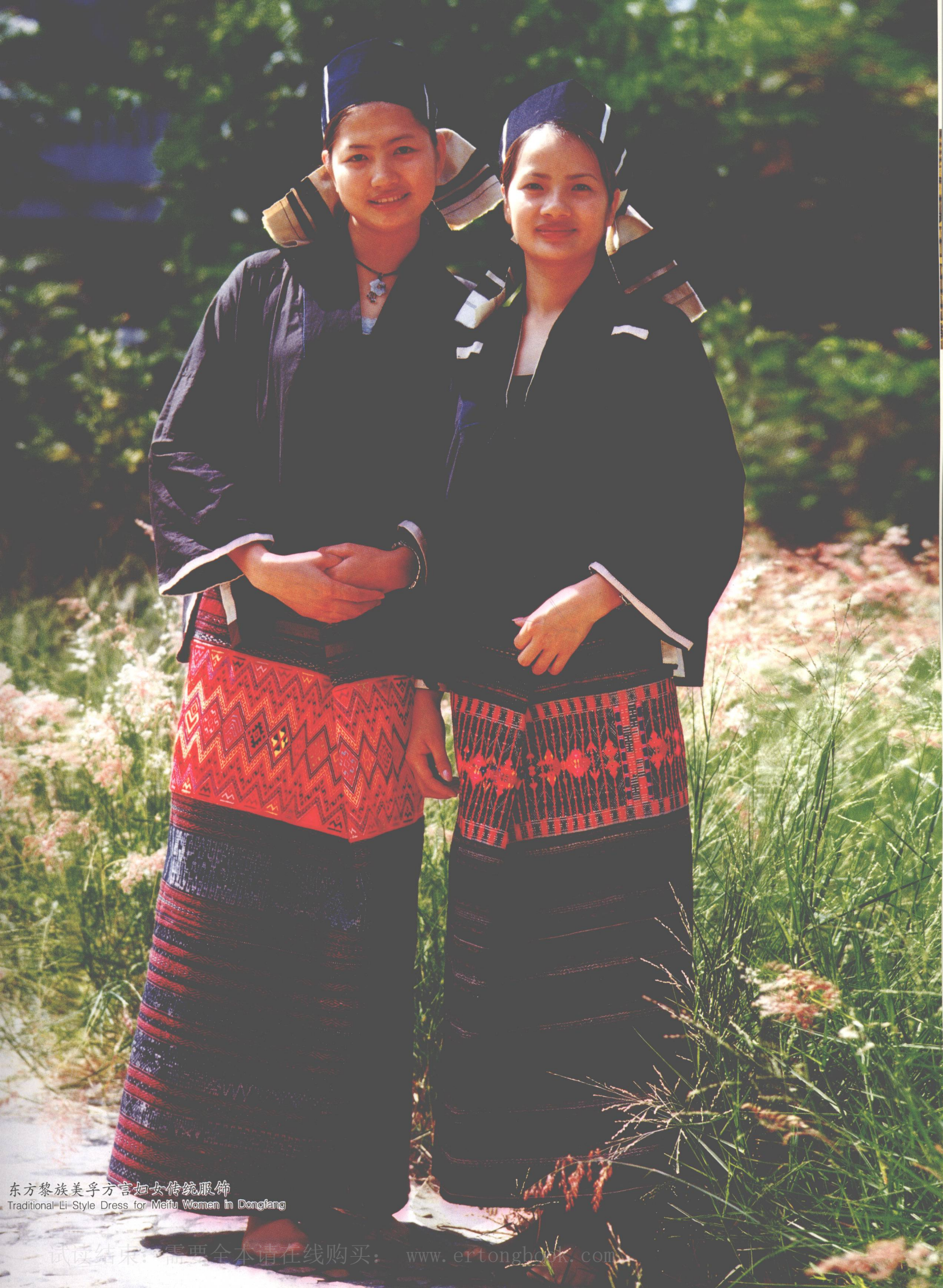
东方黎族美孚方言担女传统服饰 Traditional Li-Style Dress for Meifu Women in Dongfang