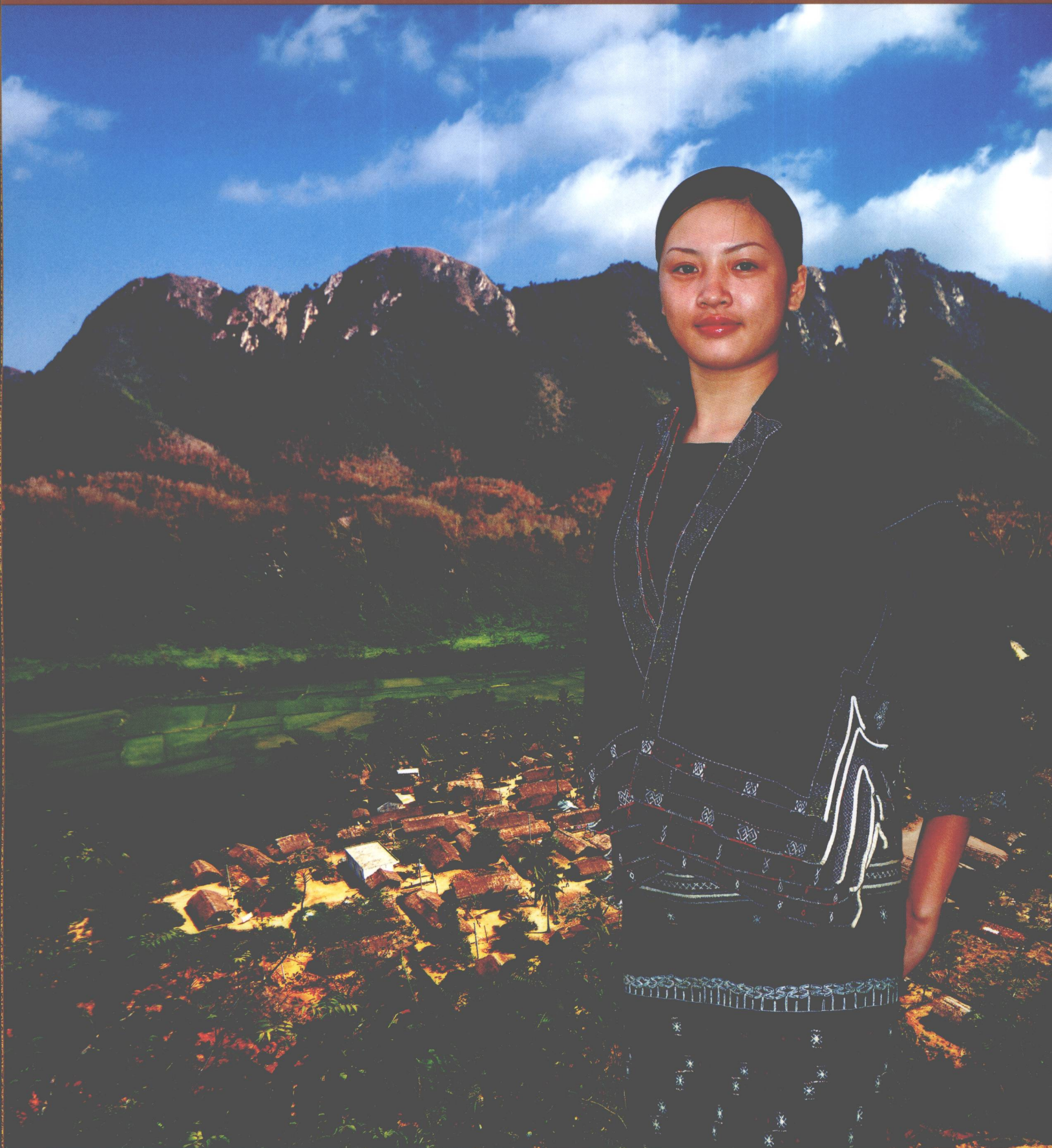
乐东黎族哈方言妇女传统服饰 Traditional Li Style Dress For Ha Women In Ledong