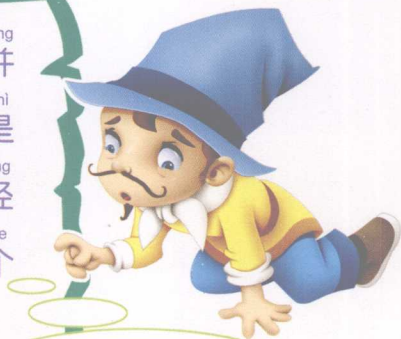
míng xī háo sēn 明希豪森

běn shū zhǔ rén gōng shàn yú chuī niú bìng 本书主人公，善于吹牛，并 chēng zì jǐ wéi shén mì qí shì tā zǒng shì 称自己为“神秘骑士”。他总是 xǐ huan bǎ zì jǐ huò yǒu huò wú de mào xiǎn jīng 喜欢把自己或有或无的冒险经 lì kuā dà qí cí jǐng gěi bié rén tīng shì ge 历夸大其词，讲给别人听，是个 yòu fēng qù yòu yōu mò de chuī niú dà wáng 又风趣又幽默的吹牛大王。