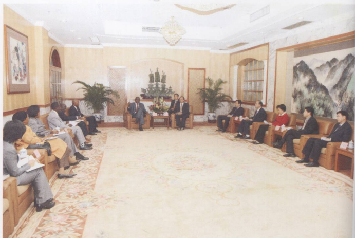
2008年12月18日，广东省副省长林木声在省政府会见几内亚矿业和地质部部长纳贝一行。林木声代表省政府及省长黄华华对客人一行访粤表示欢迎，并介绍广东经济社会发展的最新情况。