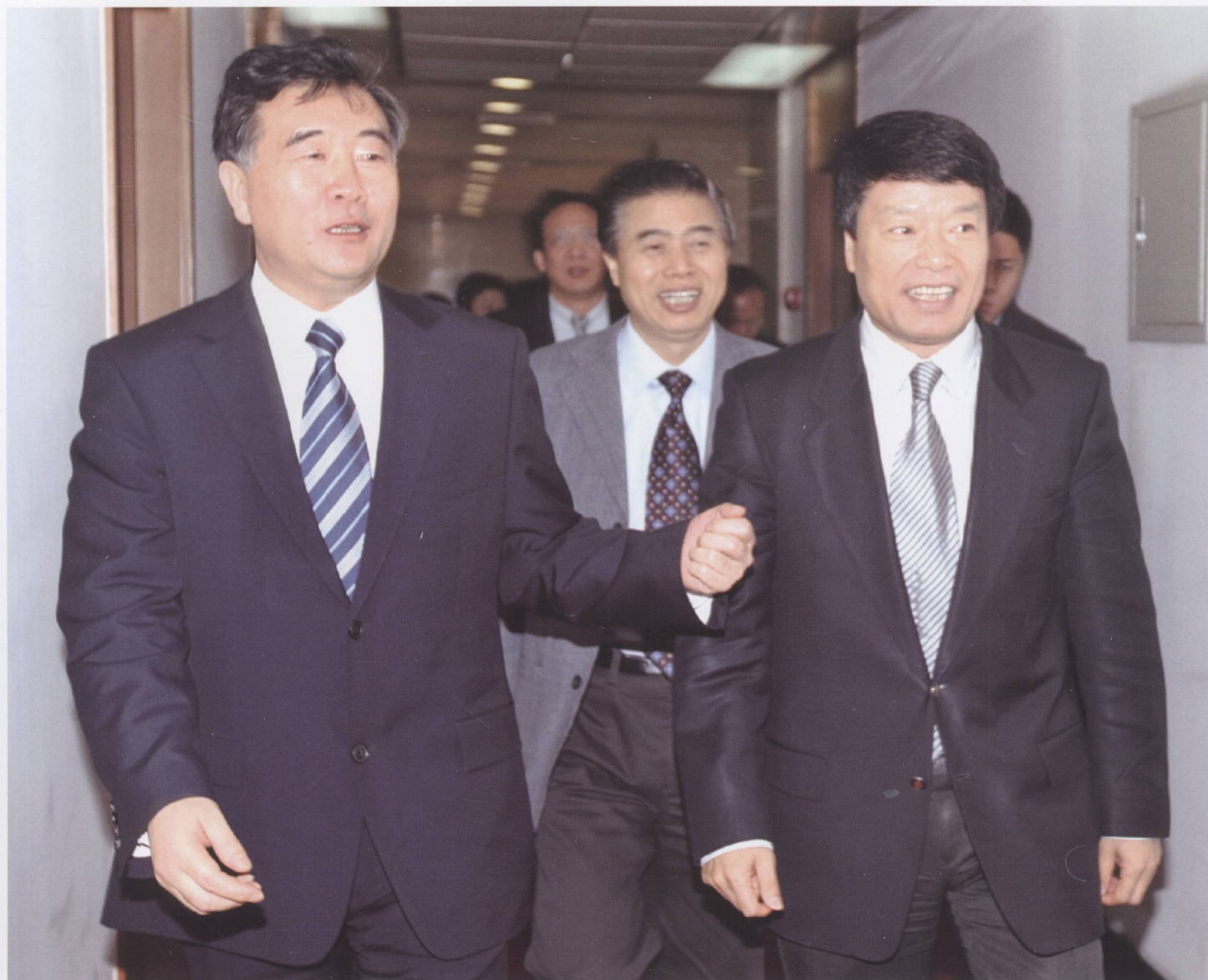
2008年3月14日，中共中央政治局委员、广东省委书记汪洋（左一），广东省委副书记、省长黄华华（右二），副省长林木声（左二）拜访国土资源部，与国土资源部部长、党组书记、国家土地总督察徐绍史（右一）研讨国土资源管理有关问题。