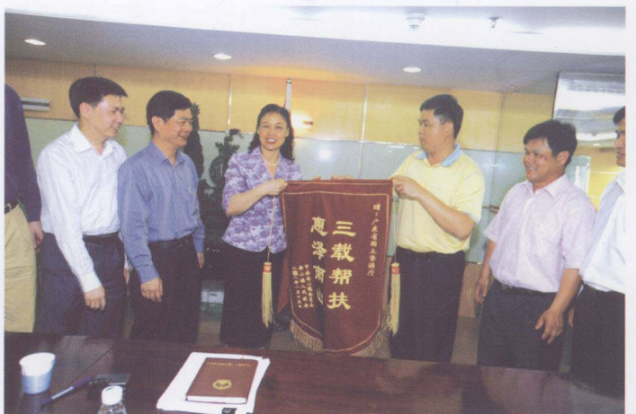
2008年4月10日，广东省国土资源厅厅长招玉芳(左三)代表省厅接过徐闻县南山镇长乐村送来的锦旗和感谢信。省厅在开展“固本强基”扶贫工作中，帮助当地解决突出问题，受到当地村民称赞。