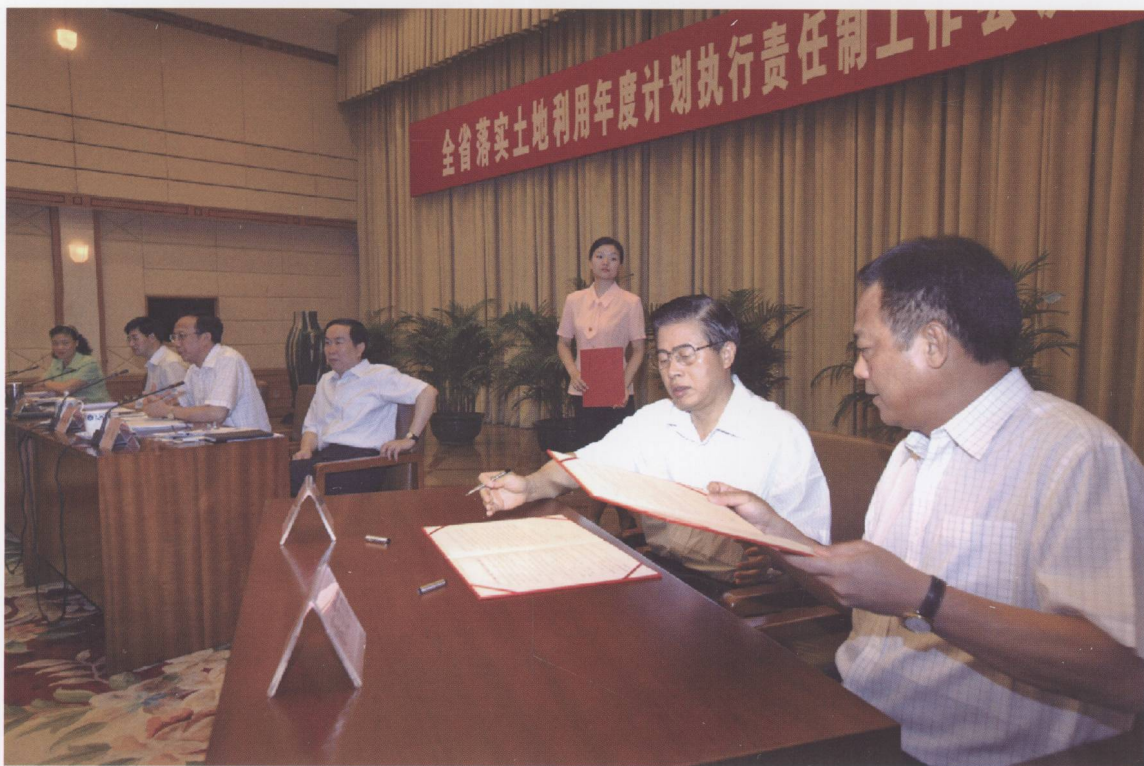
2008年6月25日，在全省落实土地利用年度计划执行责任制工作会议上，省长黄华代表省政府与全省21个地级以上市政府签订2008年土地利用计划执行责任书。