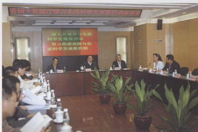
2008年11月，广东省副省长林木声到省国土资源厅调研指导学习实践活动第一阶段工作情况和开展“五个一天”和“四个一次”活动。