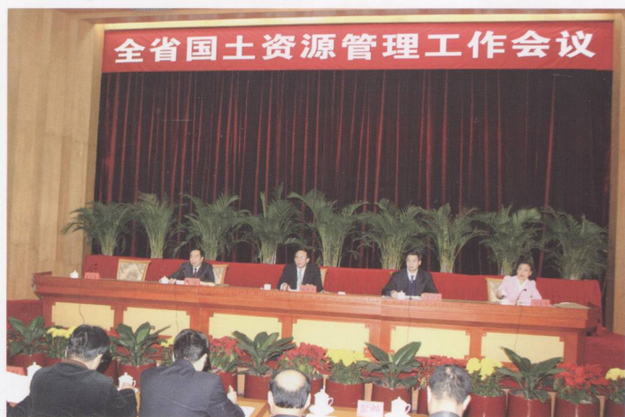
2008年2月25日，全省国土资源管理工作会议在广州珠江宾馆召开。广东省副省长林木声出席会议并作重要讲话。