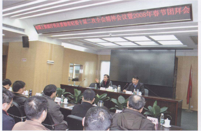
2008年2月2日，广东省国土资源厅召开传达贯彻省纪委十届二次全会精神会议暨2008年春节团拜会。厅长招玉芳传达了会议精神，厅党组成员，机关各处室、直属单位主要负责人出席会议。