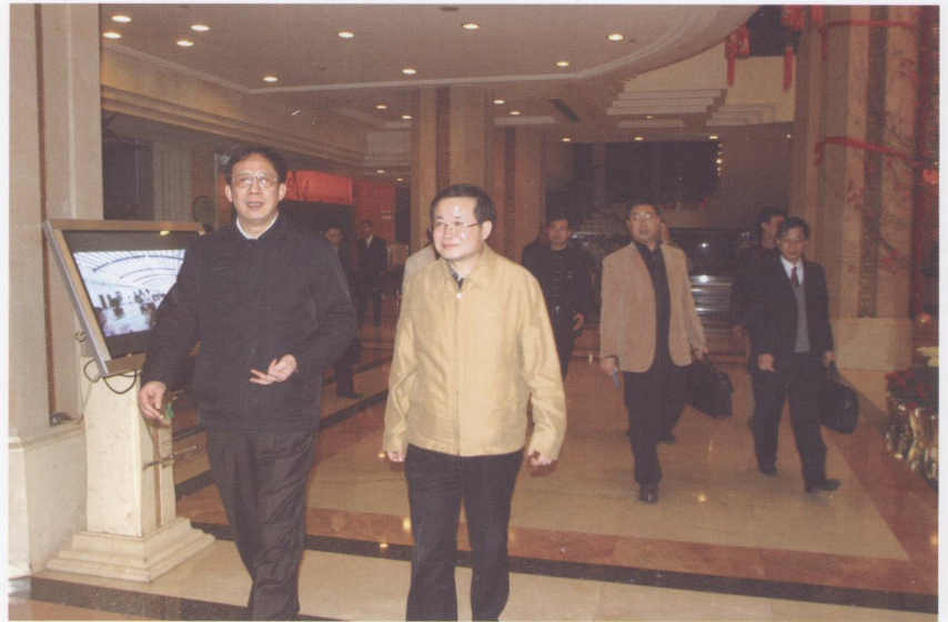
2008年1月19日，国家土地副总督察甘藏春（左二）在广东调研时，对广东国土资源管理工作取得的成就给予肯定。