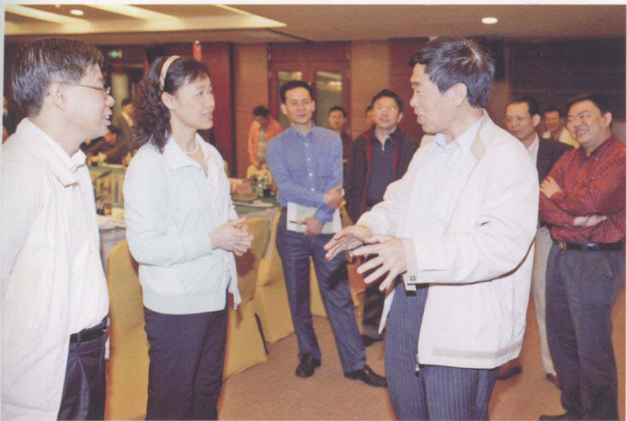
2008年3月20日，广东省土地规划专家咨询会在清远举行，广东省国土资源厅厅长招玉芳(左二)就《省土地利用总规大纲》和《省市县级土地利用总规大纲编制技术指引》征求专家意见。