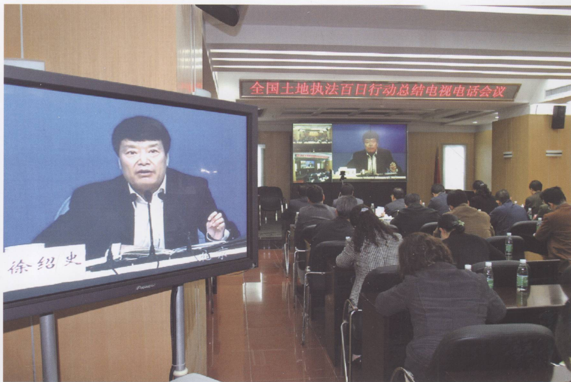
2008年1月21日下午，全国土地执法百日行动总结电视电话会议在京召开。国土资源部部长徐绍史对前段土地执法百日行动工作进行总结，并对下一步工作进行部署。图为广东分会场。