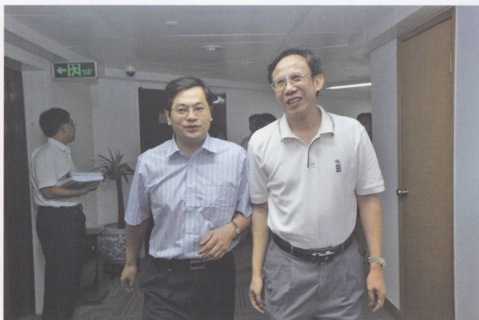
2008年7月8日，由国家安监总局副局长孙华山（左一）率领的检查验收组一行10人，赴广东省检查验收全面整顿和规范矿产资源开发秩序及“回头看”行动工作并作指导。图为孙华山与副省长林木声亲切交谈。