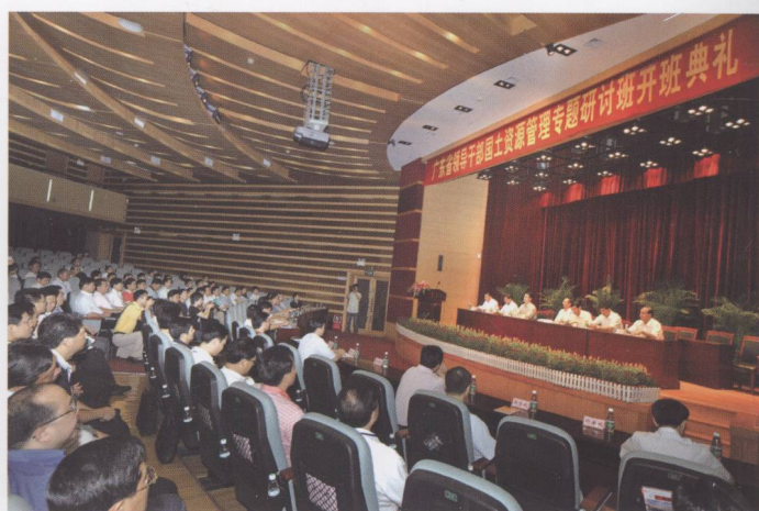
2008年6月16日，广东省领导干部国土资源管理专题研讨班在华南农业大学开班。广东省副省长林木声参加开班仪式。