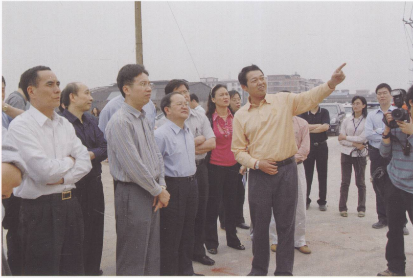
2008年4月28日，国土资源部副部长、国家测绘局局长鹿心社（左四）一行在佛山市实地考察禅城区祖庙东华里片区、禅城区澜石不锈钢交易中心、南海区石肯村委会旧厂改造点。