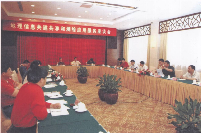
2008年11月5日，国家测绘局副局长闵宜仁一行来粤就广东省地理信息共建共享和测绘成果应用服务的政策、工作机制及政府宏观管理决策、应急服务、社会化应用的开展情况及出台的相关政策等方面进行调研。