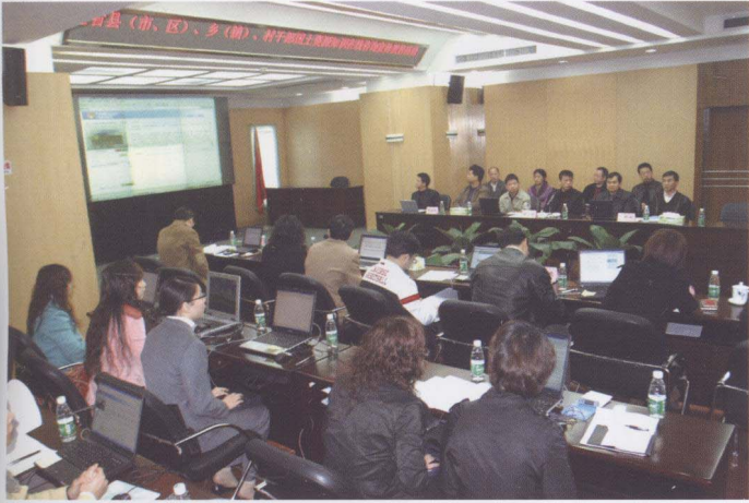
2008年1月23日，省国土资源厅在机关五楼会议室举行县(市、区)、乡(镇)、村干部国土资源知识在线咨询活动。厅长招玉芳等出席活动。