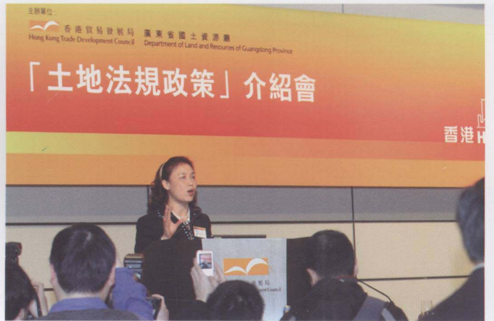
2008年2月26日，广东省国土资源厅厅长招玉芳(图中)率省土地法规政策宣讲团赴香港，在香港会展中心大厅召开土地法规政策介绍会。