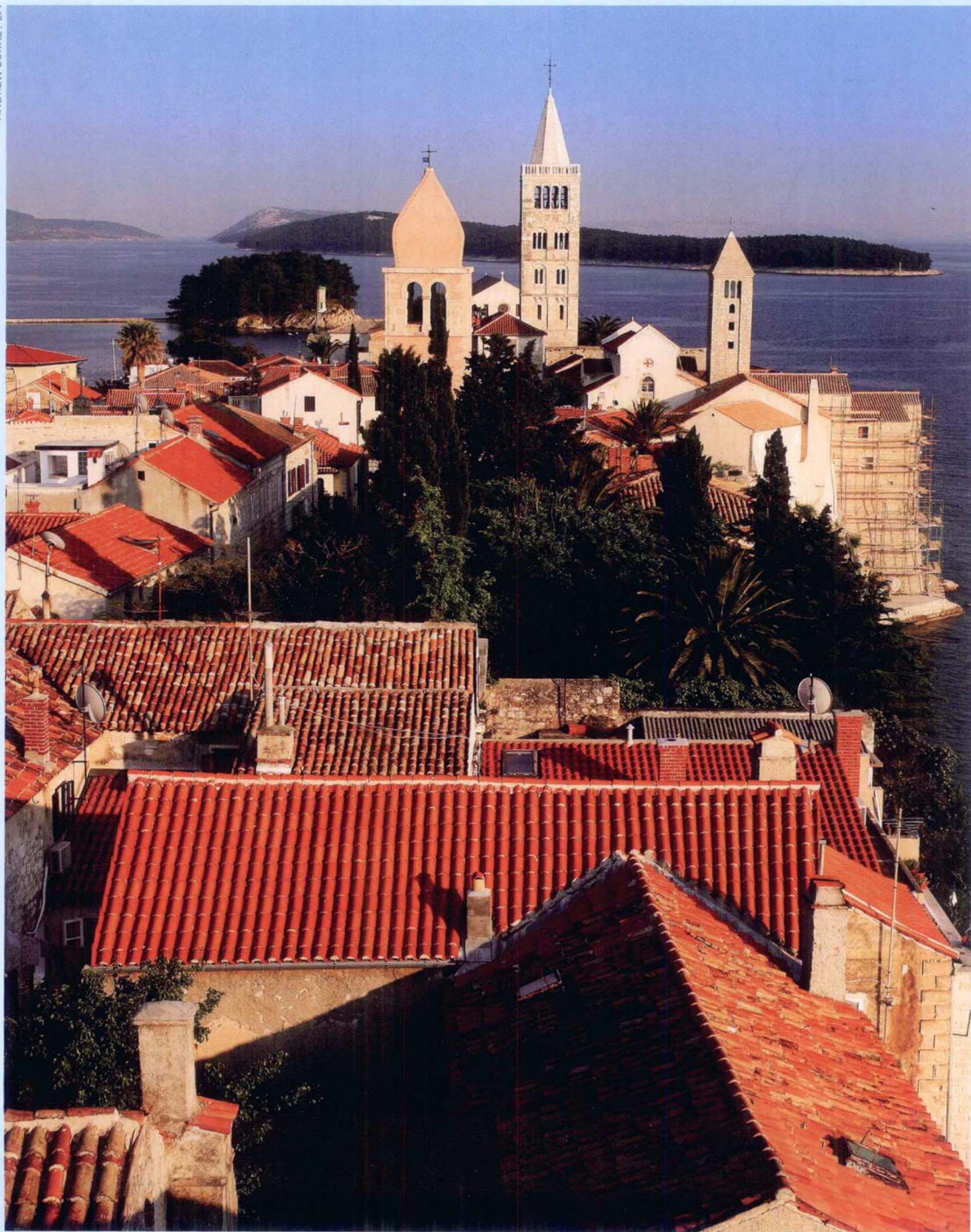
在克罗地亚中世纪风格的Rab，从钟楼上远眺大海。