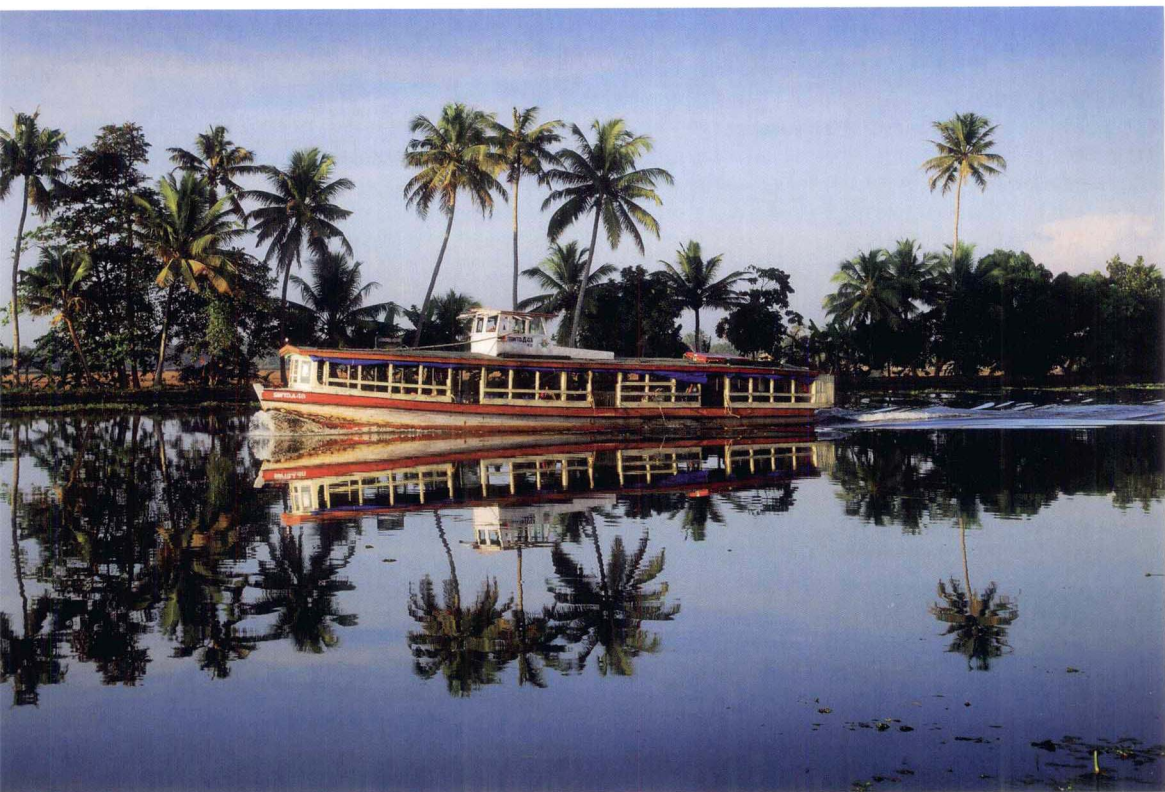
在印度的喀拉拉邦乘船游览，在隐秘的水域里，探索世界上少有人知的最佳海滩。