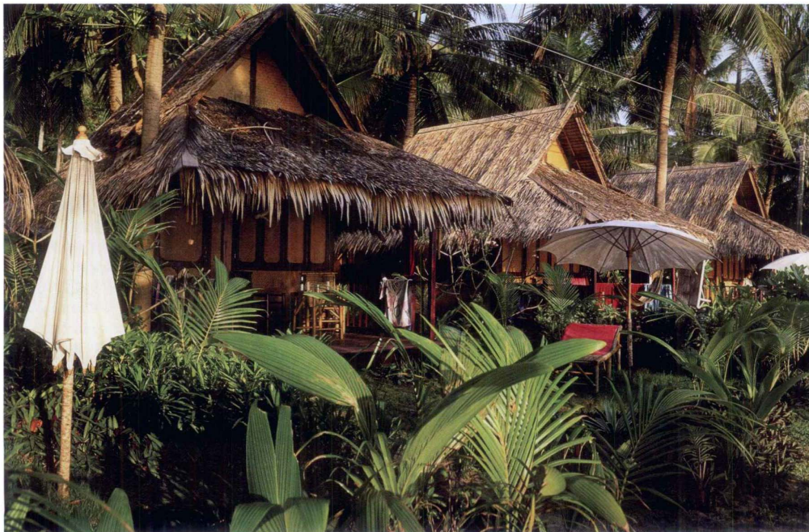
在帕岸岛的Thong Nai Pan海滩的度假村，住在一所棕榈环绕的茅草房内，日子过得像一个君王。

从大陆乘坐大红猫号（Big Red Cat）渡船可以到达海岛。渡船每天16班，每周7天都运营。更多信息，见 www.seastradbroke.com 。