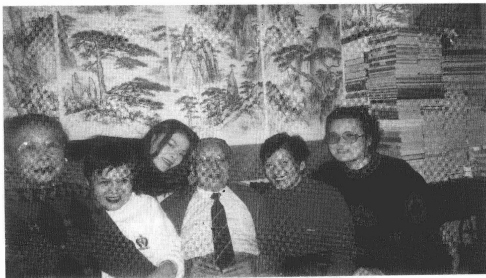
1994年，摄于沈醉家客厅