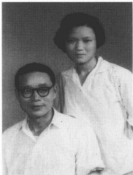
1963年，沈醉与娟娟合影