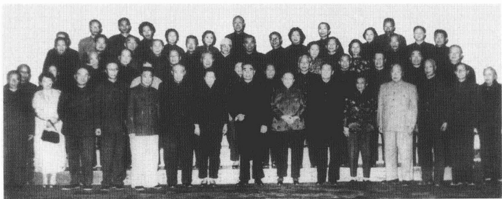
1963年11月，周总理在人大会议堂接见在京特赦人员及家属