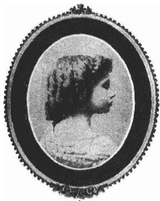
1887年，迪思拍摄的海伦·凯勒照片。

置身于这个绿色花园里，真是心旷神怡。这里有趴在地上的卷须藤和低垂的茉莉，还有一种叫做蝴蝶荷的十分罕见的花。因为它那容易掉落的花瓣很像蝴蝶的翅膀，所以名叫蝴蝶荷，这种花发出一阵阵甜丝丝的气味。但最美丽的还是那些蔷薇花。在北方的花房里，很少能够见到我南方家里的这种爬藤蔷薇。它到处攀爬，一长串一长串地倒挂在阳台上，散发着芳香，丝毫没有尘土之气。每当清晨，它身上朝露未干，摸上去是何等柔软、何等高洁，使人陶醉不已。我不由得时常想，上帝御花园里的曝光兰也不过如此吧！