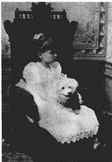
童年的海伦生活在没有声音的黑暗世界里，只有厨师的女儿和小狗是她的玩伴，时年7岁。

渐渐地，我可以用手去摸索各种东西，分辨它们的用途。或者揣摩别人的动作、表情，来明了发生什么事，表达自己想说的、想做的，我渴望与人交流，于是开始做一些简单的动作，摇摇头表示“不”，点点头表示“是”，拉着别人到我这里，表示“来”，推表示“去”。当我想吃面包时，我就以切面包、涂奶油的动作表示。想告诉别人冷时，我会缩着脖子，做发抖的样子。