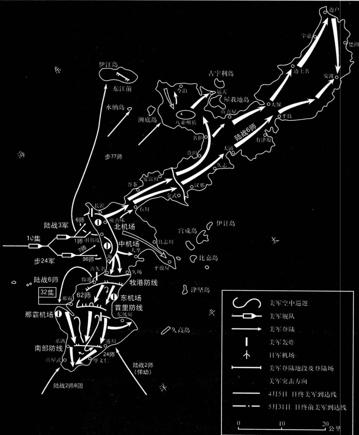
右图：美军冲绳岛登陆作战经过要图。