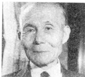
小泽治三郎 | Jisaburo Ozawa

在这一战（莱特湾海战）之后，日本的海面兵力就变成了绝对性的辅助部队，除了某些特种性质的船只以外，对于海面军舰已经是再无用场可派了。