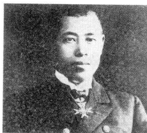
山本五十六 | Isoroku Yamamoto