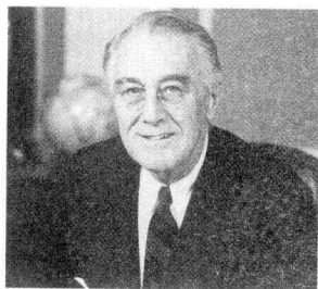
罗斯福 | Franklin Roosevelt

这不仅是一场长期的战争，也将是一场艰苦的战争。我们所需要的物资、金钱必须成倍地增加。