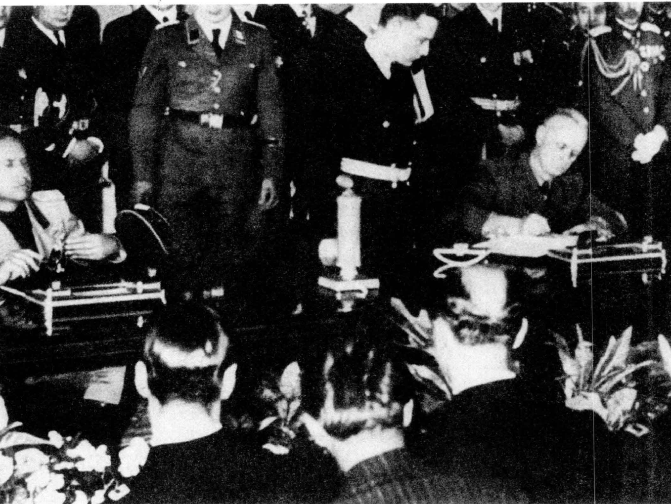
▲ 1940年9月27日，德、意、日三国代表在柏林签署了有效期10年的同盟条约。

斯麦群岛、摩鹿加群岛、帝汶岛，日军在开战初期也于泰国内进驻大批军力，以视状况进攻英属缅甸。