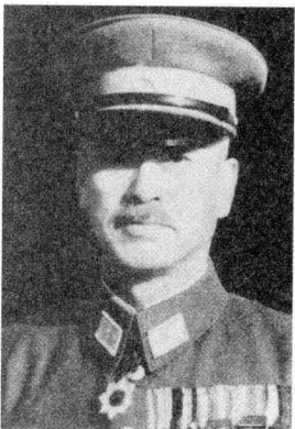
牛岛满 | Ushijima

旧日本帝国最后一个陆军大将，优 秀的战术家，1938年武汉会战时， 以一个旅团撼动了中国军队第五战 区数10万大军，1945年以32军军 长坚守冲绳，获得了对对手的高度评 价，被称为美国陆军最难对付的敌 人。美国军事历史学家认为他是美 军在太平洋战场上遇到的最厉害的 对手之一。