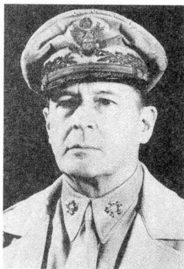
麦克阿瑟 | Douglas Mac Arthur

著名军事家，第二次世界大战时期 历任美国远东军司令、西南太平洋战 区盟军司令；战后出任驻日盟军最 高司令和“联合国军”总司令等职。 是美国奖章获得最多的一位军官， 也是唯一一个参加过第一次世界大 战、第二次世界大战和朝鲜战争的 美国将军。