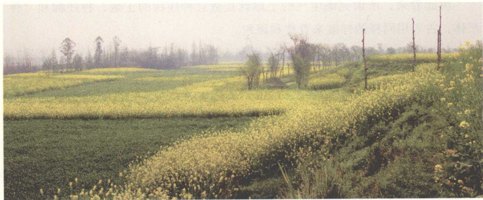
图1 广汉三星堆遗址。

土层完好无损的山上草木茂盛，色泽油油，苍烟若浮，云蒸雾霭，四时弥留，这样才是生气方钟未休。