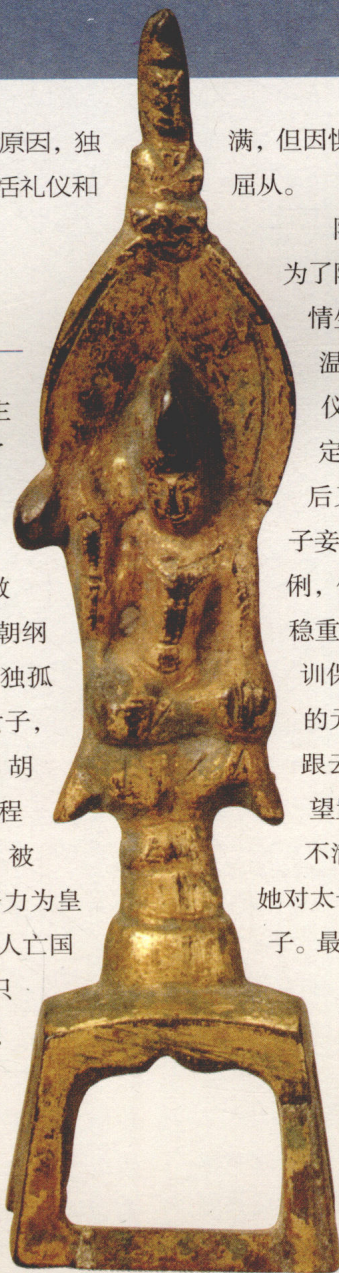
◀ (隋) 观音菩萨像

该像制作年代为隋仁寿二年(602)，通高9.8厘米，铜镀金，现收藏于首都博物馆。该坐像头上有宝冠与高发髻，刻画简略。身着通肩大衣，左手抚膝，右手扬起，坐下有垫，边角垂下。像底设有复合式台座，上部柱形，下部方框形。菩萨身后有尖顶舟形背光，背光后面有铭文：“仁寿二年三月八日王仁弟子王竟敬造。”