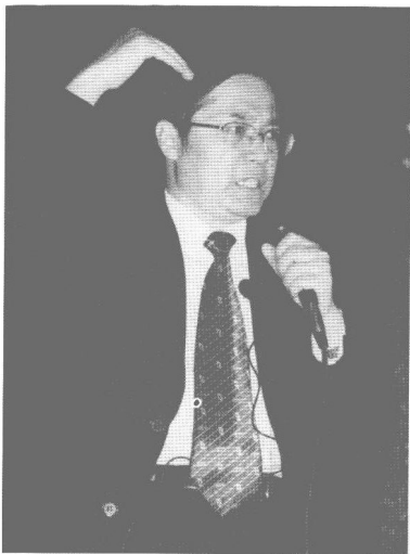
作者在清华大学大礼堂，面对几千名清华学子做全脑学习风暴激情演讲。