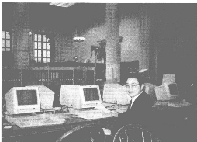
作者在哈佛大学 图书馆里。