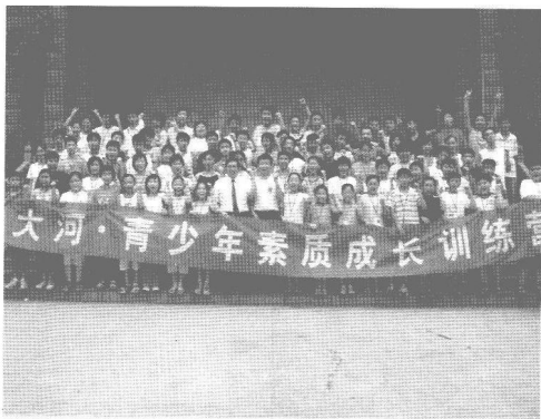
作者给河南青少年素质成长训练营做全脑学习培训课程后与学生们合影。