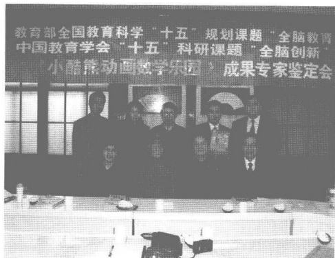
作者参加教育部全国教育科学“十五”规划课题“全脑教育”、中国教育学会“十五”科研课题“全脑创新”成果专家鉴定会。