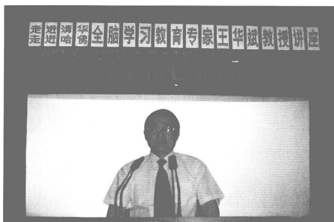
作者在新疆给广 大中学生做全脑 学习讲座。