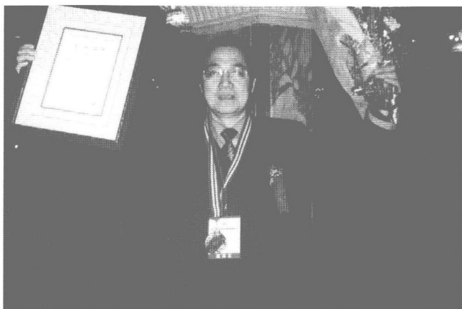
作者现任中国 国际家庭教育论坛 形象大使。