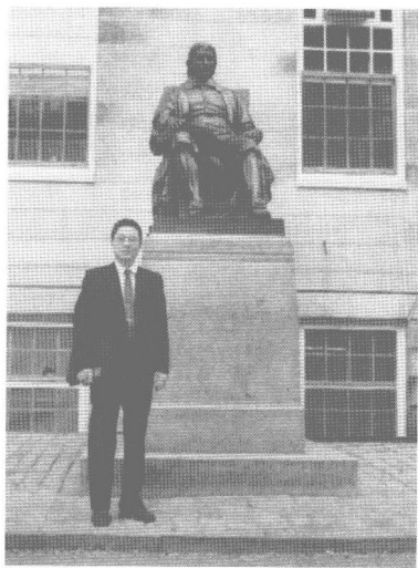
作者在哈佛大学哈佛塑像前留影，作者曾在哈佛大学做博士后研究，潜力研究学习教育方法。