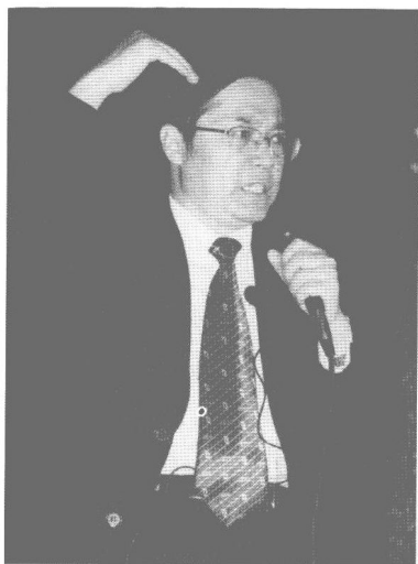
作者在清华大学大礼堂，面对几千名清华学子做全脑学习风暴激情演讲。