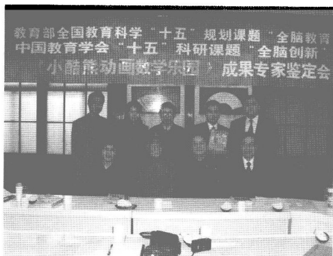
作者参加教育部全国教育科学“十五”规划课题“全脑教育”、中国教育学会“十五”科研课题“全脑创新”成果专家鉴定会。