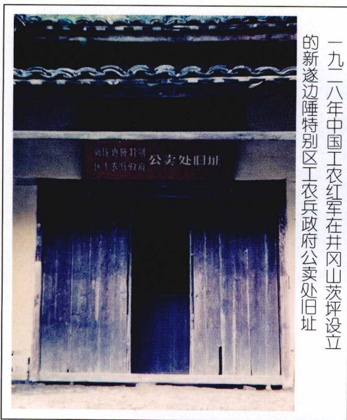
一九二八年中国工农红军在井冈山茨坪设立的新遂边陲特别区工农兵政府公卖处旧址