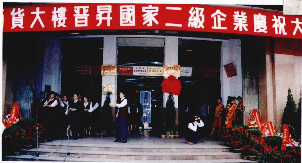
1990年国务院企业管理指导委员会授予南昌百货大楼国家二级企业称号，百货大楼举行挂牌仪式

国务院企业管理指导委员会 ENTERPRISE BUSINESS GUIDE COMMITTEE MEMBER OF THE STATE COUNCIL