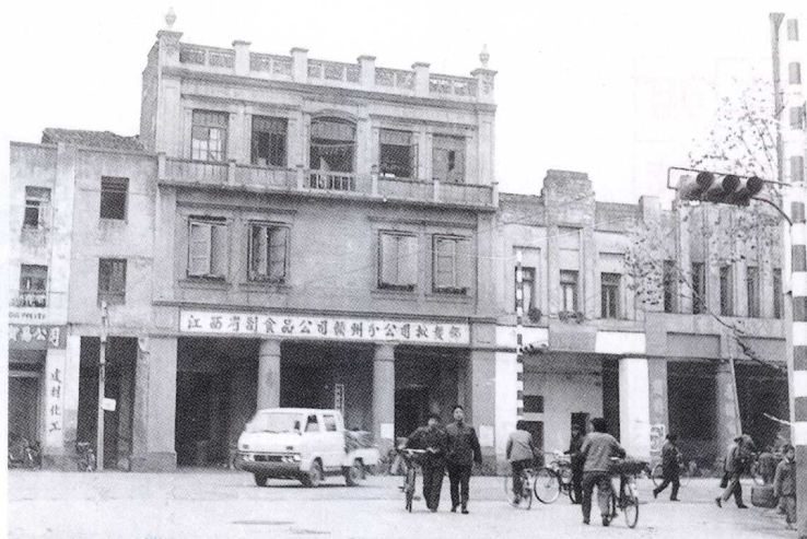
建国初期建立的赣南地区第一家国营商业机构——赣南贸易公司旧址