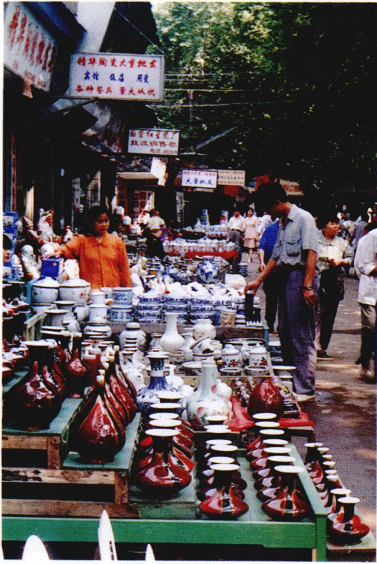
景德镇市瓷器一条街