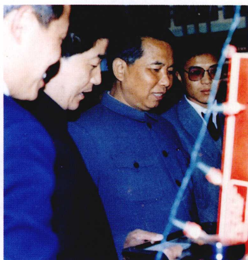
1989年省委副书记、省长吴官正和省委副书记刘方仁在江西展览馆参观宜春地区商办工业馆。