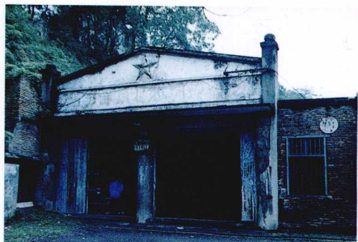
萍乡县商业部门全心全意为煤矿工人服务，把商业网点设到井口——高坑煤矿大井门市部