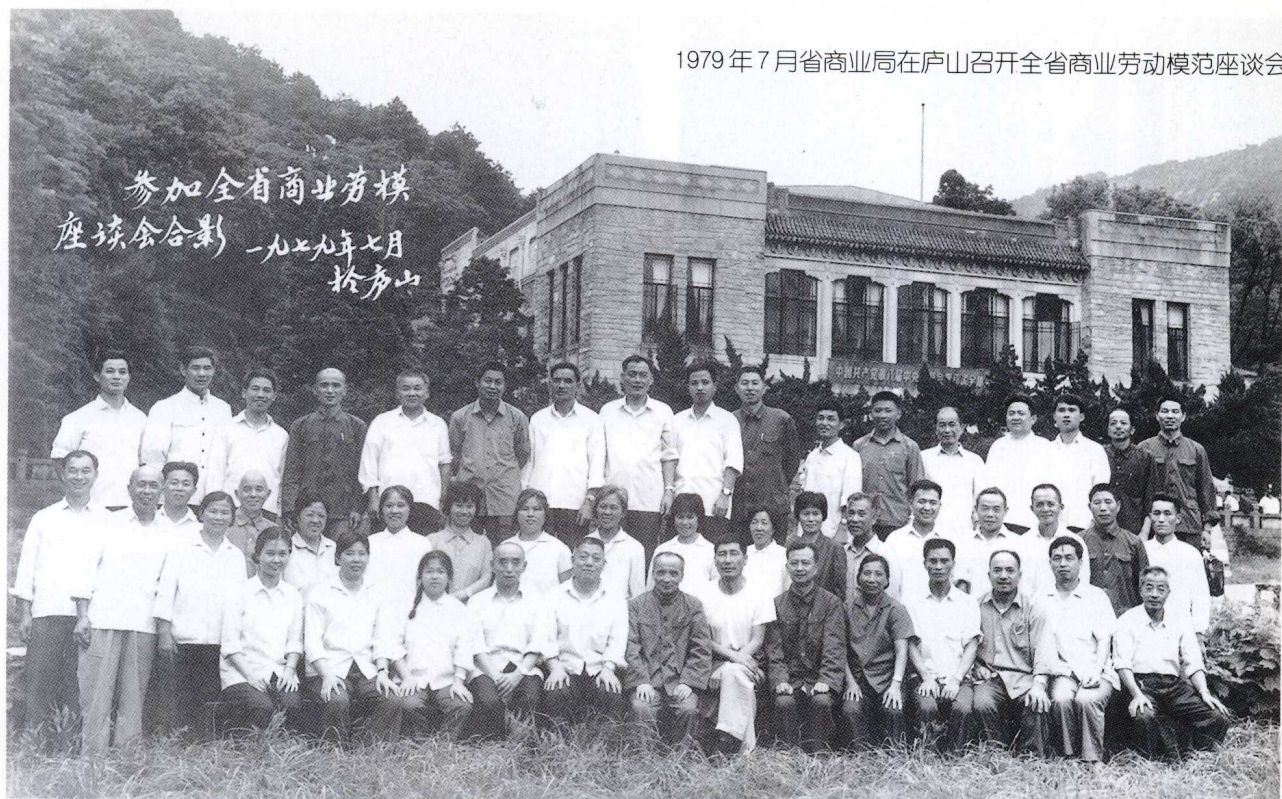
参加全省商业劳模 座谈会合影 一九七九年七月 庐山