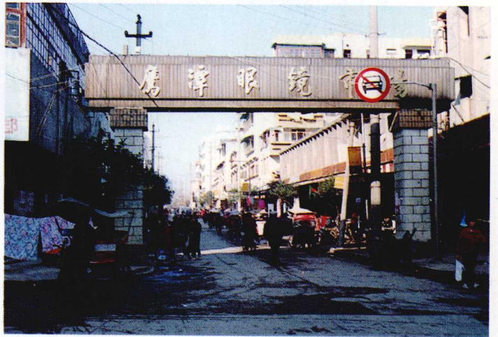
鹰潭市眼镜专业市场