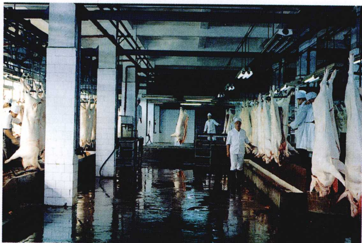
1957年建成投产的全省第一家肉类加工厂——南昌肉类联合加工厂