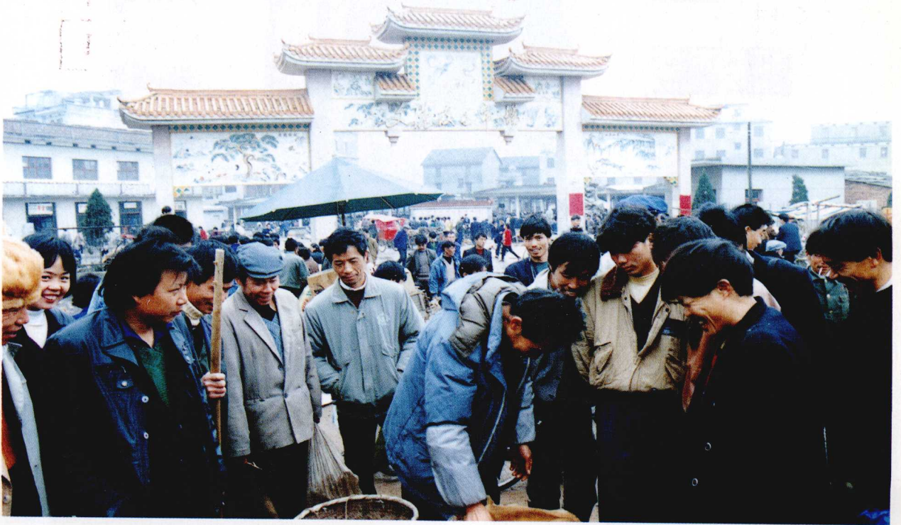
进贤县文港皮货专业市场