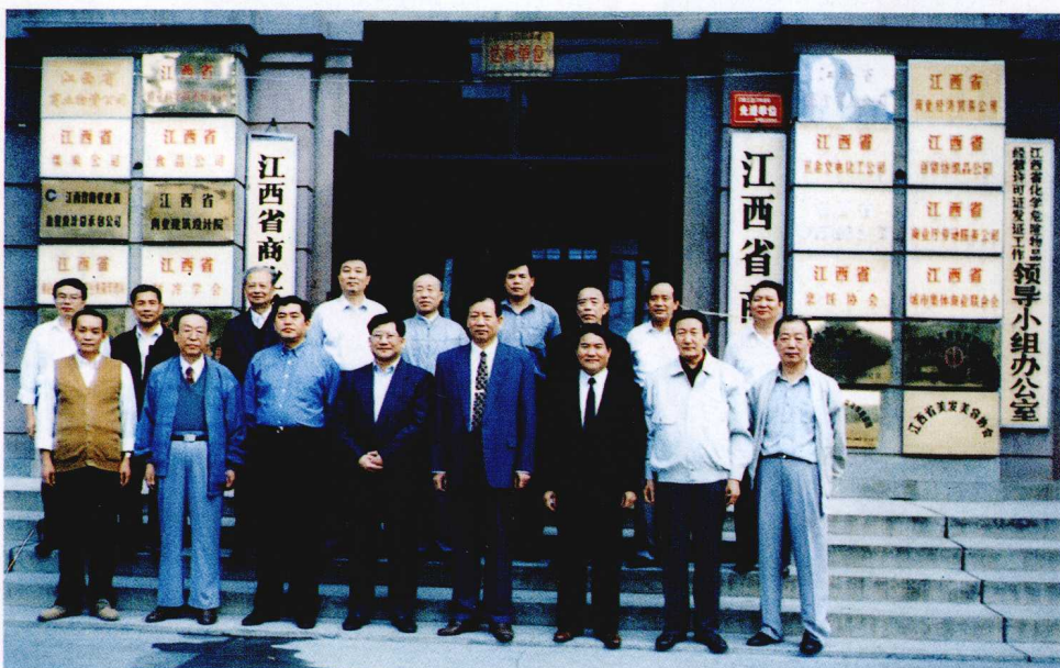
《江西省商业志》编辑委员会成员