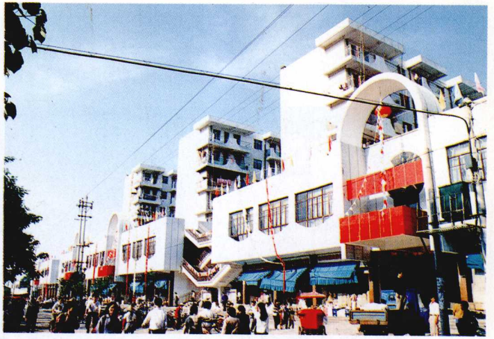
抚州市五皇殿布区专业市场