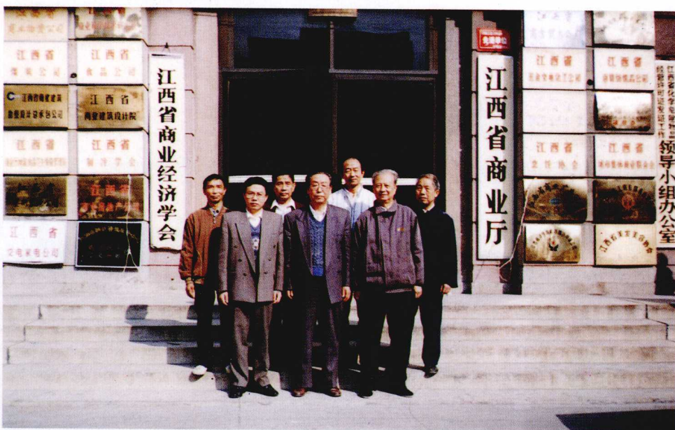
《江西省商业志》主编、副主编、编辑