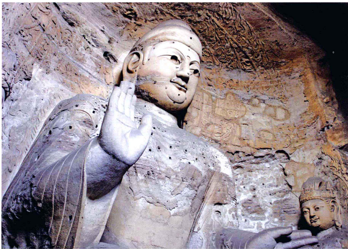
山西大同云冈石窟佛像（北魏）

我国云冈石窟的开凿，正值笈多王朝兴盛期。据文献记载，对于佛像的建造，不仅是一些粉本图样来取自印度，而且有梵僧亲自参加营造。云冈早期造像及其崖壁的贤劫千佛，多带有犍陀罗式佛像的艺术特点；早、中期的佛像在服饰的雕刻方法、背光中央的莲花、周围的纹饰图案，以及菩萨的宝冠、天王足下的夜叉等，都有笈多式佛像的艺术特点。