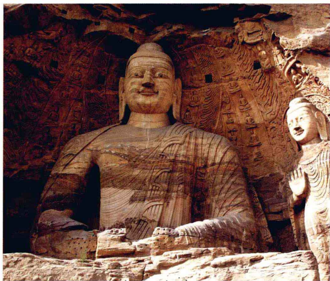
山西大同云冈石窟第20窟毗卢遮那佛像（北魏）