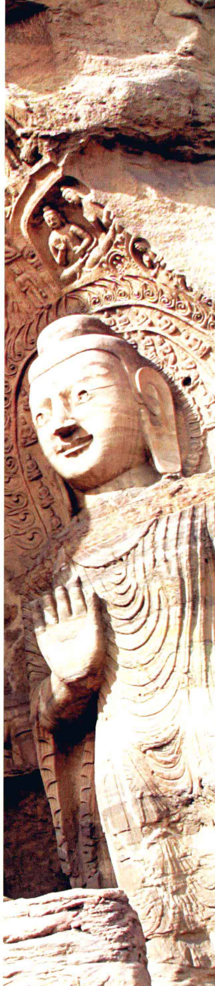
山西大同云冈石窟第20窟毗卢遮那佛像 侍从弟子像（北魏）