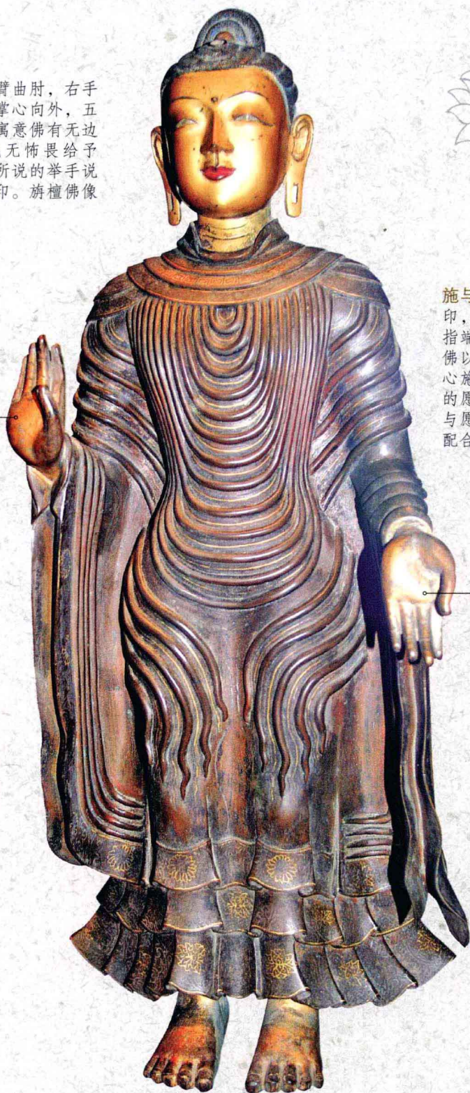
铜镀金旃檀佛像（清）

施与愿印： 又称与愿印，左手掌心向外，指端自然下垂，寓意佛以普救众生的慈悲心施，能使众生祈求的愿望得到实现。施与愿印常与施无畏印配合使用。