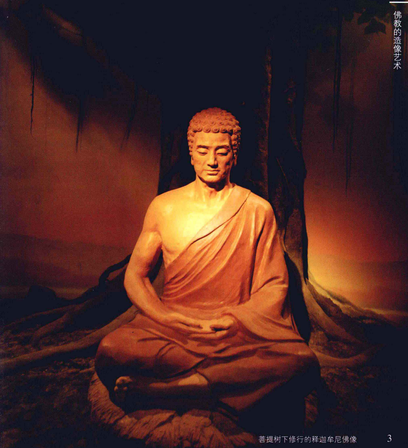
菩提树下修行的释迦牟尼佛像