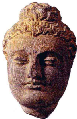
犍陀罗式石雕佛头像（印度）