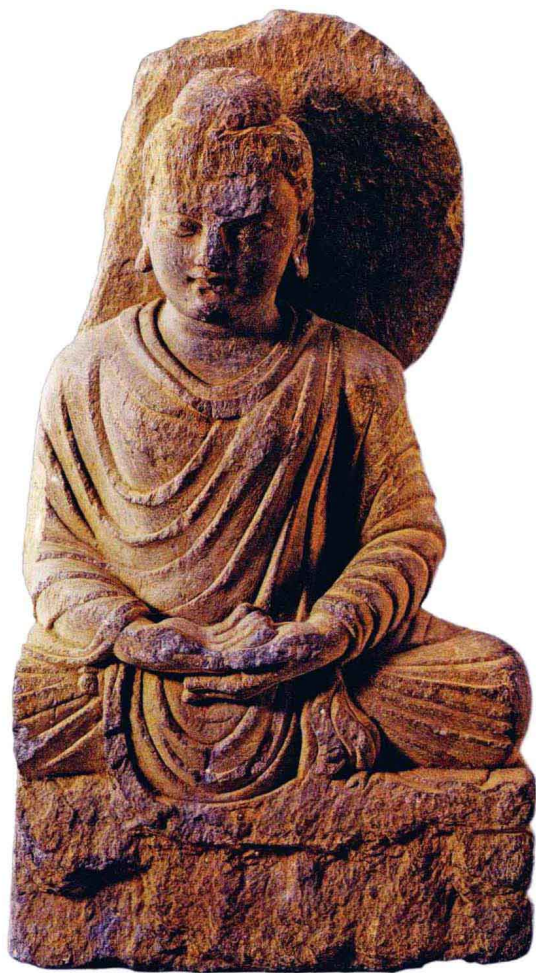
犍陀罗式石雕佛坐像（印度）

姿势 有立像、坐像、卧像等姿态。佛陀像大都采用坐姿，有全跏趺坐、半跏趺坐；菩萨、护法等则采用立像。