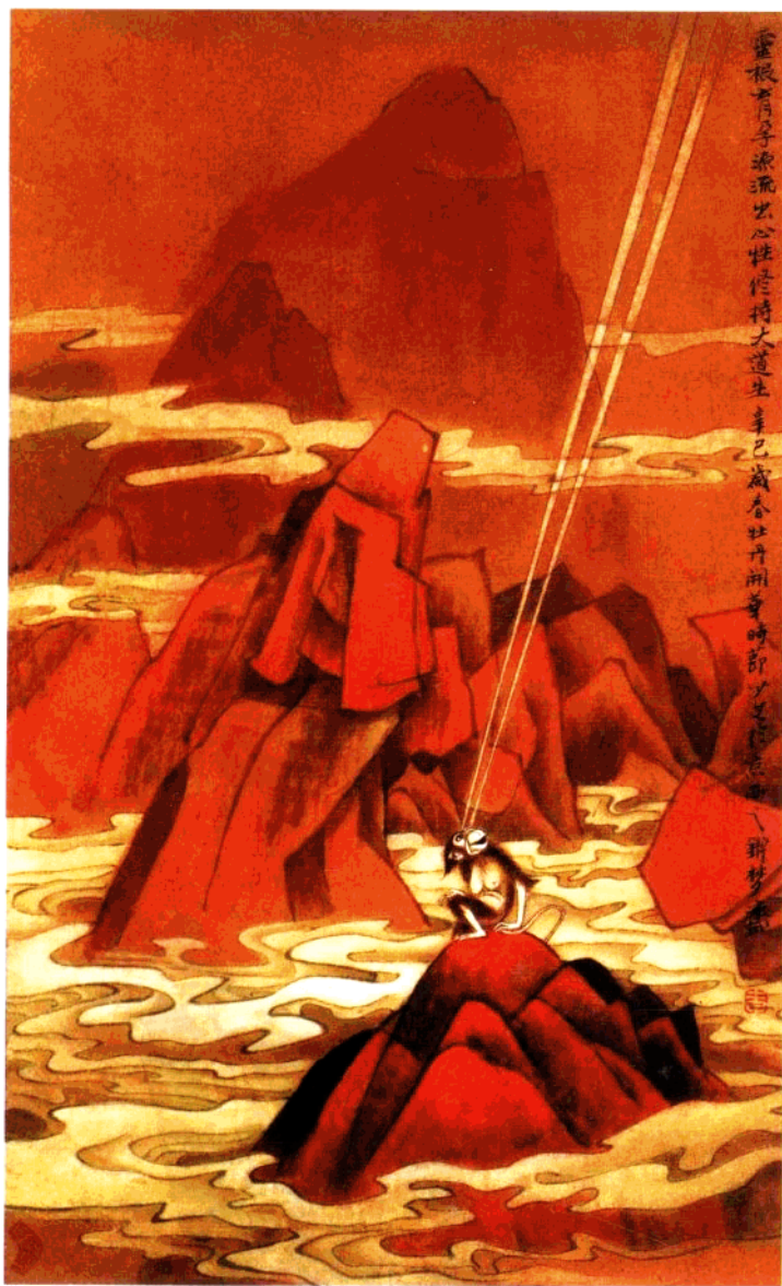
《美猴王》(国画) 李少文