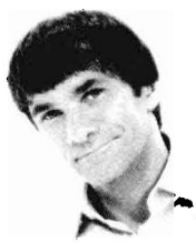
基思·法拉奇 (Keith Ferrazzi)