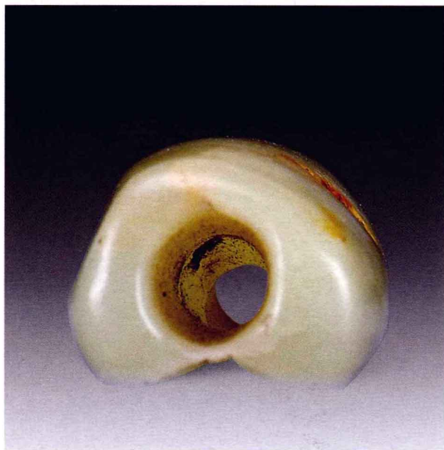
孔眼两端大，中央小

内的贯通孔是从两面对钻而成的，孔眼两端大，中央小；因对接的位置存在偏差，所以在管内壁产生了台阶痕。形制与辽宁阜新查海遗址出土的玉管形制相同，因此断代为兴隆洼文化。