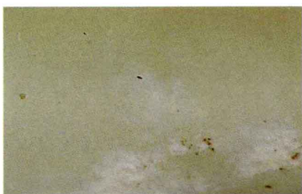
产于辽宁省岫岩县的透闪石玉

主图这件玉管也是如此，青黄色玉，局部有红褐色点状沁斑和开片状绺裂，是东北地区新石器时代玉器的共同特点，目前学者趋向于认为这类玉材是出产于辽宁省岫岩县的透闪石玉，即俗称的“东北老玉”。管体略扁圆，管壁外凸，管