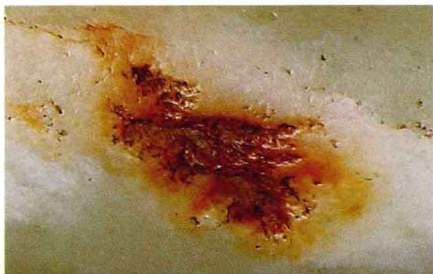
局部有红褐色点状沁斑

在中国南北方各地的新石器时代早期玉器中，普遍存在玉管这种玉器造型，虽然所用玉材各不相同，但在制作工艺方面具有很大的共性，即磨制粗糙，器型大多不甚规整，基本光素无纹。