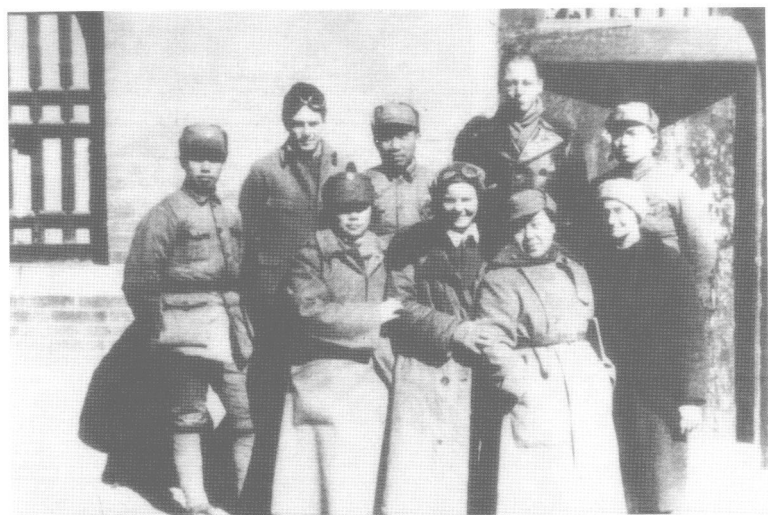
1938年2月，朱德总司令（后排中），彭德怀副总司令（后排右一），左权副总参谋长（后排左一），丁玲（前排右二），康克清（前排左一），与美国友人弗朗西斯·鲁特（前排左二），朱莉·克拉克（前排右一），约翰·福斯特（后排右二），查理·希金森（后排左二）在山西洪洞八路军总部驻地马牧村合影。