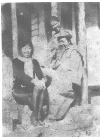
1938年春，丁玲（右）与 萧红（左）及西北战地服务团团 员夏莘非（中）在西安。