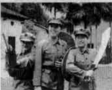
图1-1-8 江西井冈山 的“红色旅游”

及旅游黄金周和寒暑假,各地的“红色旅游”景点都游人如织,一些特大城市还在黄金周开通了赴井冈山等地的“红色旅游”专列。即使在平时,参加“红色旅游”的团队也在持续增加。许多单位还自