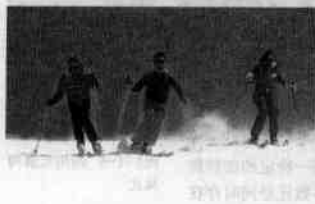
图1-1-3 阿尔卑斯山上滑雪的人

● 在地域上：不同地域的旅游资源有不同的地方特色。例如，阿尔卑斯山的山顶终年积雪，适宜旅游者前去滑雪；加勒比海的海岸风光秀丽、海风吹拂，吸引了不少帆船爱好者前去旅游。