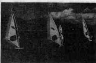
图1-1-4 加勒比海上的帆船

● 在季节上：同一旅游资源在不同的季节表现出不同的景观。例如，安徽黄山风景名胜区的四季景观就表现出很大的差异。