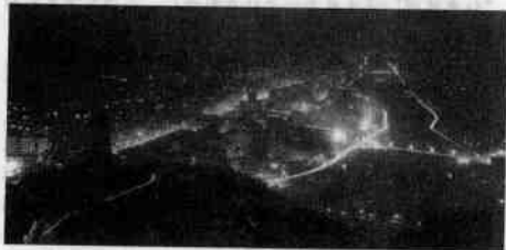
图1-1-10 陕西西安的夜景

“红色旅游”给革命老区奔小康和西部大开发创造了新契机。旅游业正逐渐成为革命老区的优势产业、特色产业和支柱产业,对促进老区人民脱贫致富发挥着不可替代的作用。