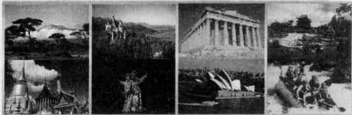
图1-1-2 风格迥异的旅游资源

● 在内容上:旅游资源既有自然的,又有人文的;既有景观性的,又有文化性的;既有古代遗存的,又有现代兴建的;既有实物性的,又有体验性的。