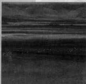
图1-1-7 四川红原县广阔的草原

旅游资源必须有吸引旅游者的功能才具备社会和经济价值。旅游者通过对美的事物的观赏,可以陶冶情操、开阔视野、增长知识。旅游资源的经济价值是通过观赏来实现的,观赏性越强,经济价值越高。