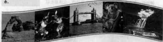
图1-1-1 精彩纷呈的旅游资源

旅游资源(tourist resources)指对旅游者(tourist)具有吸引力的自然存在和历史文化遗产,以及直接用于旅游目的的人工创造物。旅游资源既可以是风景的、文物的,也可以是风俗民情的。