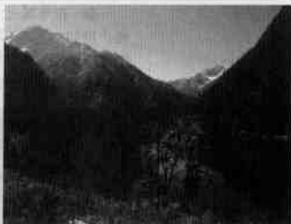
图1-1-6 四川九寨沟风光

● 在价值上:旅游资源的价值包括艺术欣赏价值、历史文化价值、科学价值、经济价值、美学价值等。对某一特定的旅游资源而言,虽然这些价值有主有次,但大多数还是同时存在的。