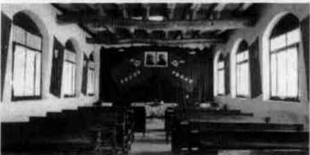
图1-1-9 河北西柏坡 中国共产党七届二中 全会会堂