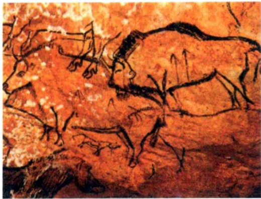
▲ 法国诺克斯洞穴岩画

图画也是早期历史的记录形式。在古代文化遗存中，有一种刻画在岩石上的带有原始风格的美术作品，人们通常称之为“岩画”。岩画有彩画、线刻、浮雕等形式。岩画既是艺术作品，也是历史记录。