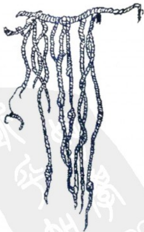
▲ 秘鲁古印加人结绳记事图形