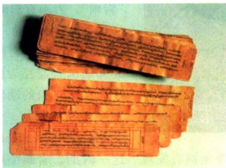
▲ 藏族民间艺人口传长篇史诗《格萨尔王传》的手抄本

在文字记录的历史已经相当成熟之后，许多历史学者依然肯定口传历史的意义。民间口传史诗得到越来越多的关注，人们对于不同时期的历史记忆也在“口述史学”中受到重视。