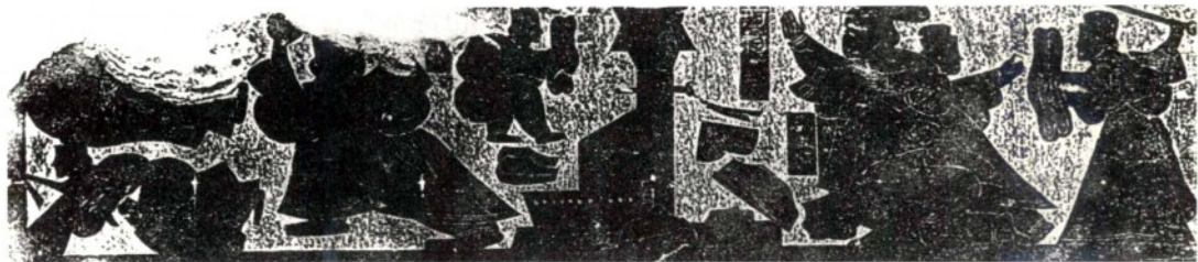
▲ 汉画像石“荆轲刺秦王”

画和陈列功臣的画像，作为表彰和纪念。据《旧唐书·太宗纪下》记载，贞观十七年(643)，唐太宗诏令为24位功臣作画像于凌烟阁。这也是记录历史的一种方式。