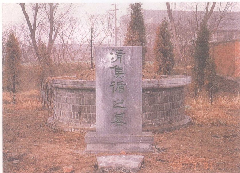
圖十四：民國八十八年一月三十一日參訪焦循墓