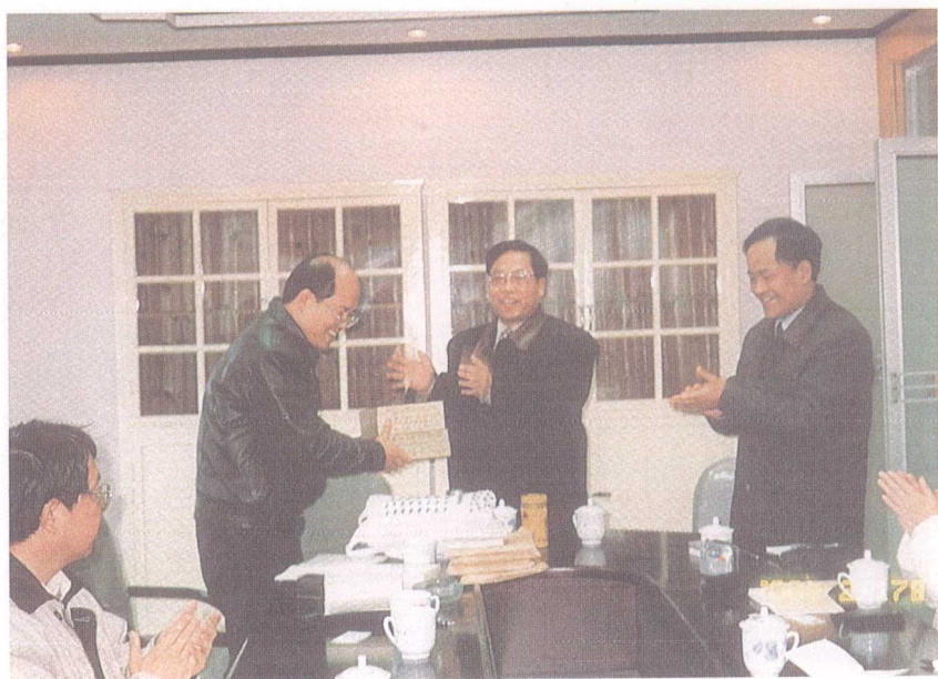
圖五：民國八十九年二月十七日拜訪黃山高等專科學校 接受該校贈送《戴震全集》