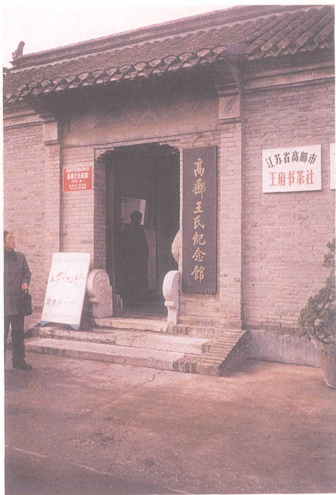
圖十三：民國八十八年二月一日參觀高郵王氏紀念館