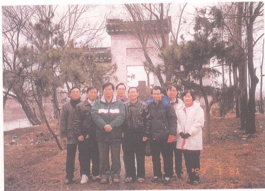
圖十二：民國八十八年一月三十一日參訪汪中墓