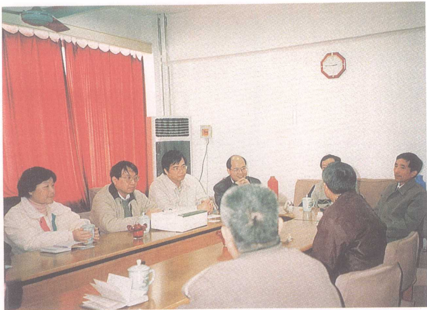
圖四：民國八十九年二月十二日在安徽考察時，與安徽省社會科學院研究人員座談（陳淑誼攝）