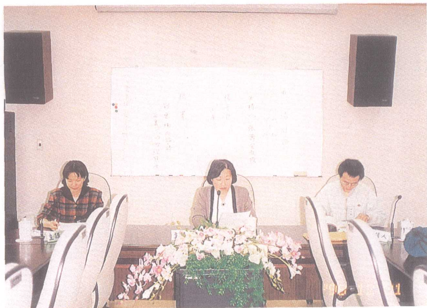
圖一：民國八十七年十二月三十一日第一次研討會 第一場討論會