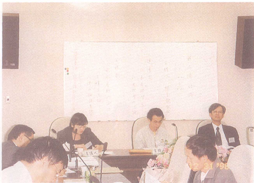
圖二：民國八十七年十二月三十一日第一次研討會 第三場討論會