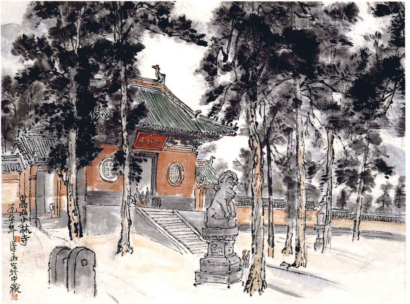
嵩山少林寺 1980年 47cm × 60cm