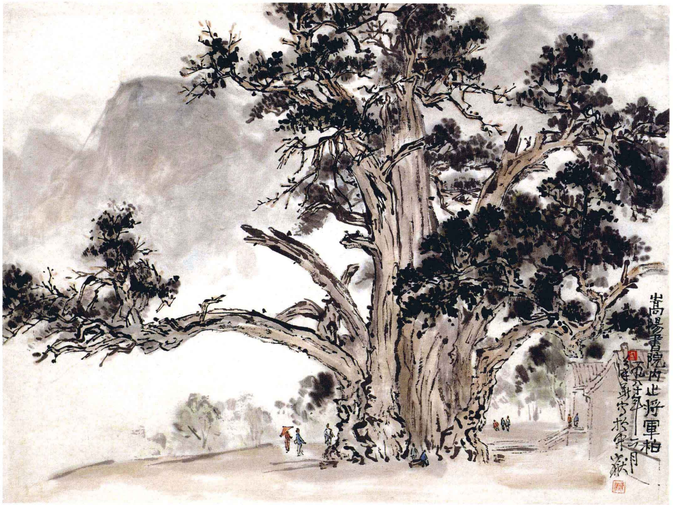
嵩阳书院之将军柏 1980年 47cm × 60cm