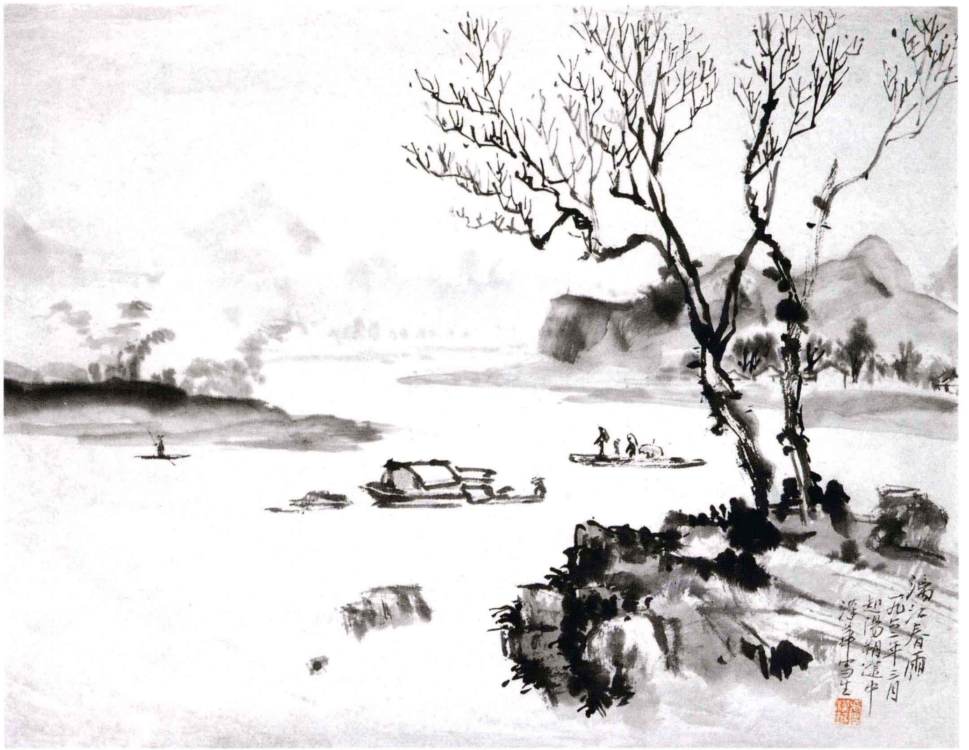
漓江春雨 1961年 34cm × 42cm