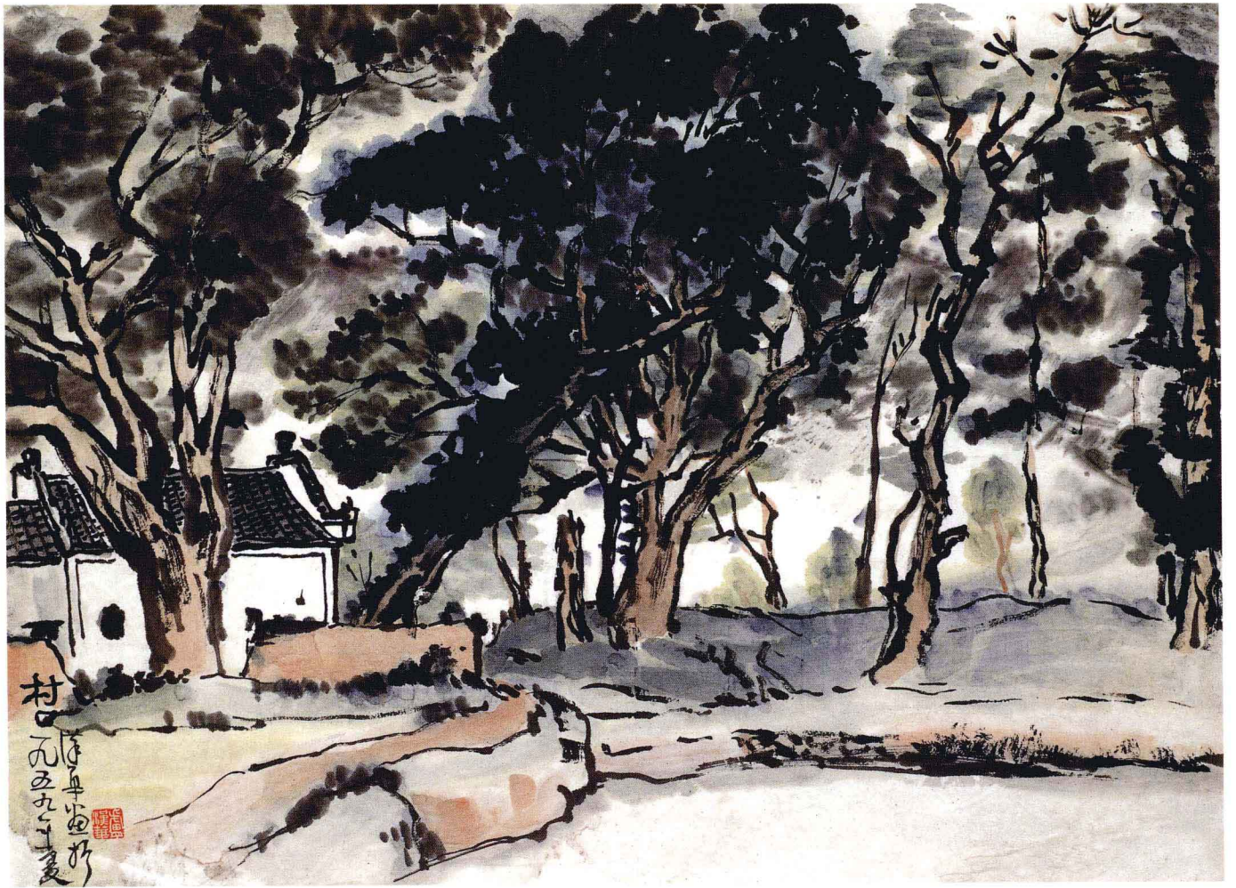
村口 1959年 34cm × 46cm