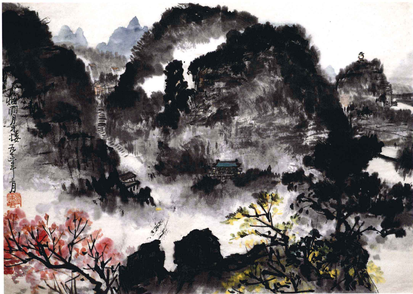
烟雨月牙楼 1976年 35cm × 47cm