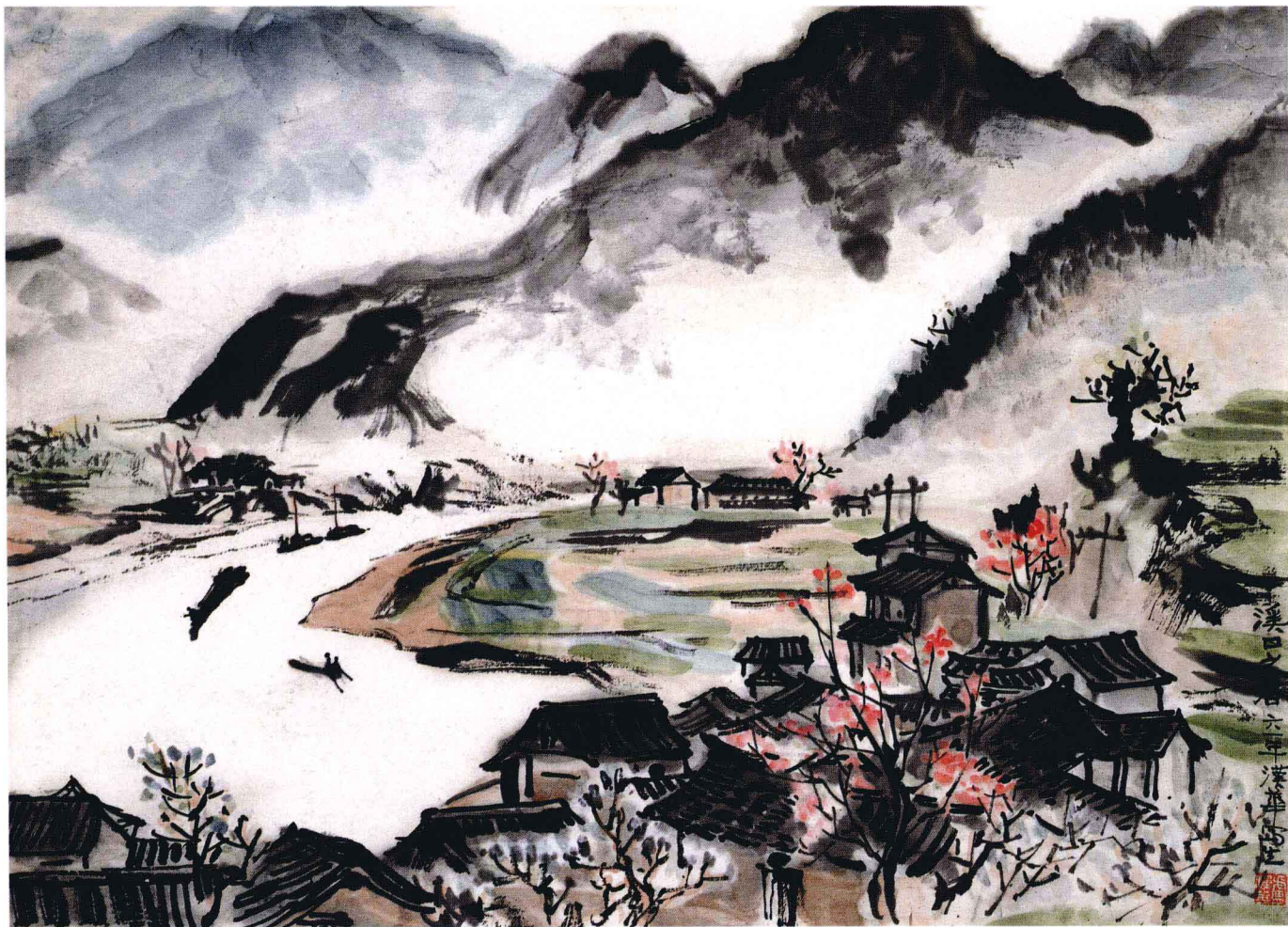
溪口之春 1961年 35cm × 46cm