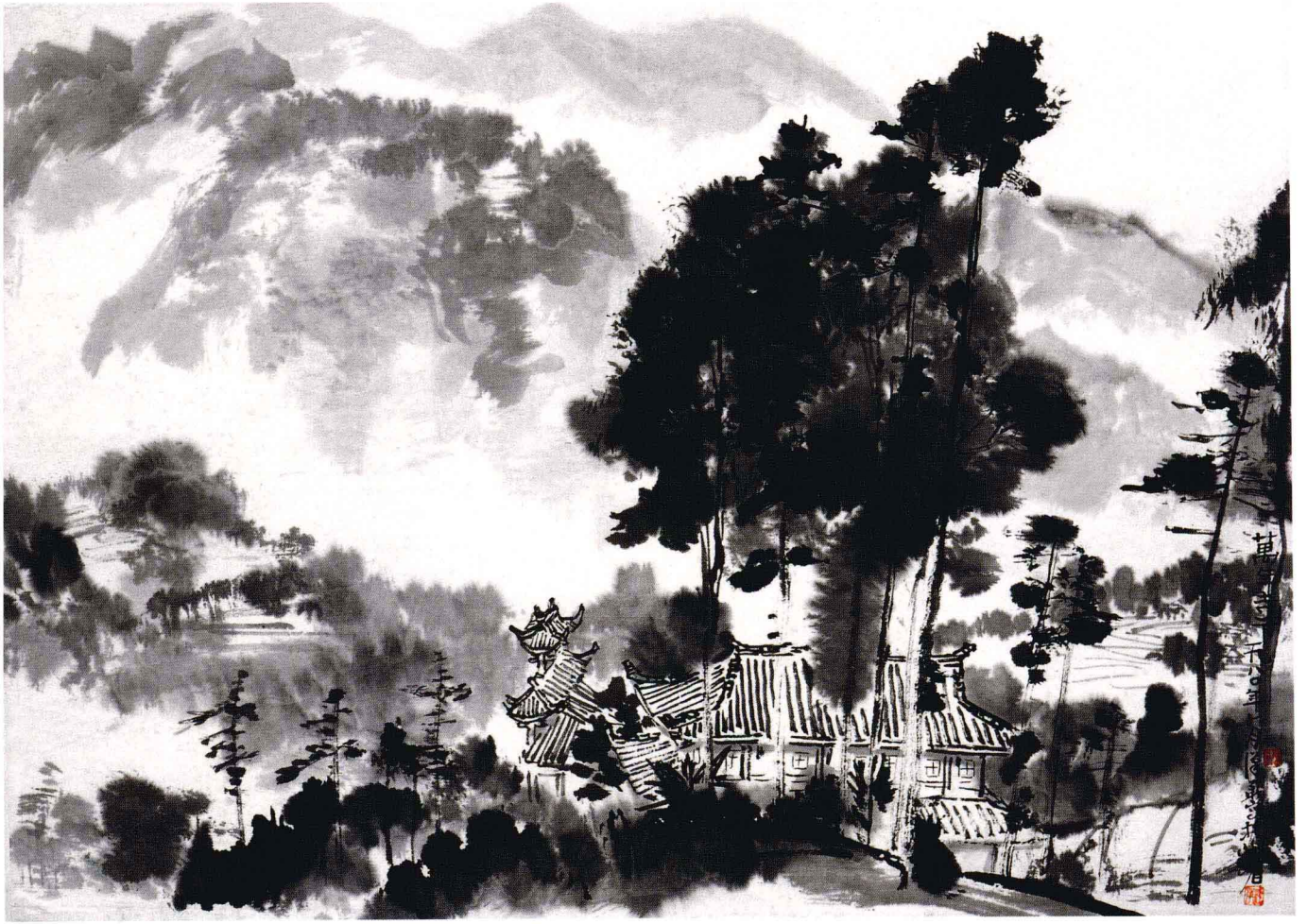
万年寺下 1980年 46cm × 60cm