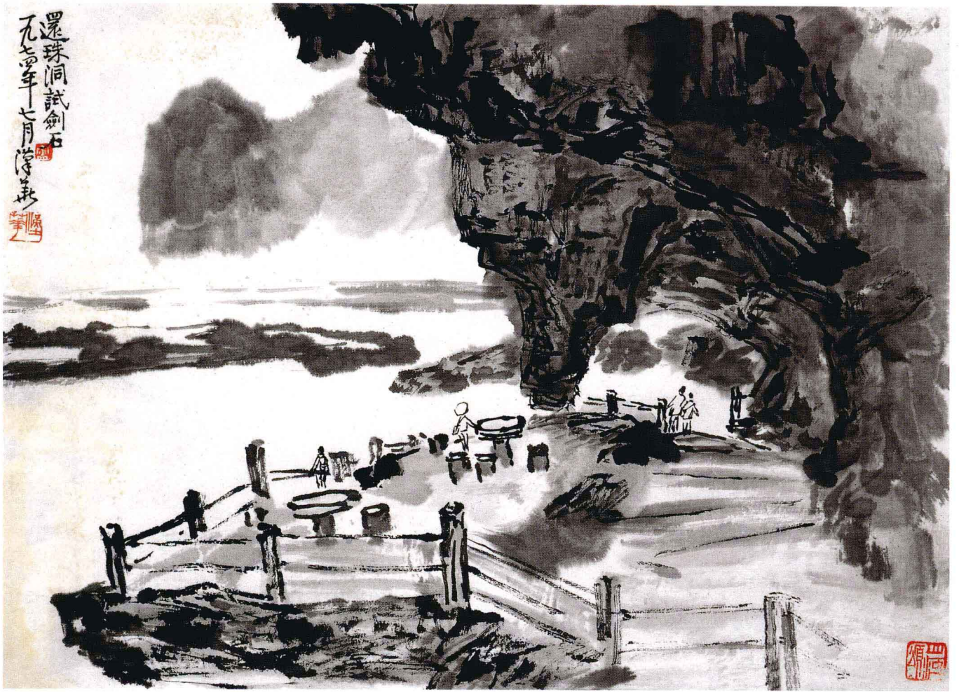
还珠洞试剑石 1974年 35cm × 47cm