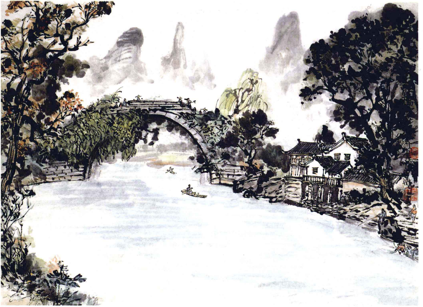
玉龙桥 1979年 47cm × 60cm