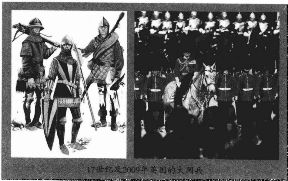
17世纪及2009年英国的大阅兵

7. 对于爱尔兰人来说，充分理解货币的功能、不同铸币的作用、它们价值波动以及所带来的后果是非常有现实意义的——爱尔兰最近发生的滥发货币情况正是由于缺乏这方面的知识造成的。