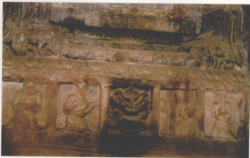
宁夏固原须弥山石窟 浮雕伎乐图 (1984)