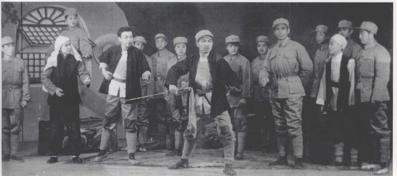
盐池县秦腔剧团演出的现代戏《回汉支队》 (1963)