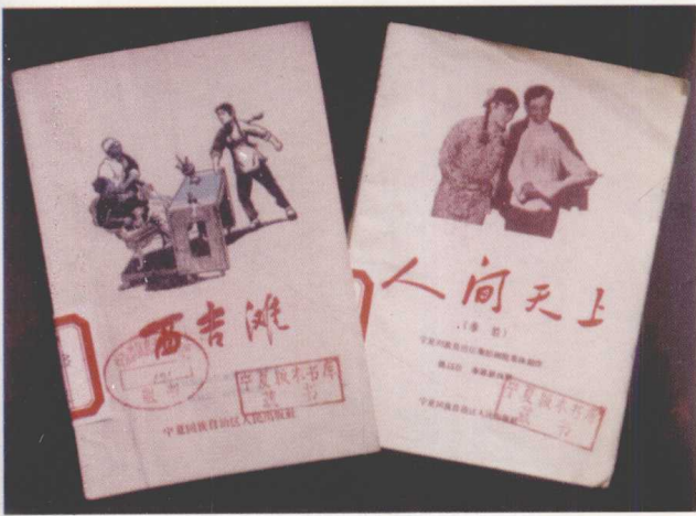
宁夏人民出版社出版的秦腔《西吉滩》 《人间天上》剧本（1980）