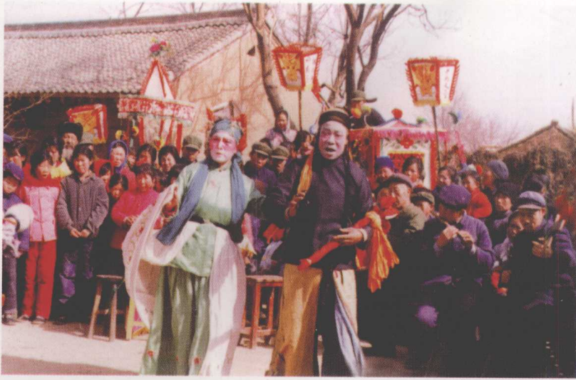
固原县民间班社演出曲子戏 《货郎子相亲》(1981)