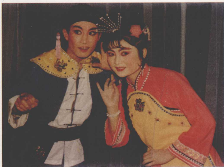
夏剧《买碗》 王刚饰王成 (1982)