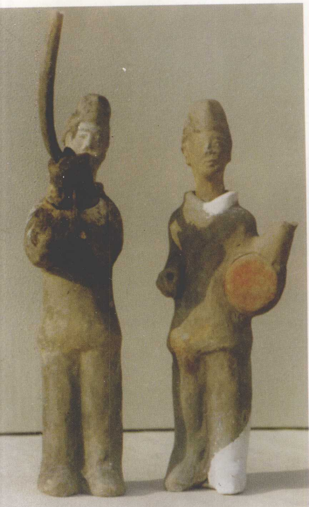
宁夏彭阳县北魏墓出土的 吹角俑和击鼓俑 (1983)