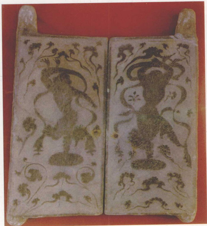
宁夏固原须弥山石窟浮雕的伎乐图 (1984)