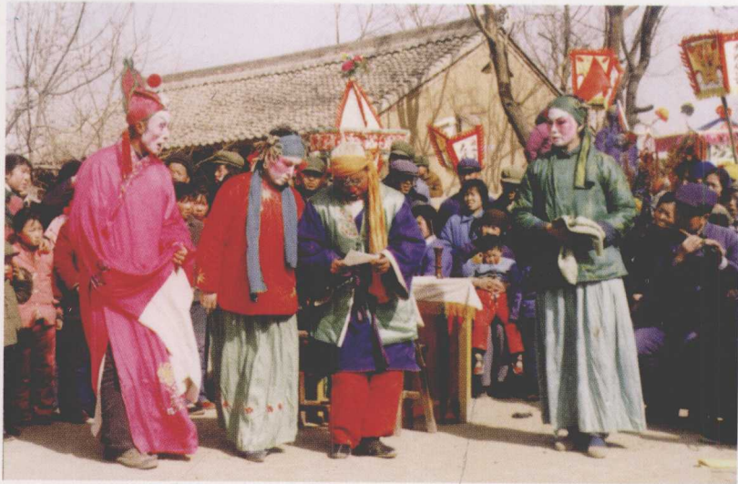
固原县民间班社演出 曲子戏《闹年》(1981)