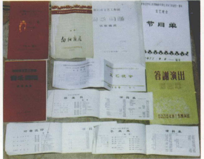
宁夏戏曲团体演出的部分节目单（1981）