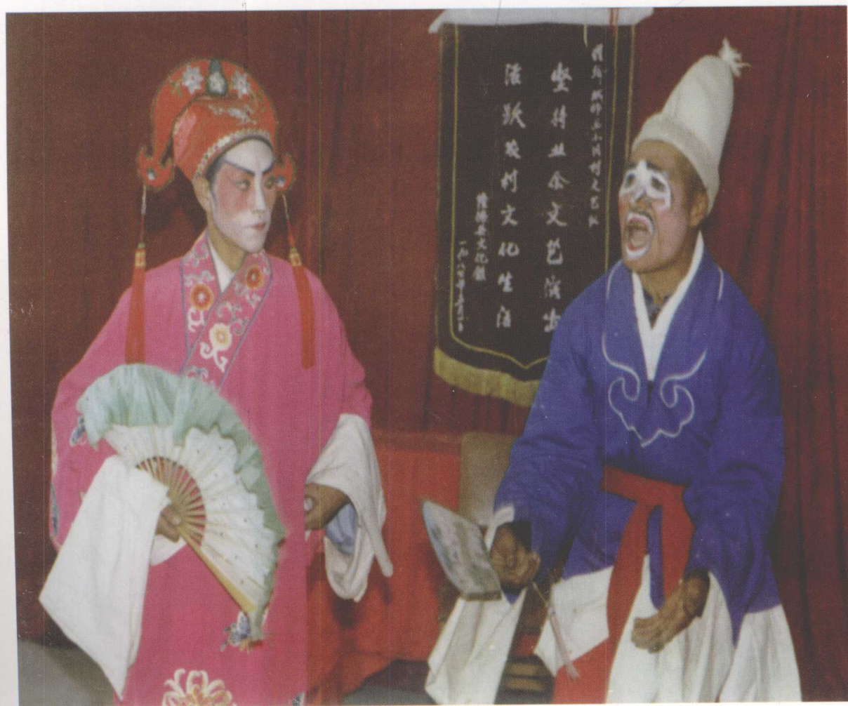
隆德县民间班社演出迷胡戏《李子荣站店》(1980)