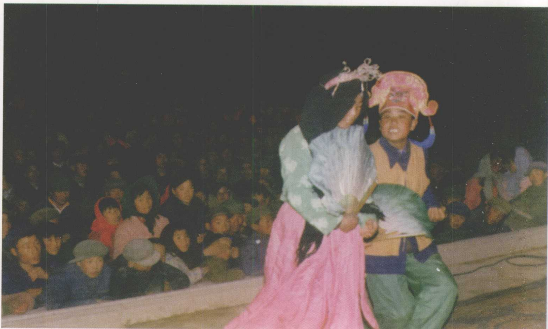
西吉县民间班社演出曲子戏《下四川》(1981)