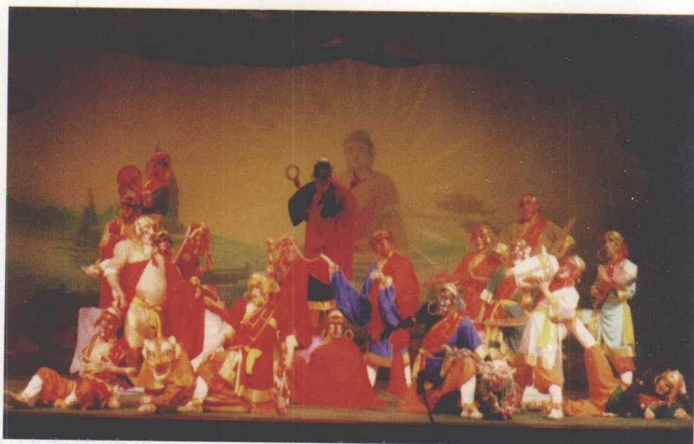
宁夏京剧团演出 《十八罗汉斗悟空》 (1985)