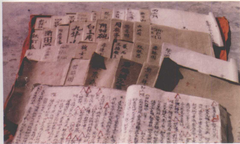
宁夏民间收集的部分戏曲剧本（1983）