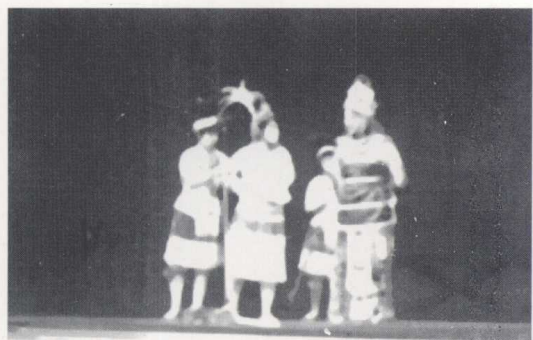
宁夏秦腔剧团演出的《洗夫人》（1982）