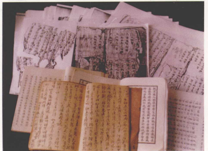
宁夏民间收集的部分传统戏曲台本（1983）