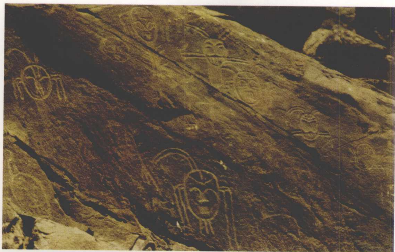
宁夏贺兰山岩画的古代 人物脸谱造型 (1985)