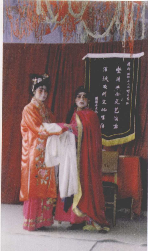
隆德县民间班社演出曲子戏 《逃庆阳》(1980)