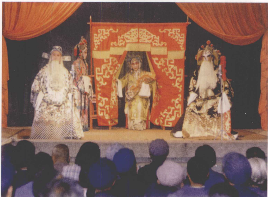
宁夏秦腔剧团演出的《二进宫》(1984)