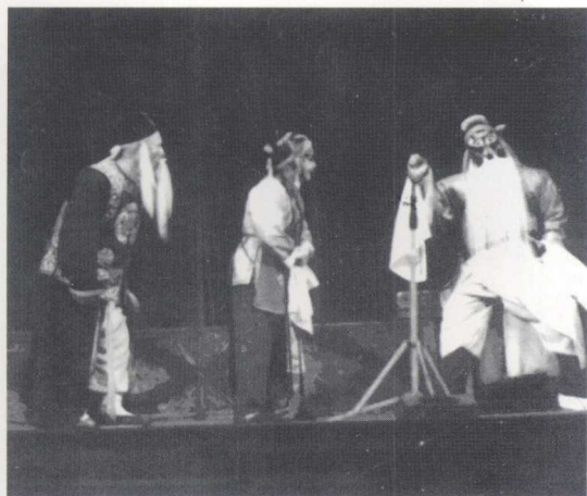
宁夏秦腔剧团演出的《包龙图探监》（1982）