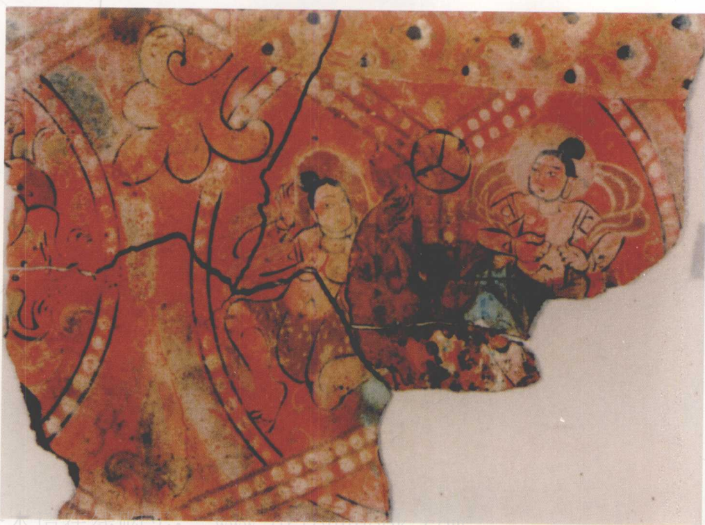
宁夏固原北周官员李贤墓 壁画乐舞图 (1982)