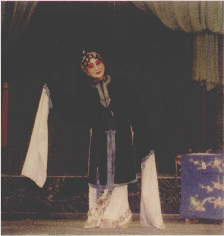
固原地区秦腔剧团演出的《秦香莲》(1982)