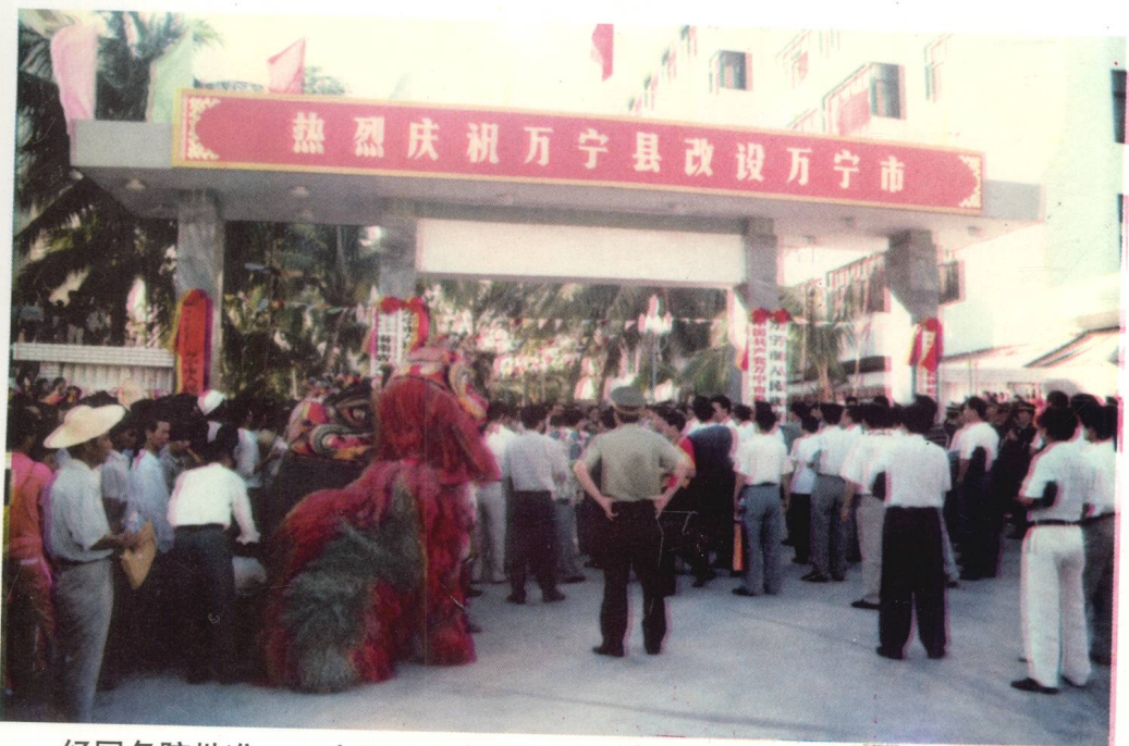
经国务院批准，万宁于1996年8月撤县设市。图为万宁市挂牌仪式。