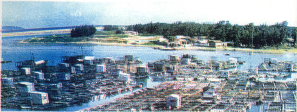
和乐内海养殖基地。