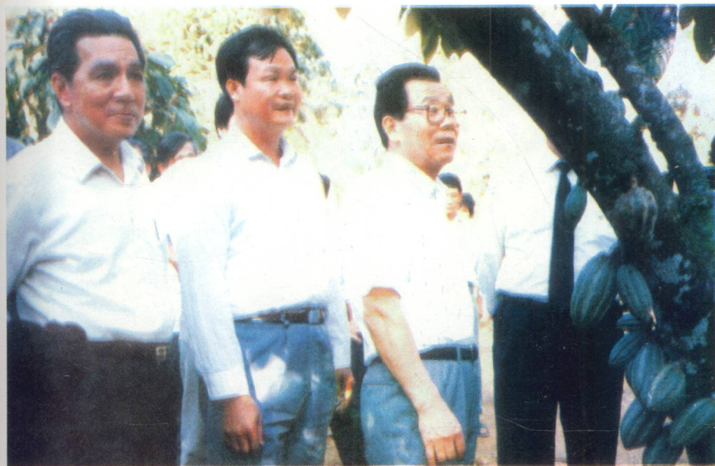
李瑞环同志1991年2月18日视察万宁可可园。