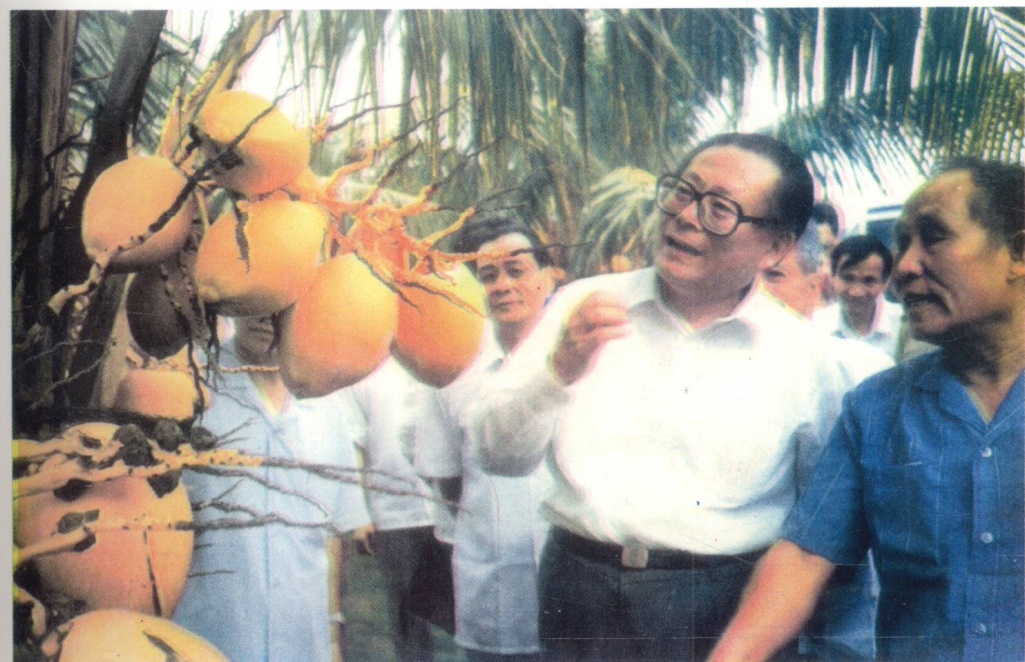
江泽民同志1990年5月17日在万宁视察椰子生产基地。