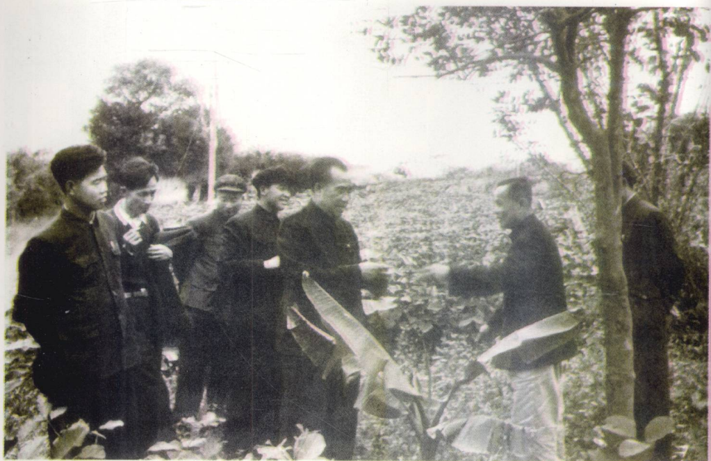
朱德同志1957年1月视察万宁。