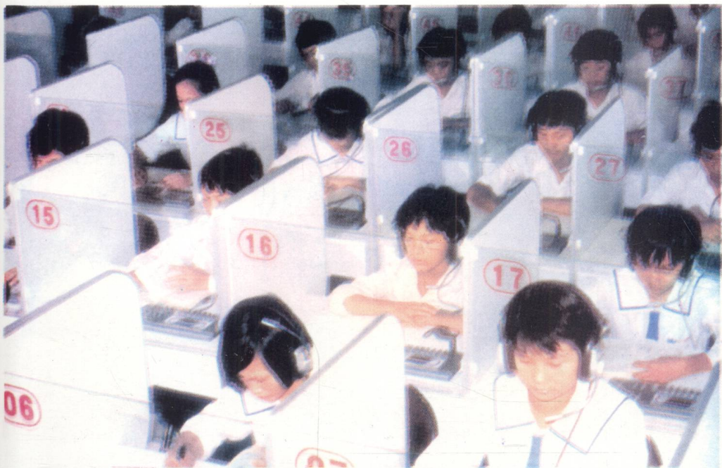
万宁教育事业发展迅速。图为万宁中学的语音室。