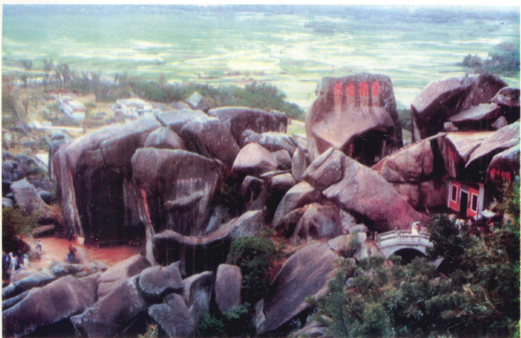
素有“海南第一山”美称的东山岭，已成为海南省主要的旅游景点。图为东山岭旅游区的一角。