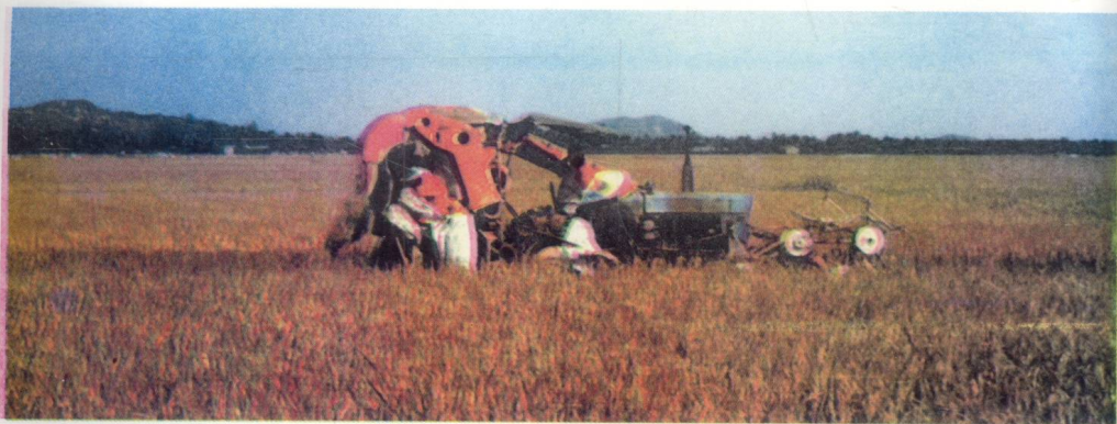
万宁已成为海南省重要的粮食产区，图为万宁的粮食生产基地。