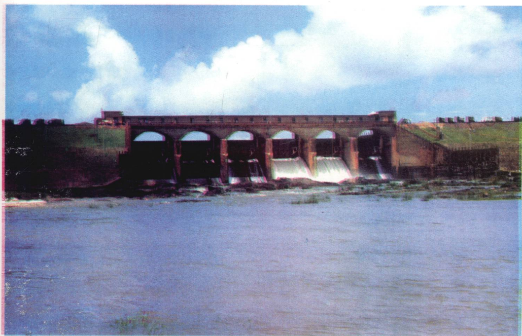
万宁水库是万宁最大的水利工程，朱德委员长曾为之题名“万宁水库”。 图为拦河坝。