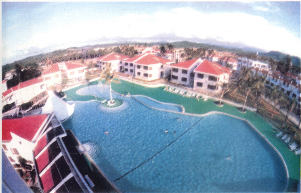
位于万宁西南部的兴隆，是全国著名的旅游度假区。 图为兴隆旅游城的一角。