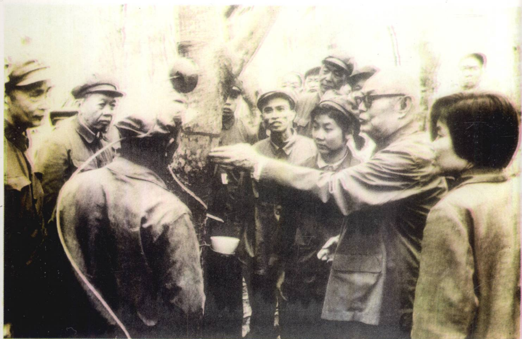
叶剑英同志1979年3月在万宁视察。