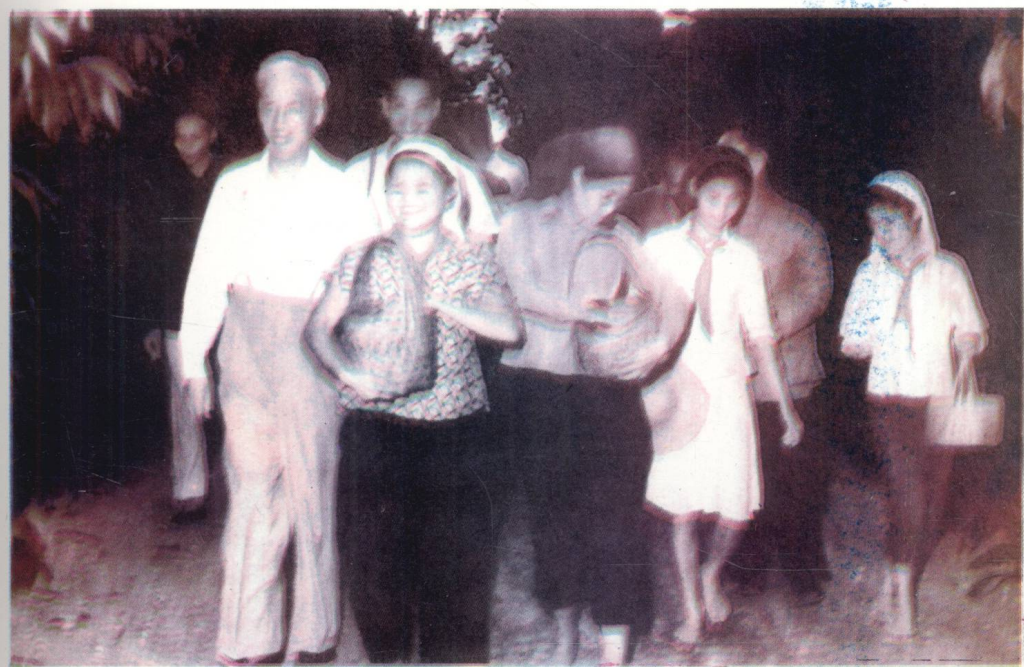
刘少奇同志1960年视察万宁。在线购买： www.ertongbook.com