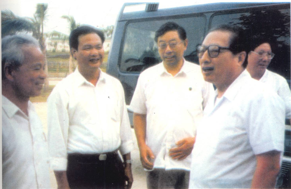
乔石同志1991年10月14日在万宁视察。