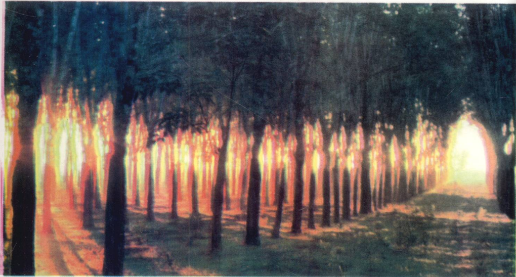
万宁已成为海南省主要的热作生产基地，图为万宁的民营橡胶园。