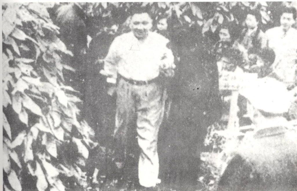
邓小平同志1961年在万宁视察咖啡园。