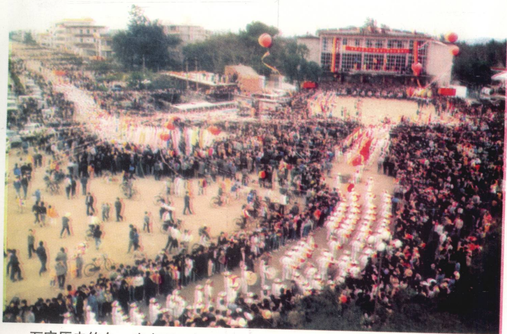
万宁历史悠久，唐贞观五年置县。 图为1991年万宁建县1360周年的庆典盛况。