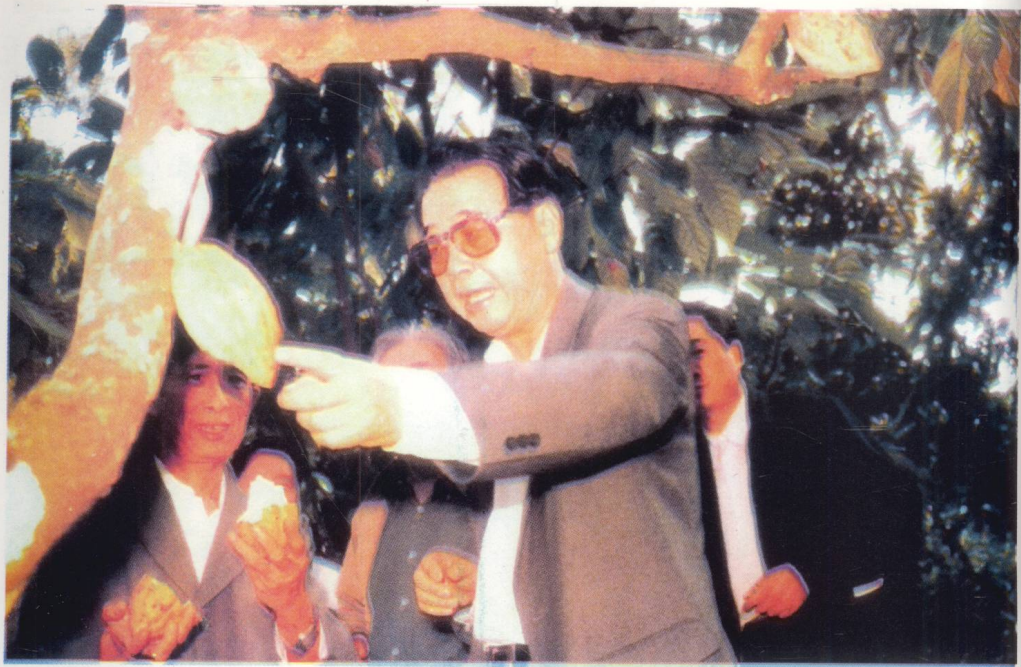
李鹏同志1989年在万宁视察可可园。