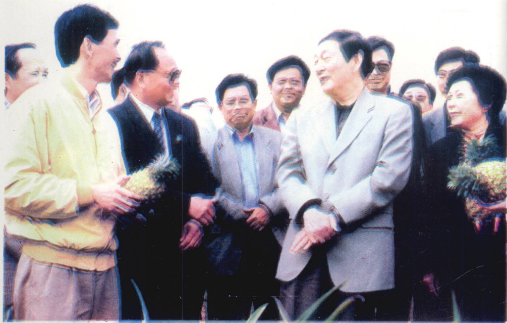
朱镕基同志1998年12月20日视察万宁龙滚菠萝生产基地。