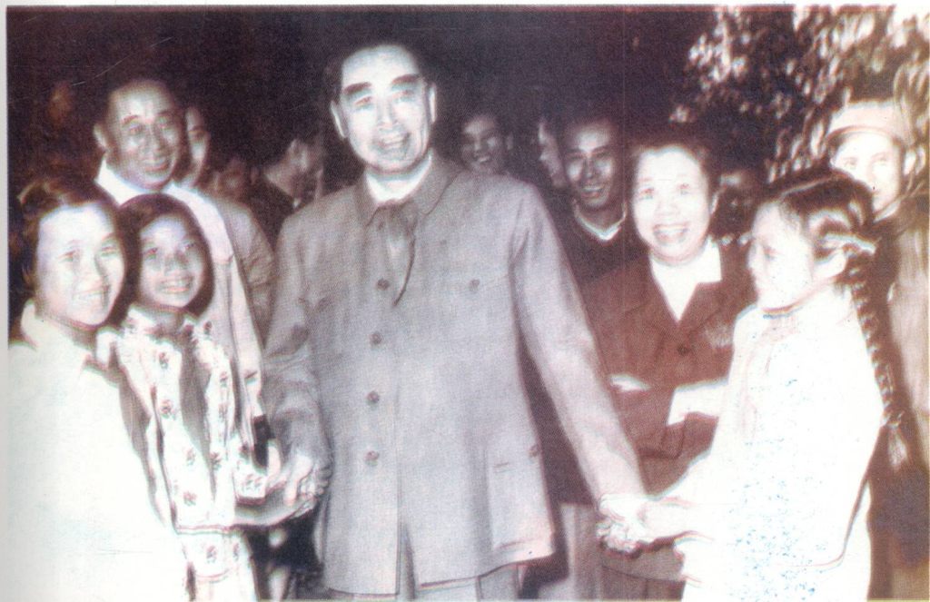
周恩来、邓颖超同志1960年2月视察万宁。