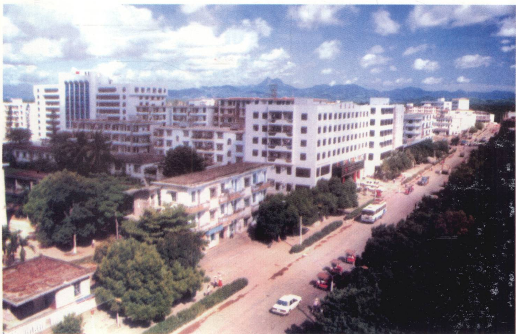
万宁的市政建设成绩显著。图为近年来崛起的万城镇的新城区。