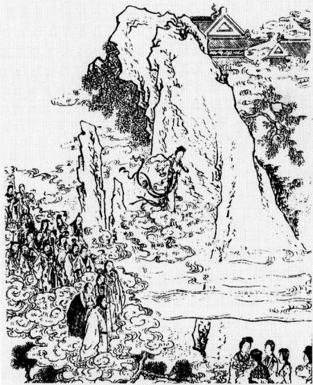
女魁星北斗垂景象 老王母西池赐芳筵

百谷仙子道：“这位星君如此模样，想来必是魁星夫人。原来魁星竟有浑家，却也罕见！”百花仙子道：“魁星既为神道，岂无匹偶？且神道变幻不测，亦难详其底细。或者此时下界，别有垂兆，故此星以变相出现，亦未可知。”百果仙子笑道：“据小仙看来，今日是西王母圣诞，所以魁星特命娘子祝寿。将来到了东王公圣诞，才是魁星亲自拜寿哩。但这夫人四面红光护体，紫雾盘旋，不知是何垂兆？”