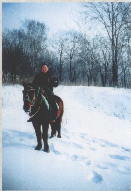
在大兴安岭的雪山里，我跨骑一匹人生的骏马，找寻人生航向。