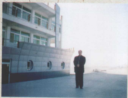
天津东丽湖，我拥有曾经的一个梦想。