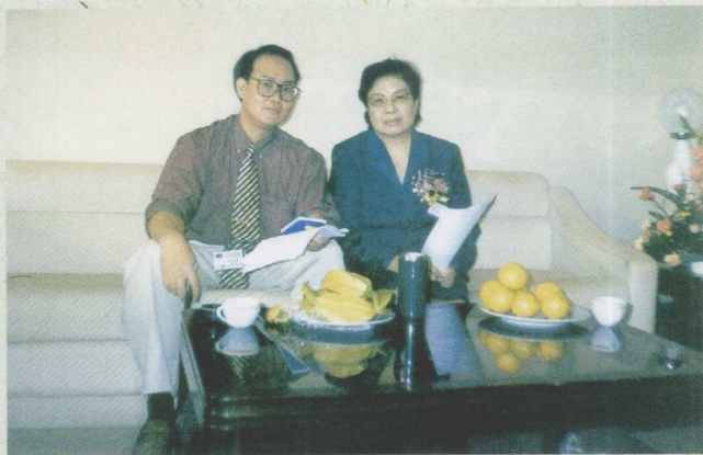
一九九九年冬，在筹备首届市长论坛时，原国务院副总理陶铸的爱女、中国市长协会秘书长陶斯亮（右）与我在一起。