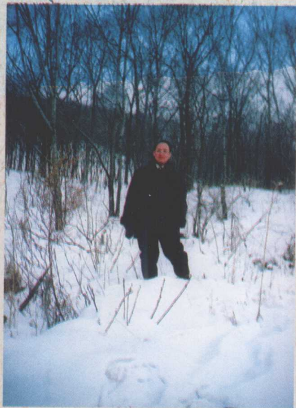
在蛮荒的黑龙江林海雪原里，我回望蓝色的广州湾，