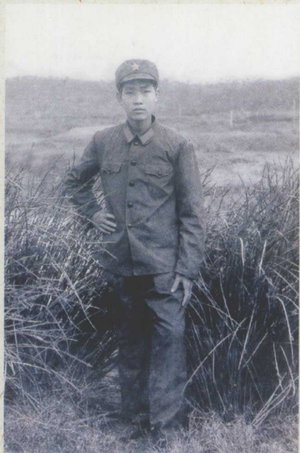
一九七九年冬，我参加中国人民解放军00251部队军事集训时在粤北九连山区。