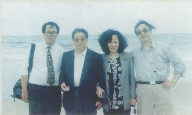
一九九六年夏，我国著名外交家、原国家外交部副部长宫达非（左二）、中央人民广播电台理论部主任王丹彦（右二）、中共中央党校教授孙长江（右一）与我在湛江三岛海滨。