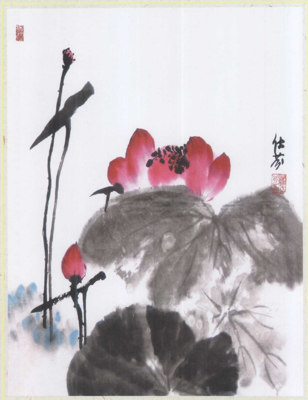
中国著名女画家素有“荷花仙子”之称的罗仕芬给本书题赠的贺画。