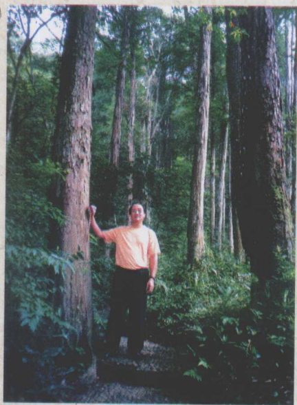
在福建武夷山，我尽情地吸吮着大山清新而甜润的空气。