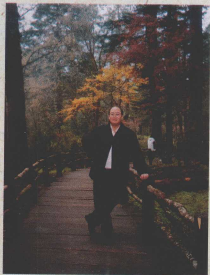
西南边陲的玉龙雪山，像梦一般地飘荡在我的记忆中，久久不愿显露她真实的面纱。