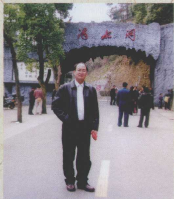
我在韶山滴水洞 缅怀伟人的丰功伟绩。