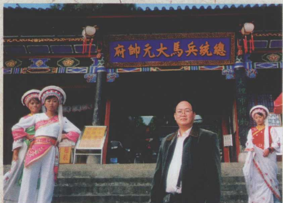
在云南大理古城，我感悟历史，思索未来。