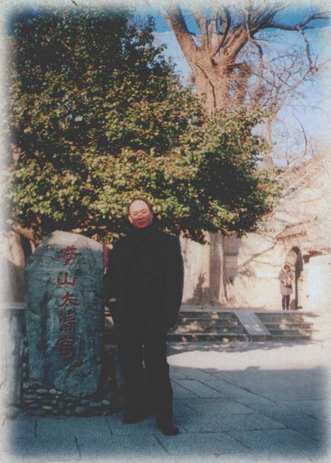
青岛崂山，是佛门的一片清静之地，置身于其中，我的心灵碧空如洗。