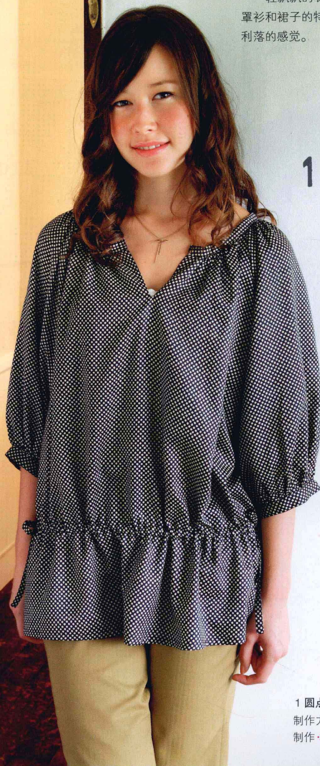
1 圆点罩衫 制作方法 ❖ P42 制作 ❖ 小泽信子