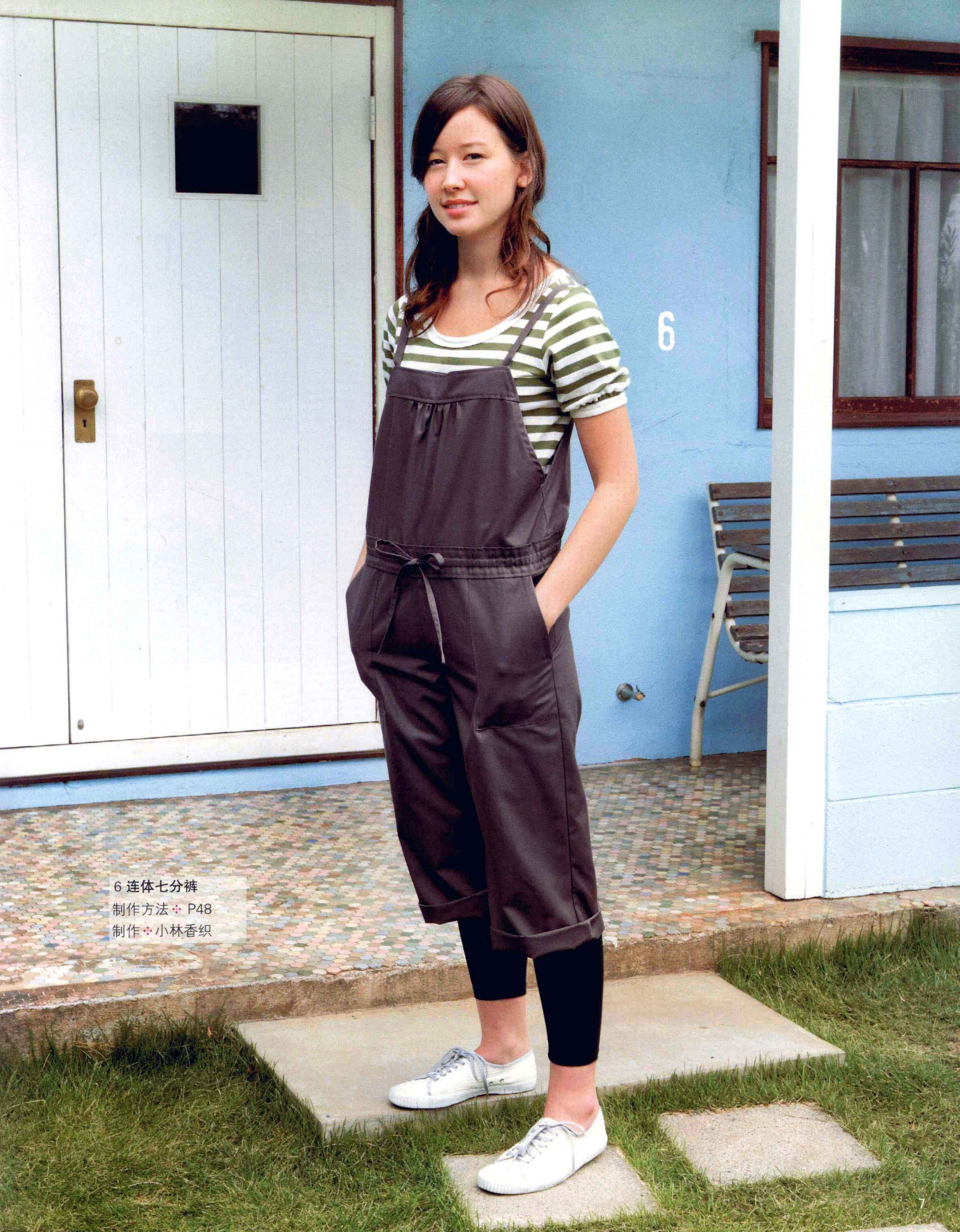
6 连体七分裤 制作方法 ◆ P48 制作 ◆ 小林香织