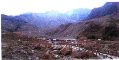
两山垮塌后掩埋 780 人于百米深处

我们从昭化出发,上广元至绵阳高速公路,在青川县金子山乡出口,转入去红光乡东河口村地震遗址公园的公路。除了正在竹园镇修建的一座大桥工地