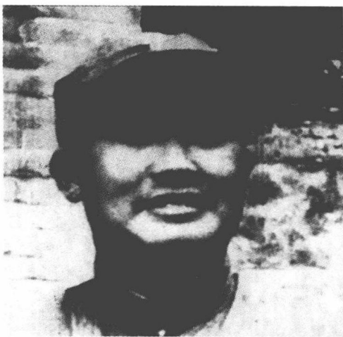
担任守卫宛平卢沟桥任务的第110旅第 219团团长吉星文，该团打响了全面抗战的 第一枪。

旅长何基沣也向团长吉星文下命令：“对进攻的日军，立即还击，坚守阵地，我马上派部队支援你们！”