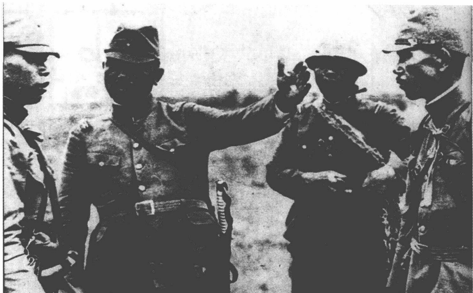
日军军官在卢沟桥畔策划肇事

从以上事实不难看出，即使没有卢沟桥事变，还会出现其他什么事件，因为日本对中国的侵略是个不争的事实，先是东北，现在是华北，只要有一颗火星就能点爆这个巨大的火药桶。