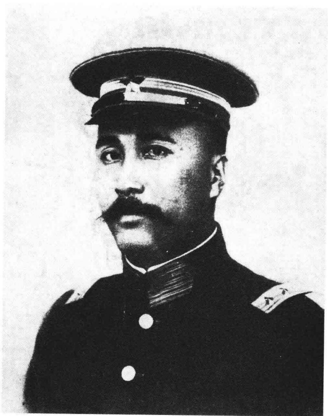
1920年11月10日，陈炯明出任广东省省长，兼粤军总司令。