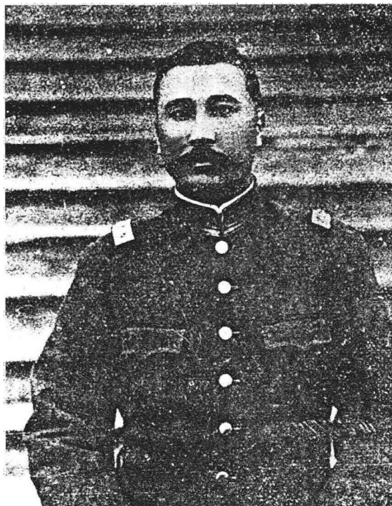
“6·16兵变”（1922年6月16日）时期的陈炯明。