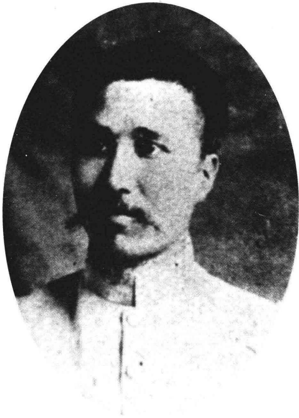
广州军政府副都督陈炯明