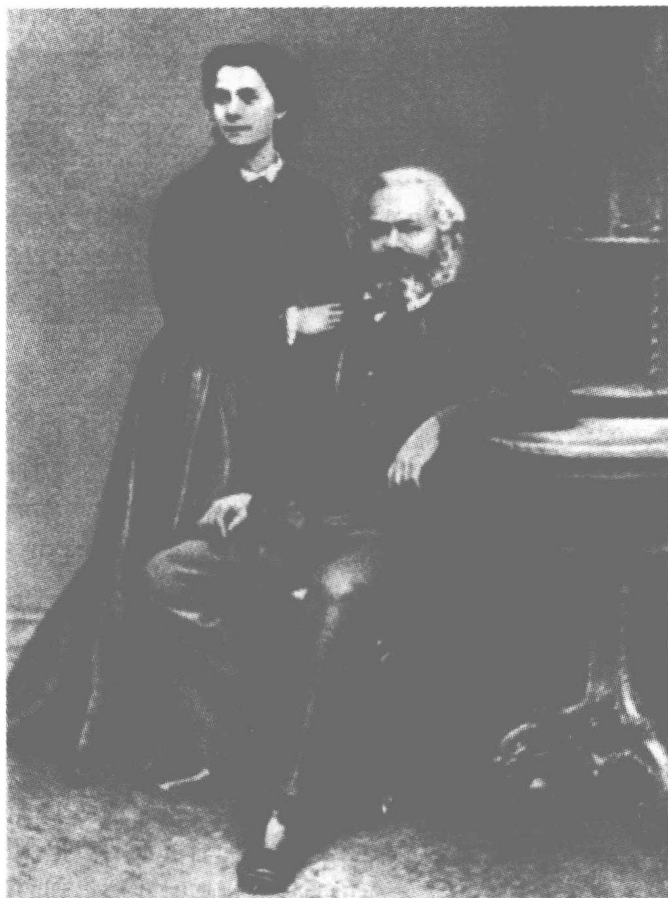
1868年，马克思与女儿在一起

属于亿万人，我们的事业虽然并不显赫一时，但将永远发挥作用。当我们离开人世之后，高尚的人们将在我们的骨灰上撒下热泪。”