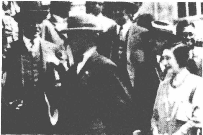
1932年国际联盟调查团参加调查九一八事变代表，在北戴河章家大楼茶会时所留旧照，蒋介石寄希望于国联调查团能主持“公理”进行公正的“裁决”，然而国联的调查不过是一种形式而已。

务组织的“天津俄侨防共委员会北戴河分会”建立，隶属日本北支那驻屯军指挥，成为其监视欧美人的工具。