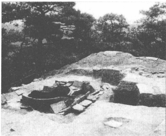
1992年3月，在北戴河莲蓬山南峰龙山山顶发掘出的1.43米深的陶井属秦汉遗迹，有学者认为是“汉武台”。

东临碣石，以观沧海。水何澹澹，山岛竦峙。树木丛生，百草丰茂。秋风萧瑟，洪波涌起。日月之行，若出其中。星汉灿烂，若出其里。幸甚至哉，歌以咏志。