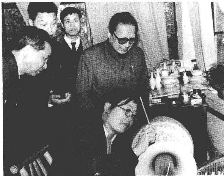
★中共中央政治局常委乔石一九九〇年四月视察景德镇陶瓷厂。