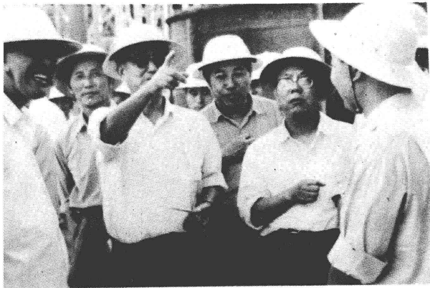
★中共中央政治局常委宋平一九八五年十一月十二日视察贵溪冶炼厂。