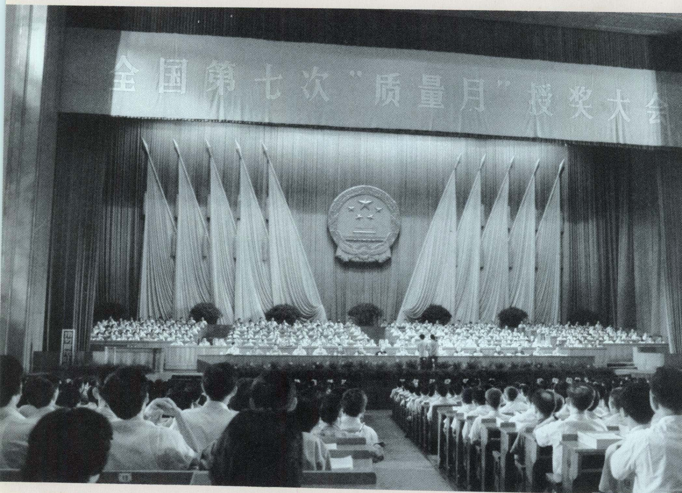
全国第七次“质量月”授奖大会会场