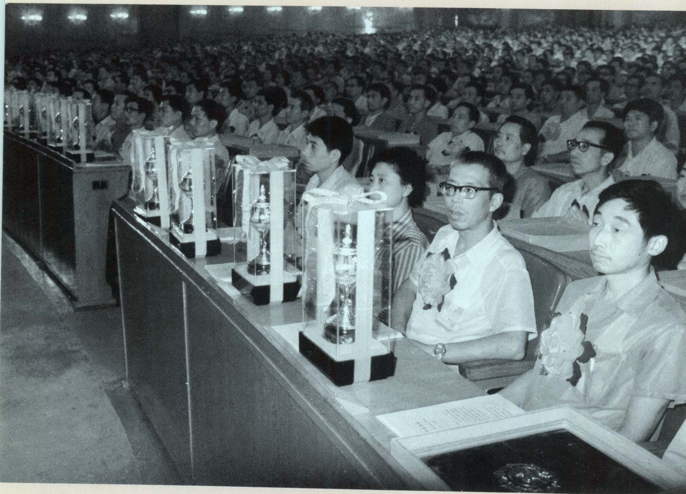
参加全国第七次“质量月”授奖大会的企业代表