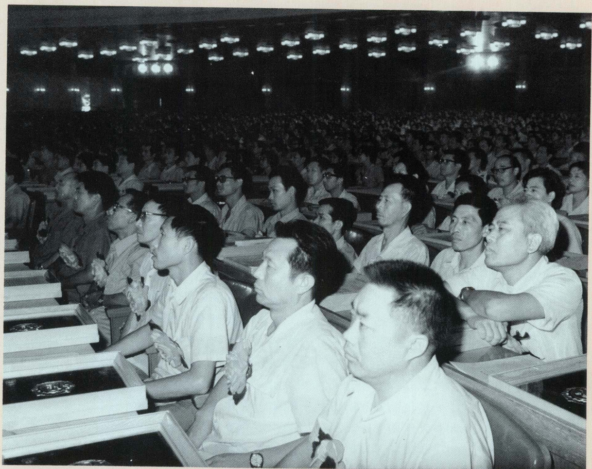
参加全国第七次“质量月”授奖大会的企业代表