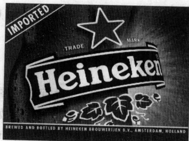
图 1-1 利用 Photoshop 设计的标志、杂志封面及啤酒平面广告