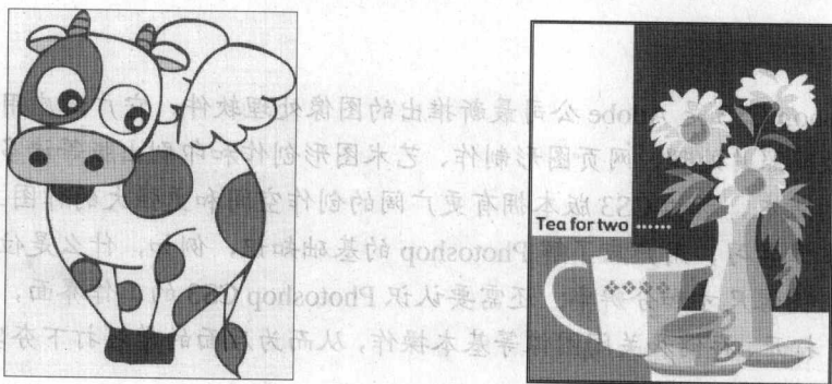
图 1-3 用 Photoshop 绘制的图片