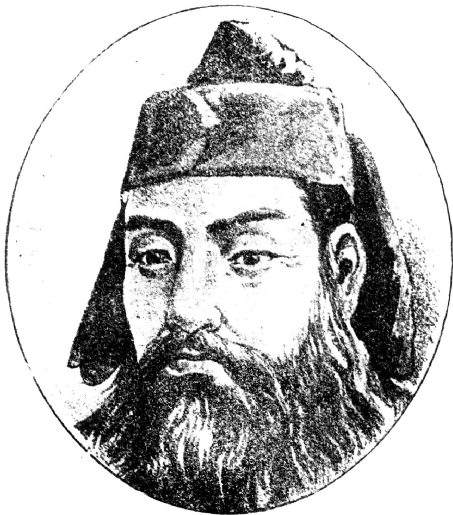
像之帝黃祖始族民國中