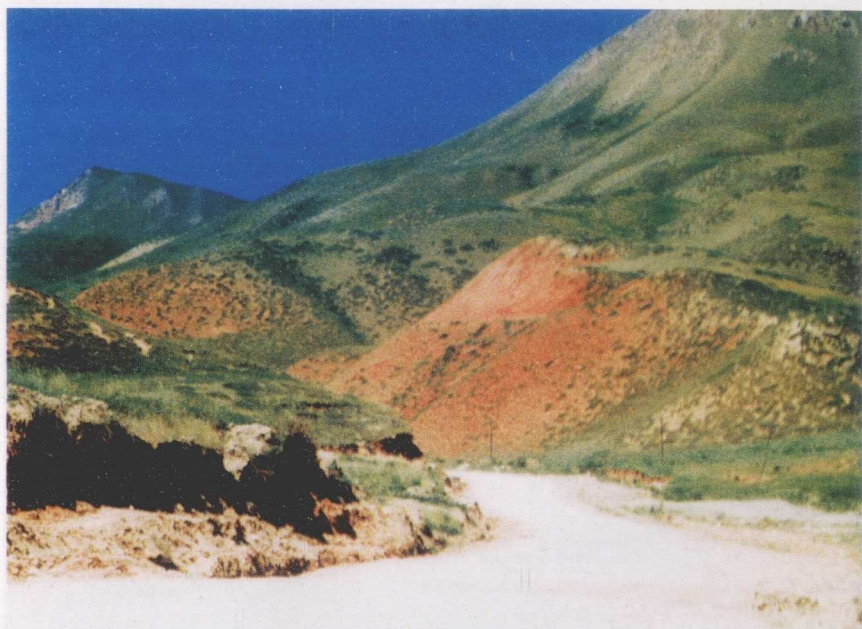
白彦虎走过的山沟