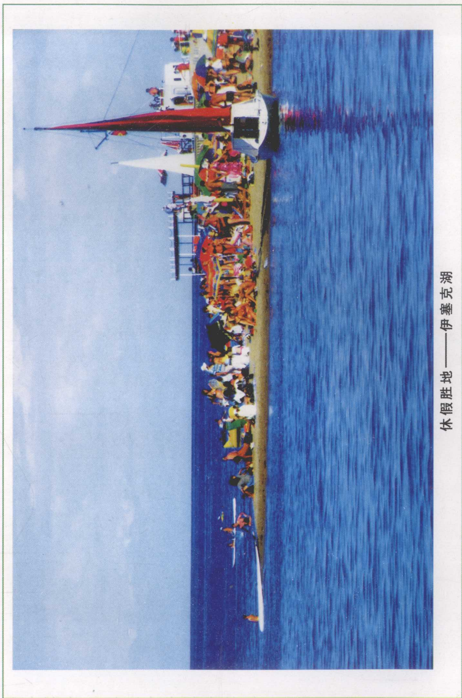
休假胜地——伊塞克湖