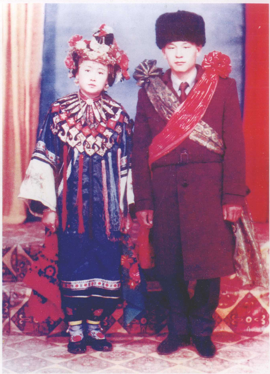
东干族的新郎与新娘