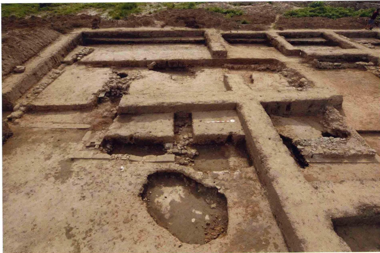
1. 大苑村寺庙遗址藏经阁西配房 (自东向西)