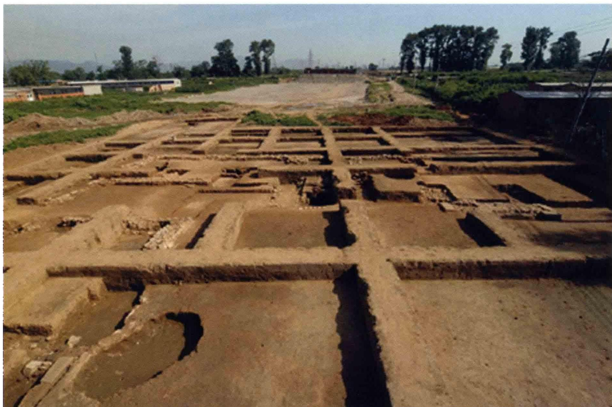
2. 大苑村寺庙遗址藏经阁（自南向北）