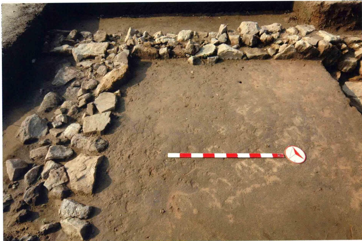
1. 大苑村寺庙遗址藏经阁墙基