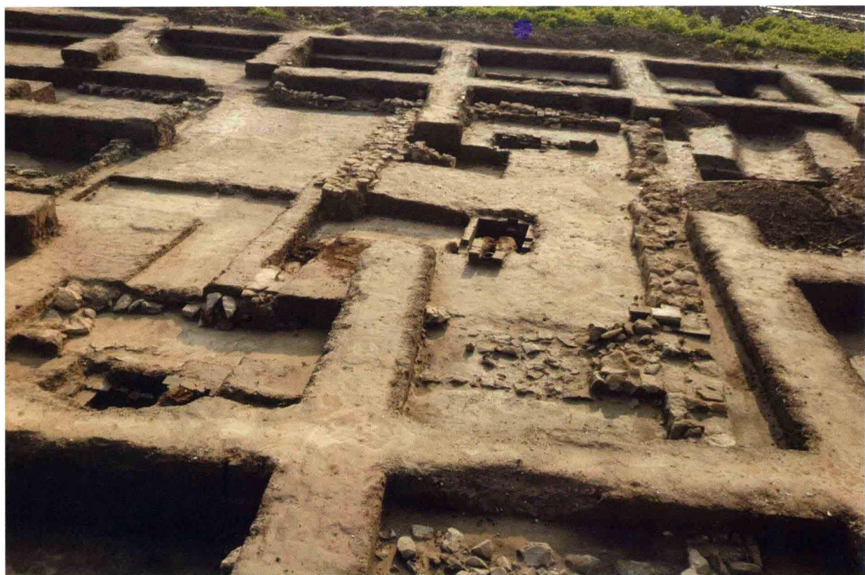
2. 大苑村寺庙遗址藏经阁西朵殿 (自南向北)