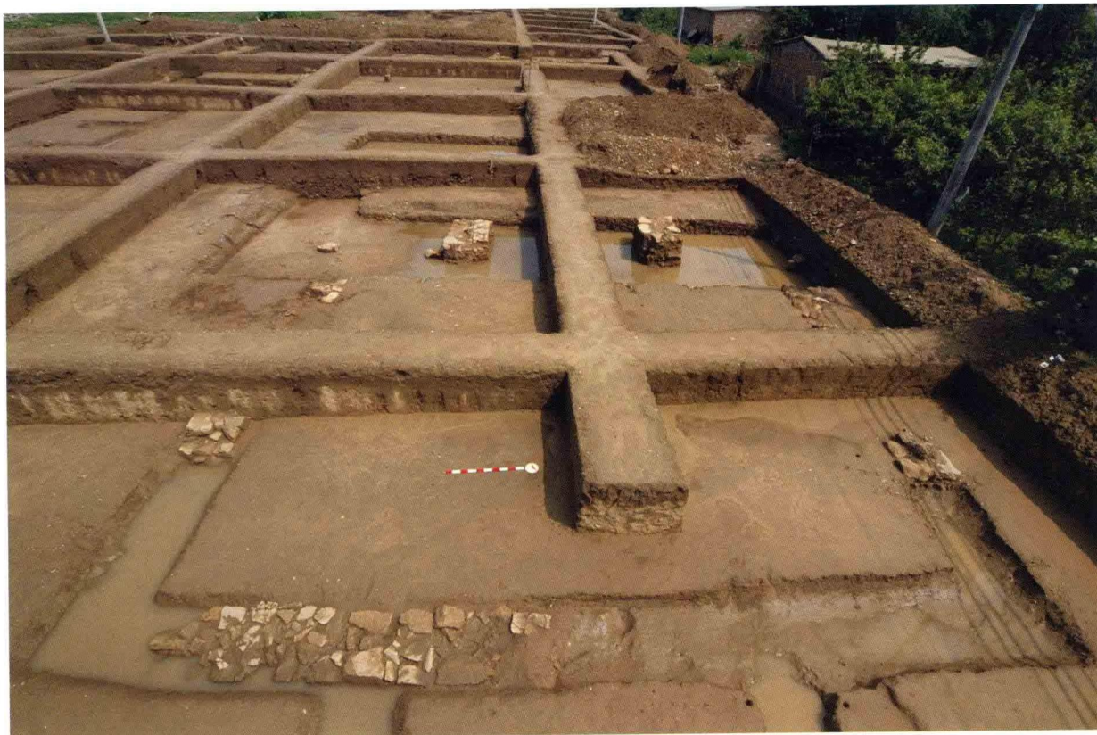
1. 大苑村寺庙遗址大雄宝殿 (自南向北)