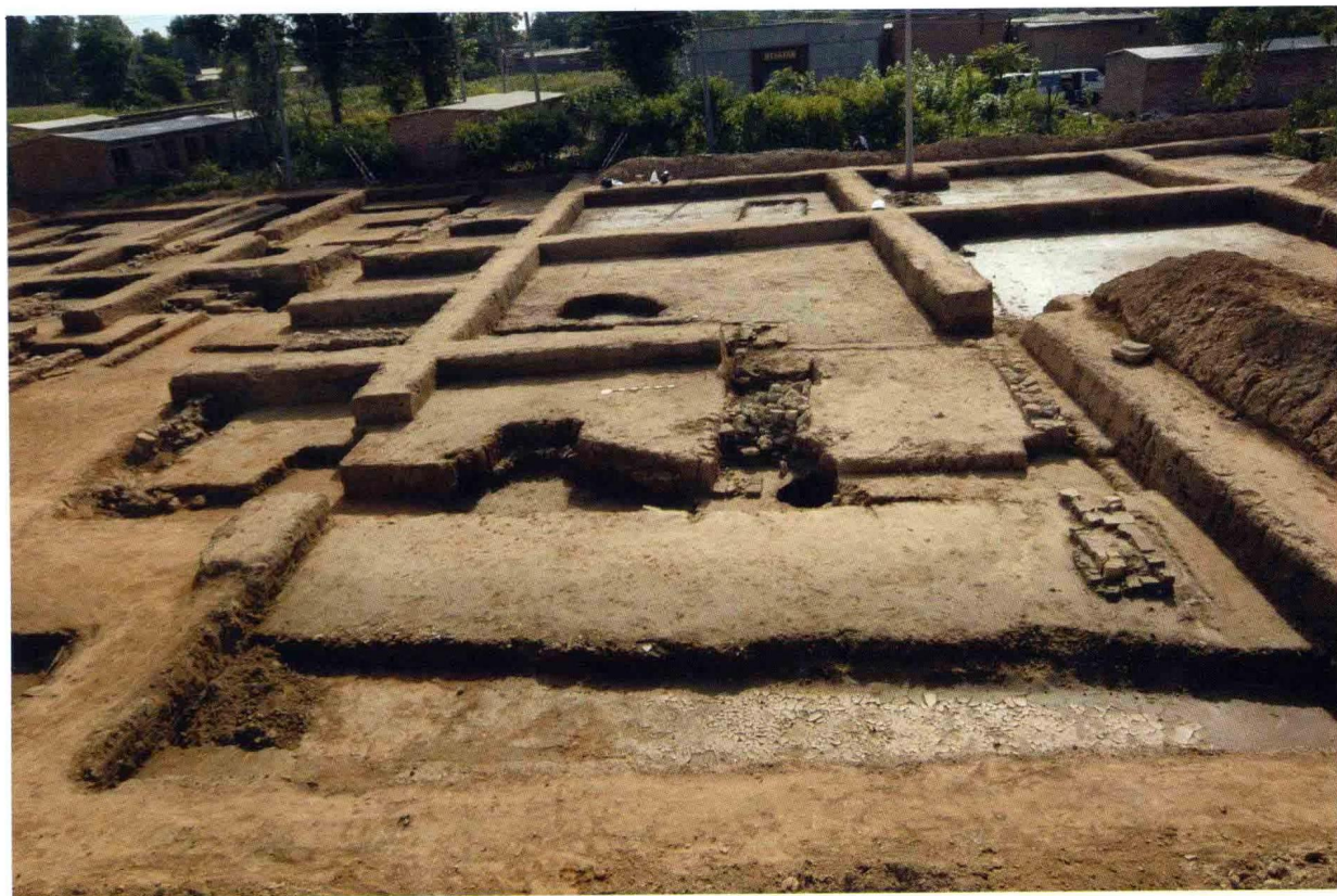
2. 大苑村寺庙遗址藏经阁西配房 (自西向东)