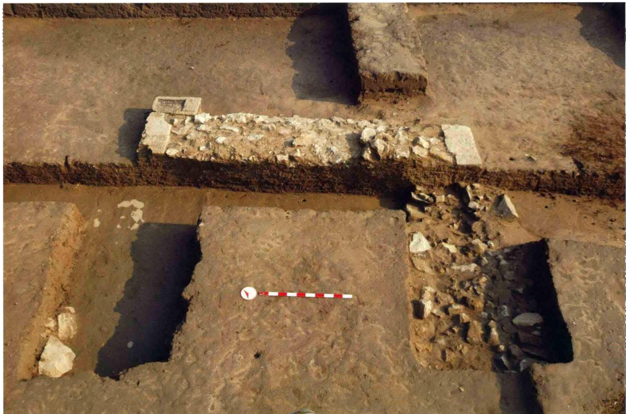
1. 大苑村寺庙遗址藏经阁台阶 (自北向南)