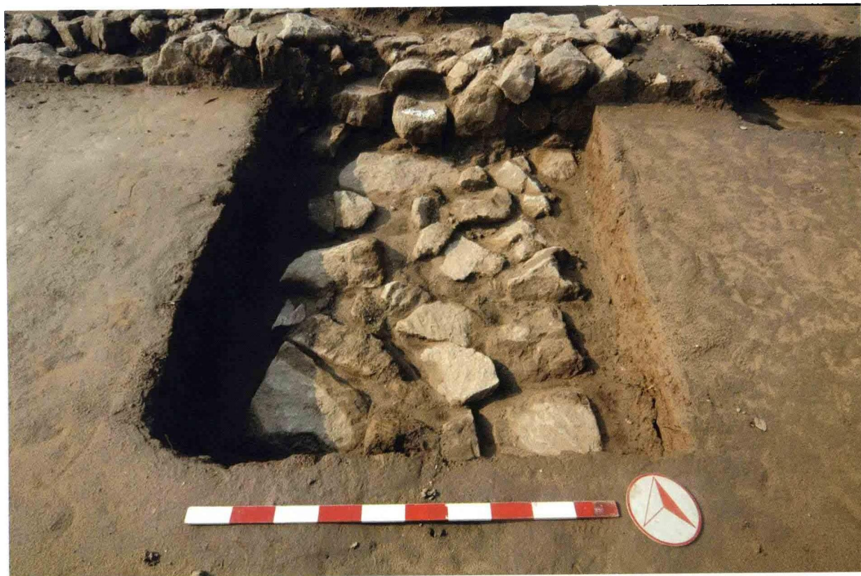
2. 大苑村寺庙遗址藏经阁磉墩