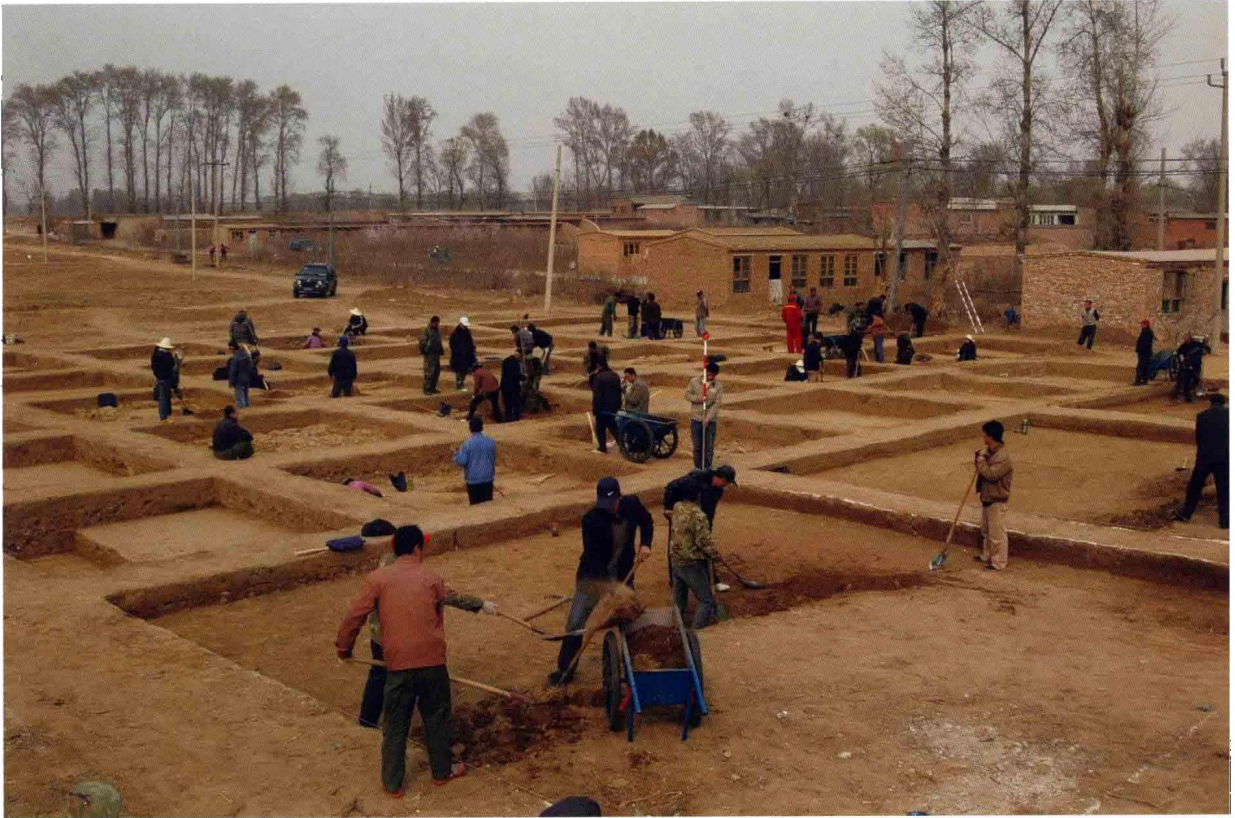
1. 大苑村寺庙遗址发掘现场