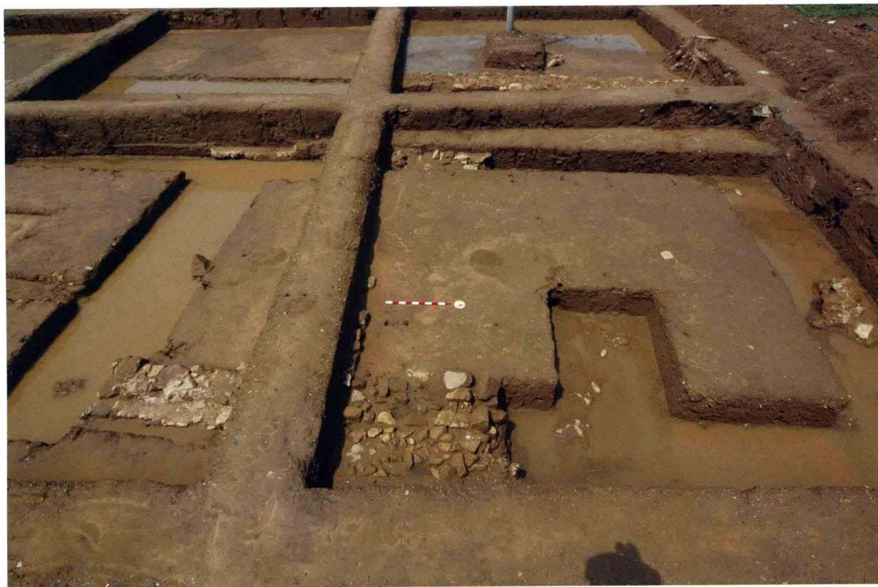
2. 大苑村寺庙遗址后殿西配殿 (自东向西)