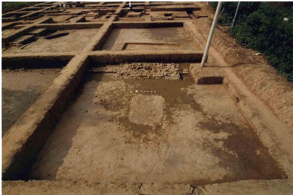
1. 大苑村寺庙遗址藏经阁大门及影壁（自南向北）