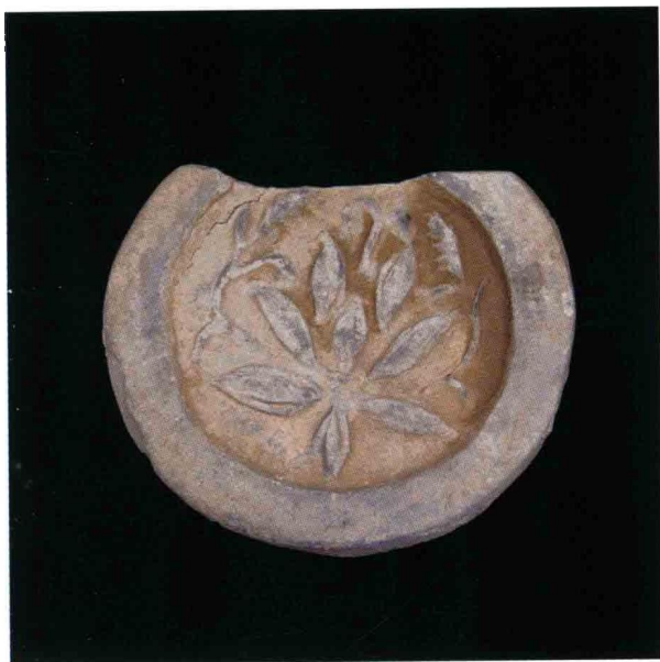
1. 大苑村寺庙遗址出土莲纹瓦当