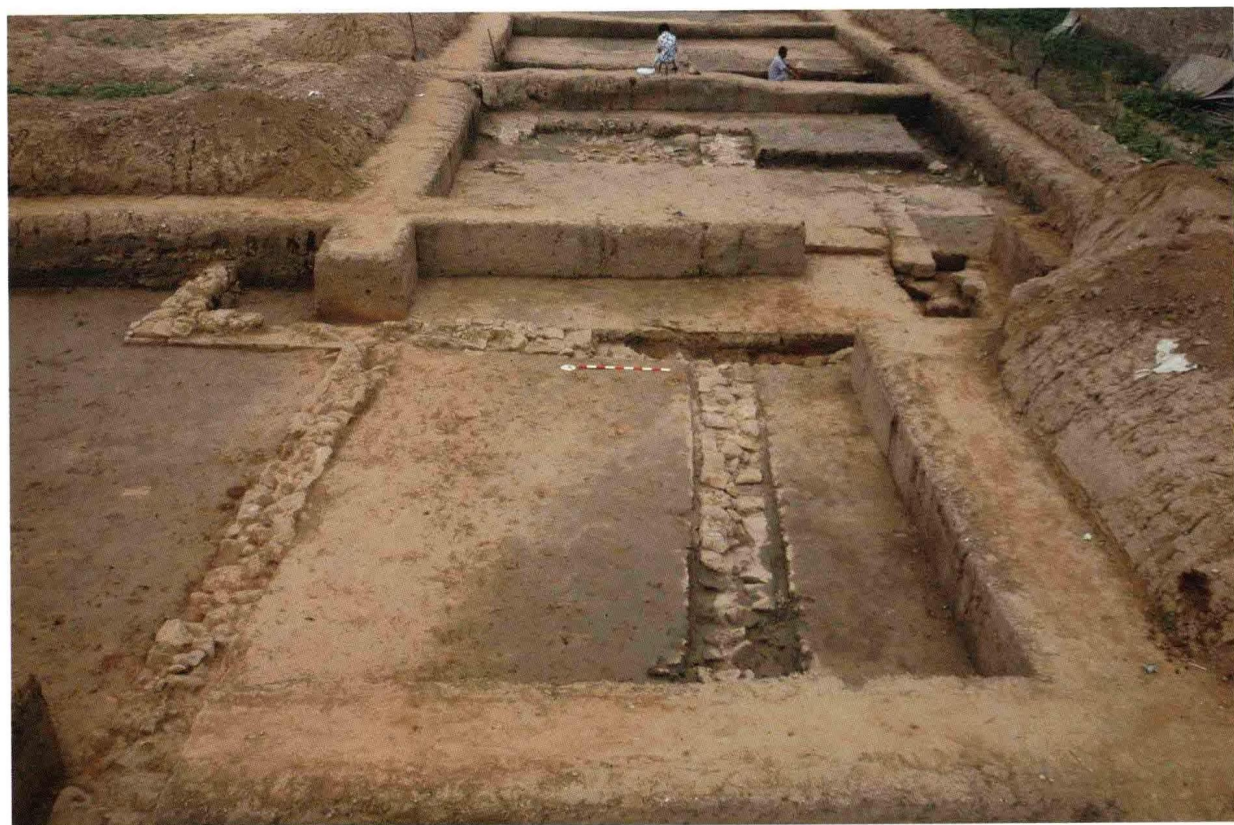
2. 大苑村寺庙遗址后殿 (自南向北)