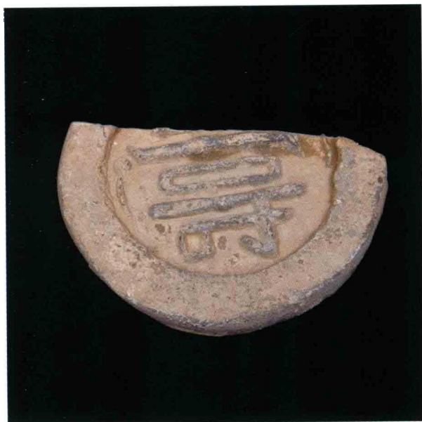
3. 大苑村寺庙遗址出土“寿”字瓦当