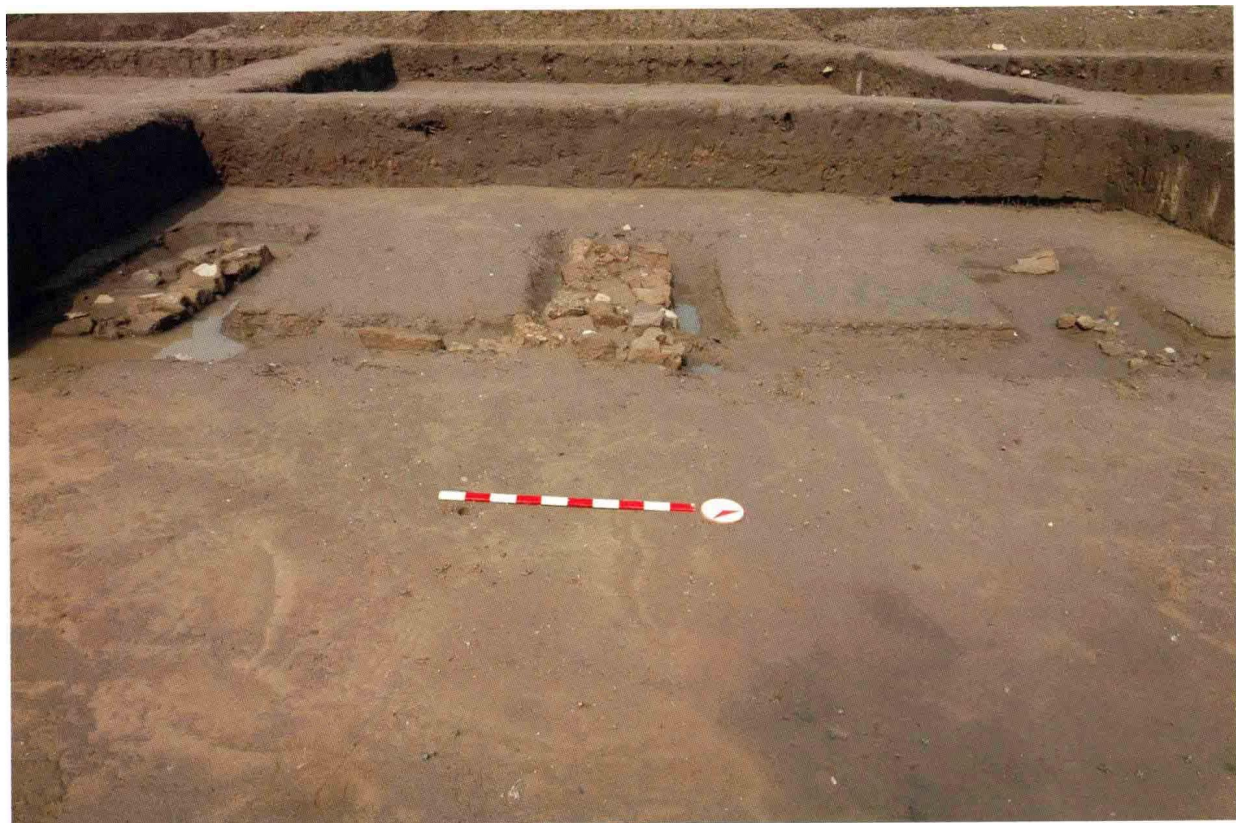
1. 大苑村寺庙遗址西配庑局部 (自东向西)