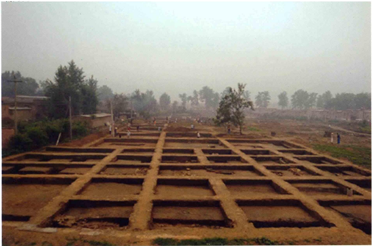
2. 大苑村寺庙遗址发掘后