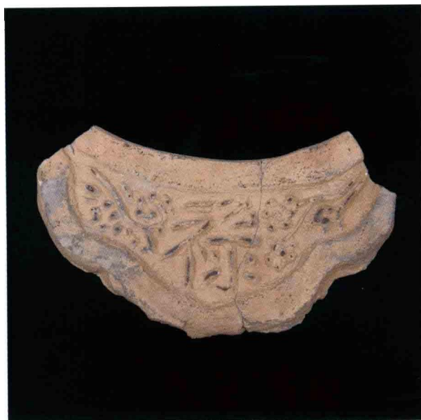
4. 大苑村寺庙遗址出土“禄”字滴水