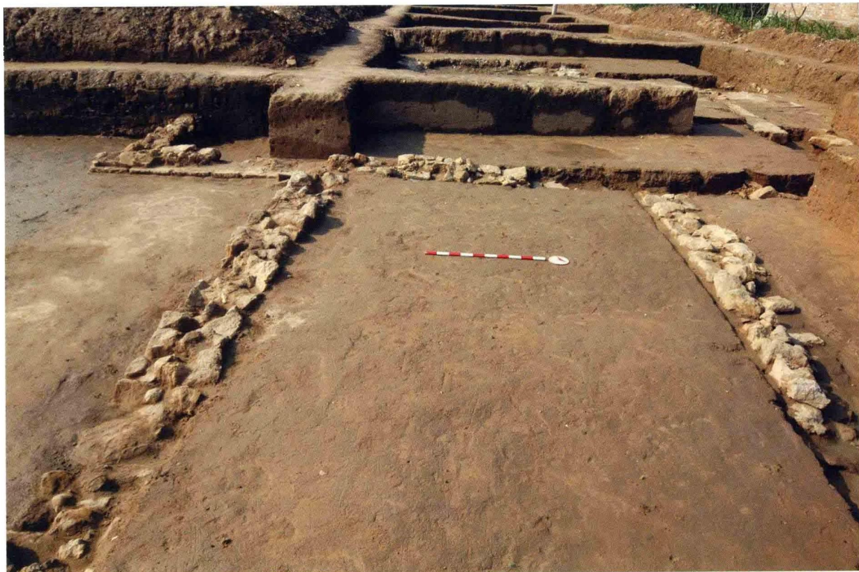
1. 大苑村寺庙遗址后殿月台及甬路 (自南向北)