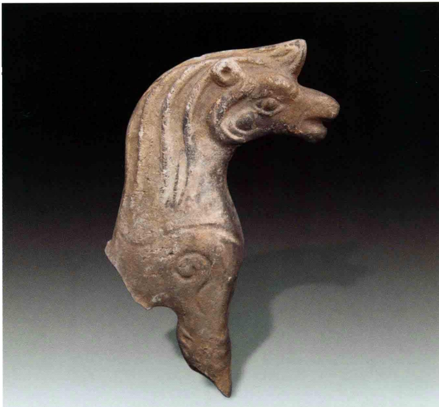
1. 大苑村寺庙遗址出土海马