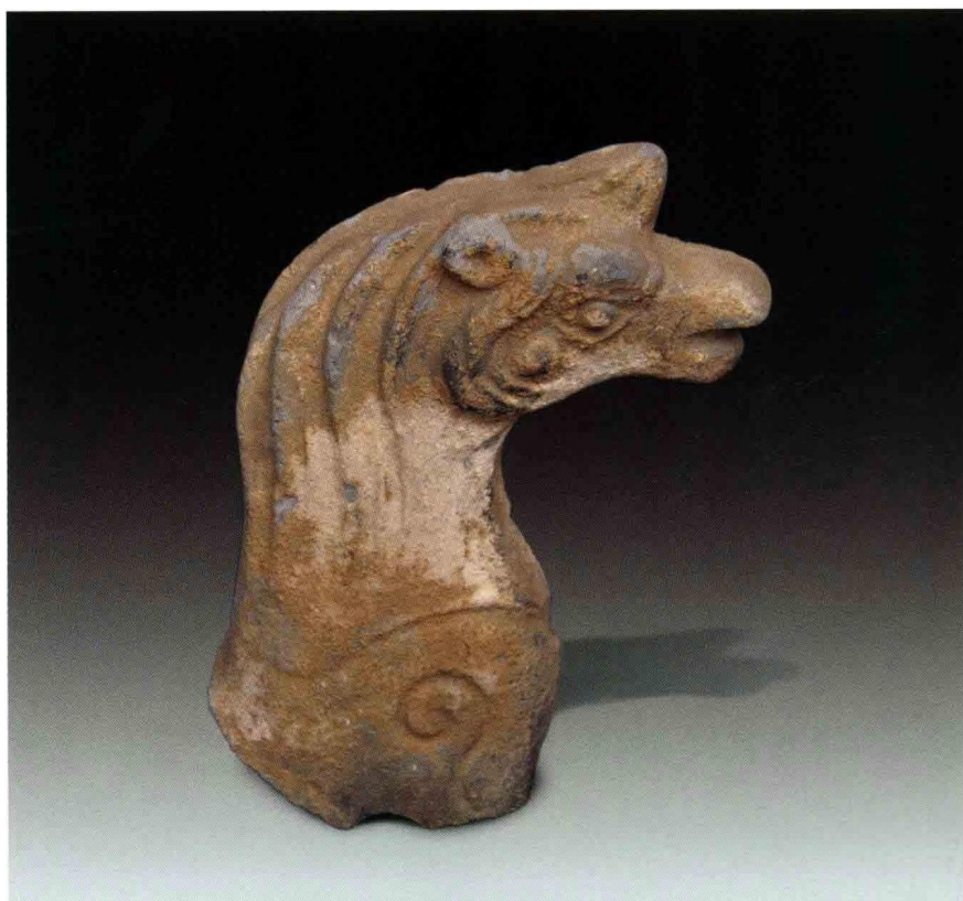
2. 大苑村寺庙遗址出土海马