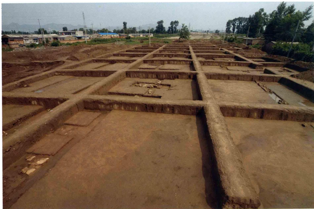
1. 大苑村寺庙遗址北部探方(自南向北)