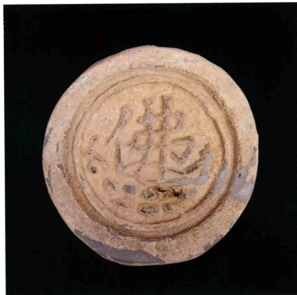
2. 大苑村寺庙遗址出土“佛”字瓦当