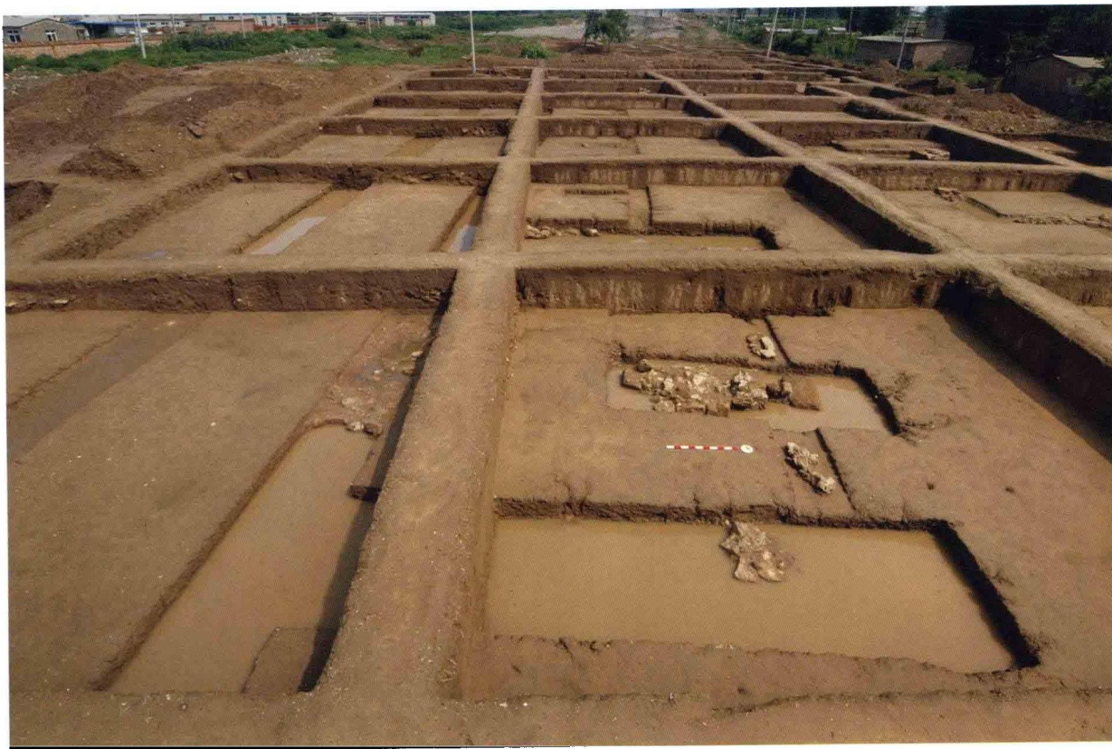
2. 大苑村寺庙遗址西配庑及西围墙 (自南向北)