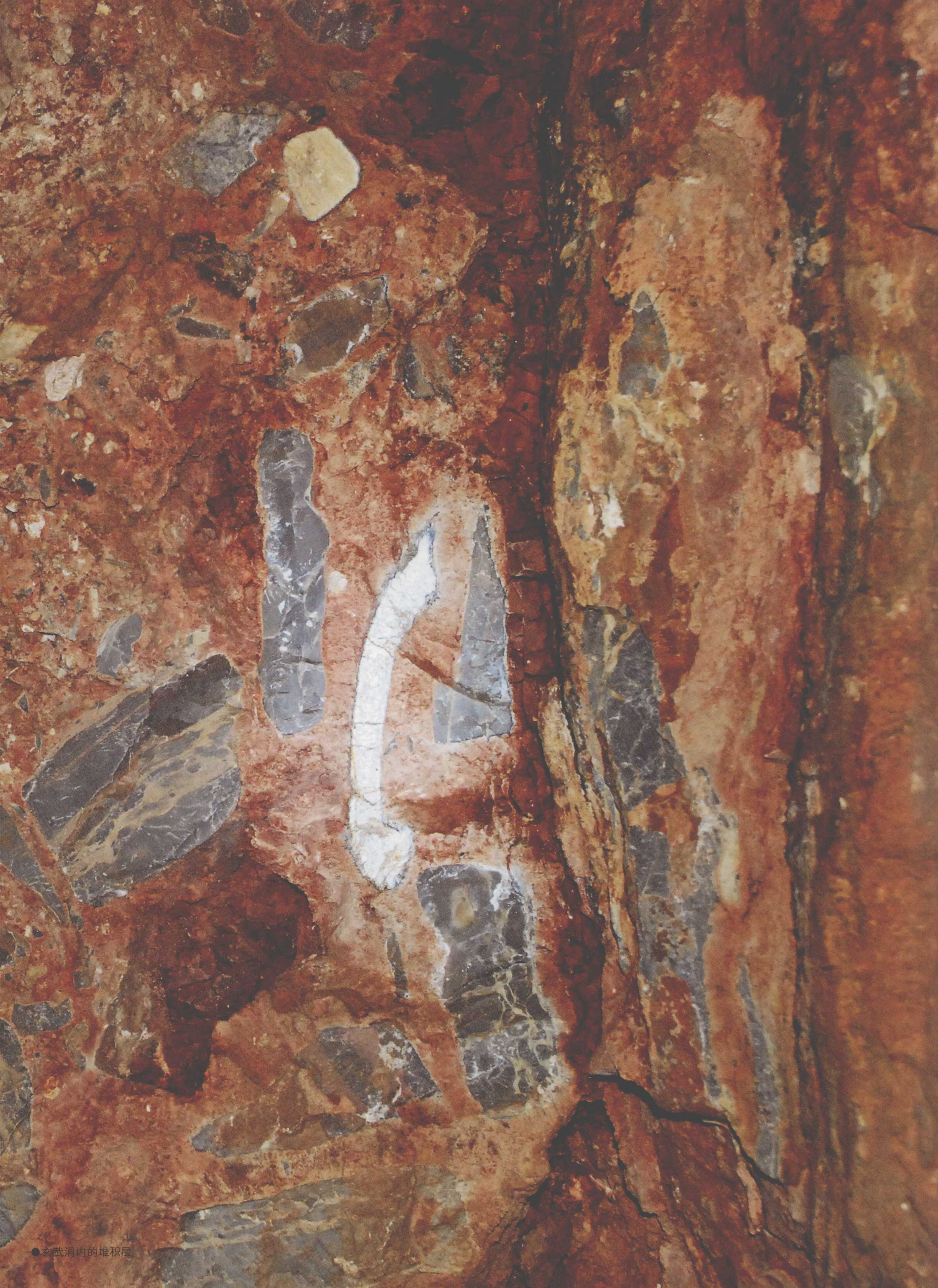
●玄武洞内的堆积层