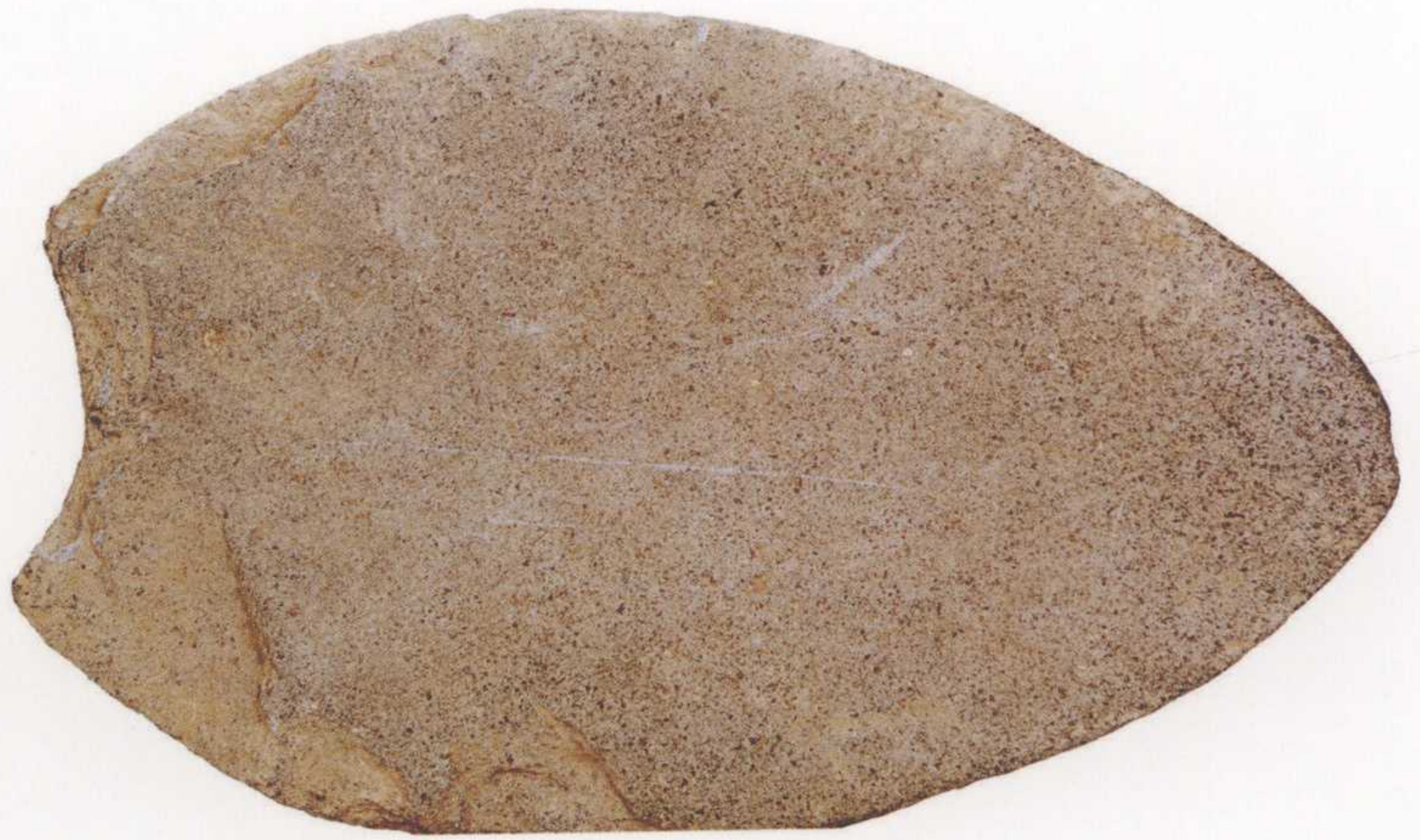
●桂叶形石铲 长34厘米，宽20.5厘米，厚2.7厘米，二级文物