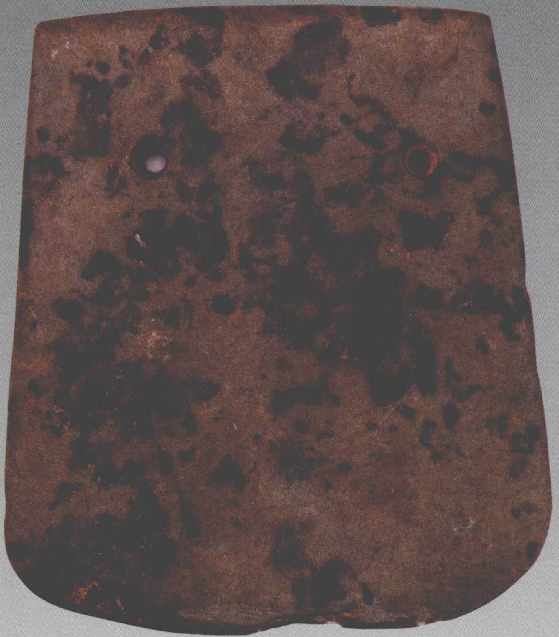
●双孔石铲 长13.3厘米，宽11.4厘米，二级文物 1981年黄楼镇凤凰村西弥河东岸出土