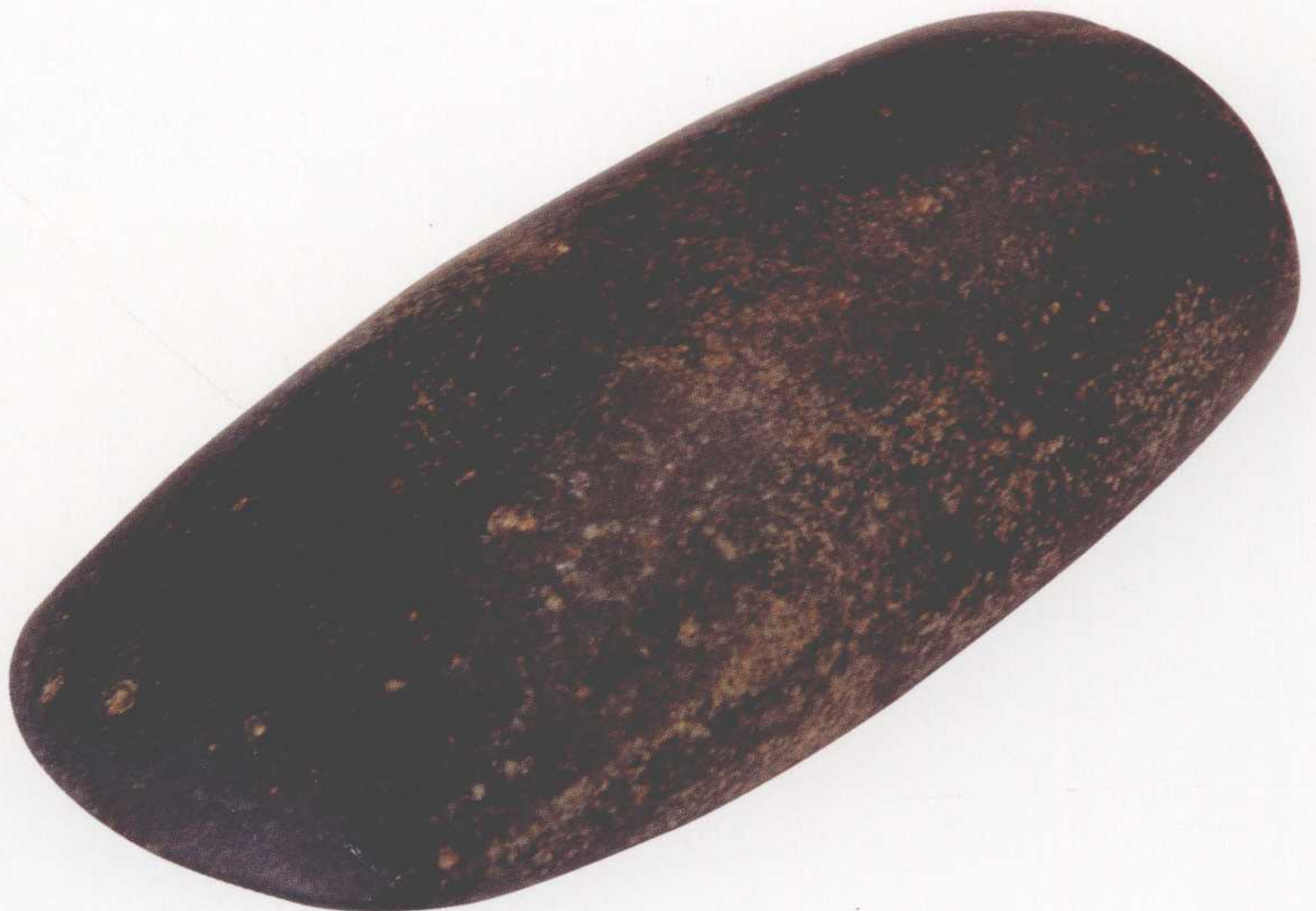
●石斧 长11.5厘米，宽5.5厘米，二级文物 1976年赵铺出土