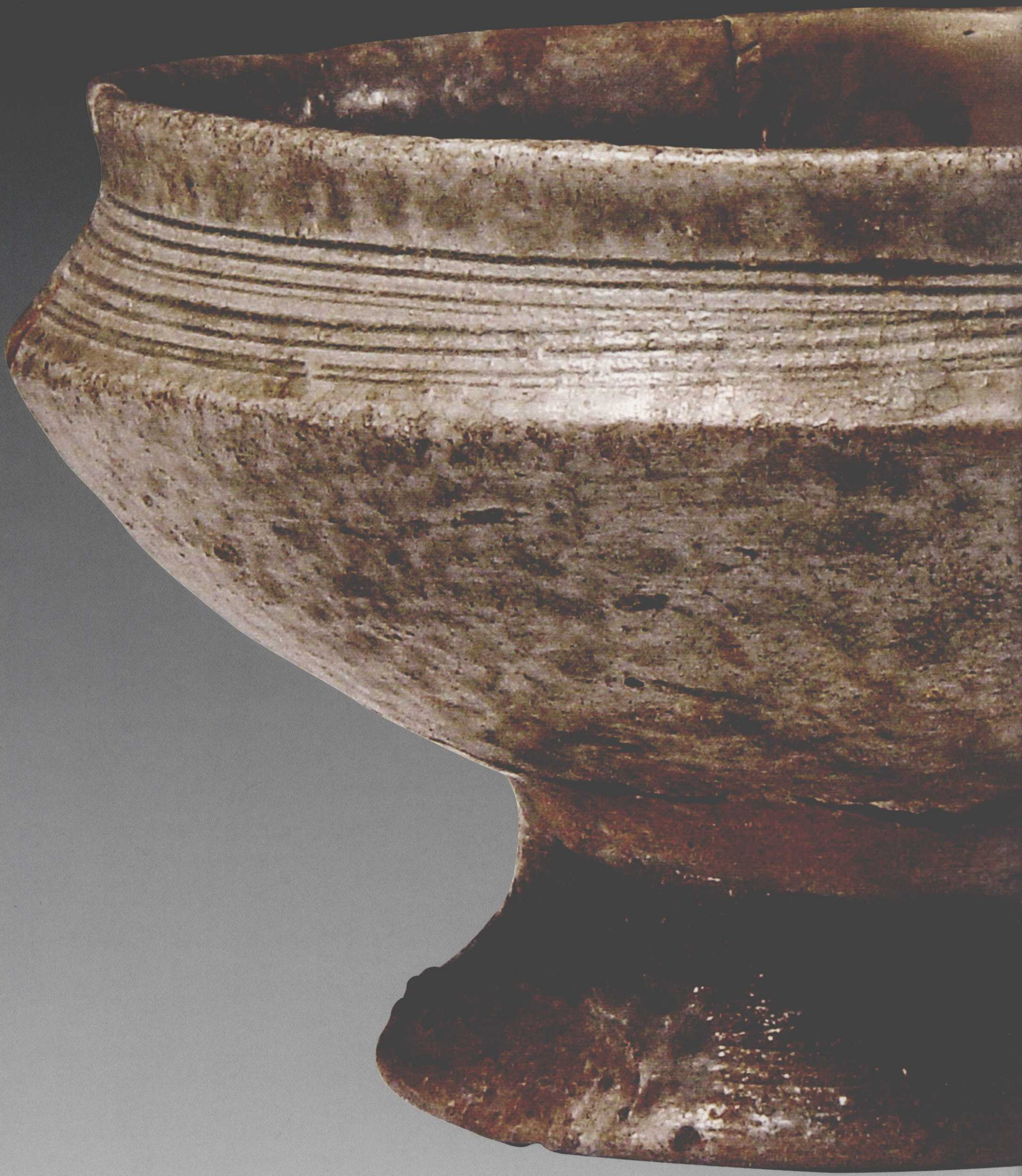
●青釉豆 高7.8厘米，口径12.4厘米，一级文物 1966年东夏镇苏埠屯2号墓出土