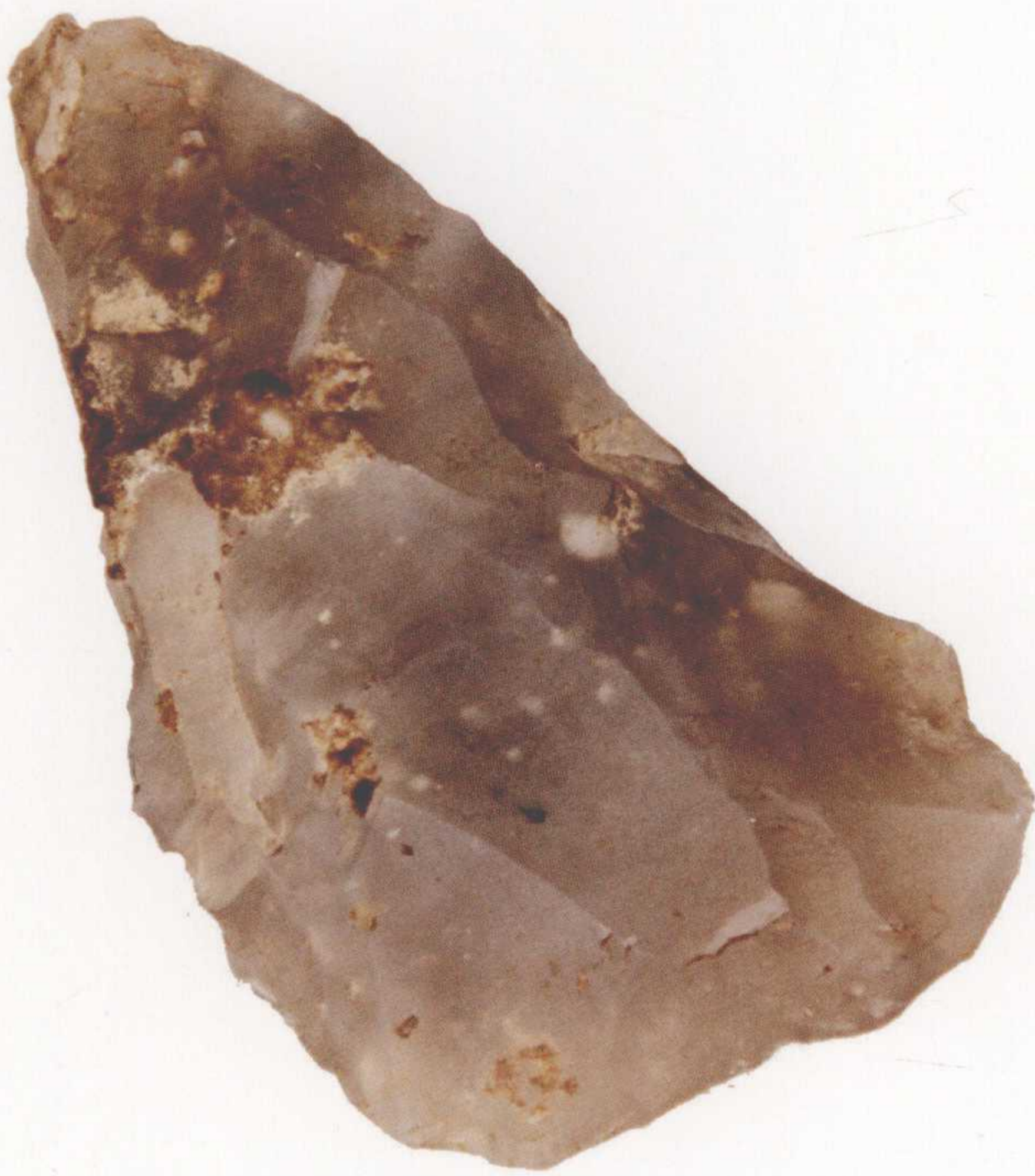
●刮削器 高4厘米，宽2厘米，二级文物 1984年凤凰台遗址出土

距今约三四十万年前，东到大海西到泰沂山脉这块伸入大海的狭长地域——古青州地区，气候温暖湿润。这里雨水充沛，河流密布，大地葱茏，山岭、河谷之间鲜花、野果比比皆是，飞禽走兽争相追逐。最新的考古发现证实在距今青州不足30公里的沂源地区，生活着一群“食草木之实、鸟兽之肉，饮其血，茹其毛”的沂源猿人。在枣庄、济宁、烟台等地，也陆续发现了一些早期人类生活的迹象。他们披着羽毛或兽皮，夏天在树上筑巢居住，冬天在山洞中栖身生活，他们便是东夷人的祖先。