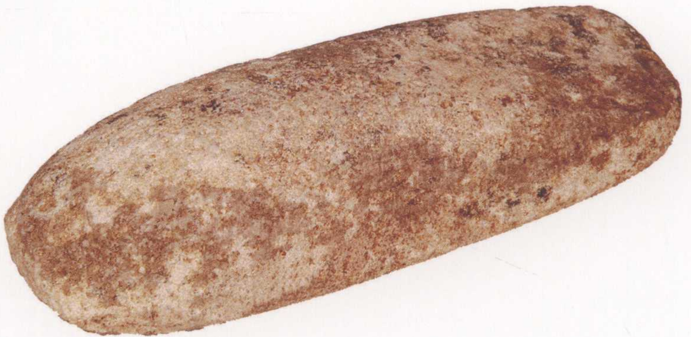
●石磨棒 长15.5厘米，宽6.2厘米，厚4厘米，二级文物