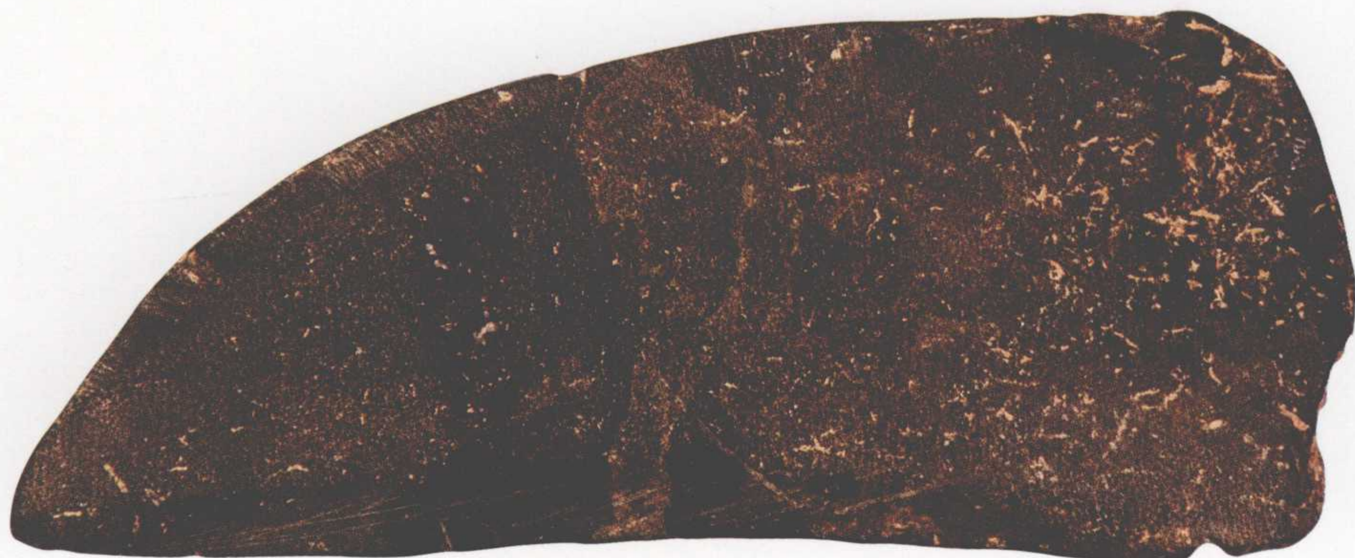
●石镰 长19厘米，二级文物 1981年刘镇出土