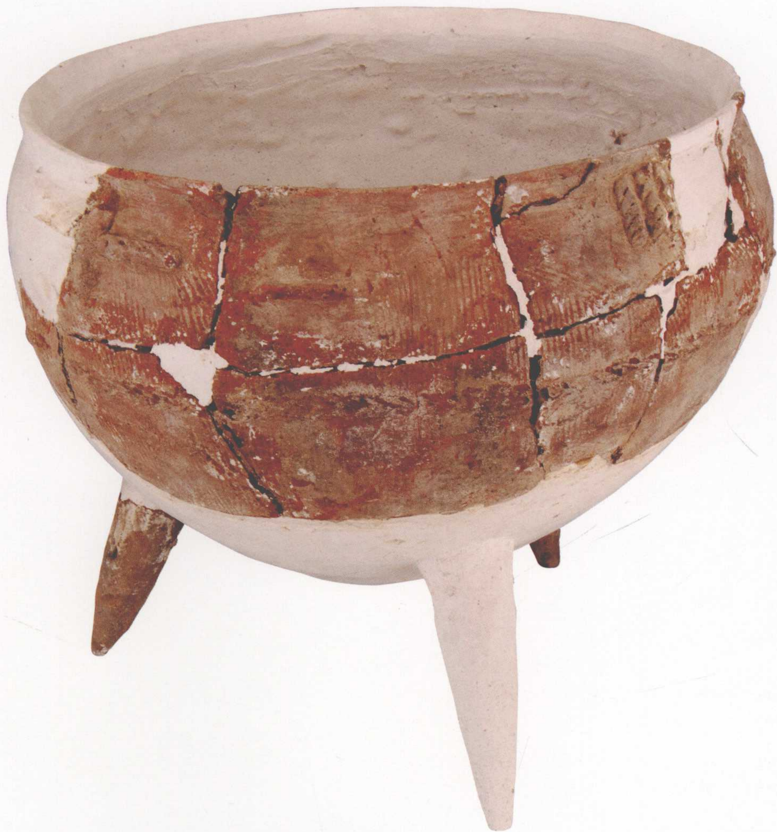
●陶鼎 口径29厘米 1988年东夏镇桃园遗址出土