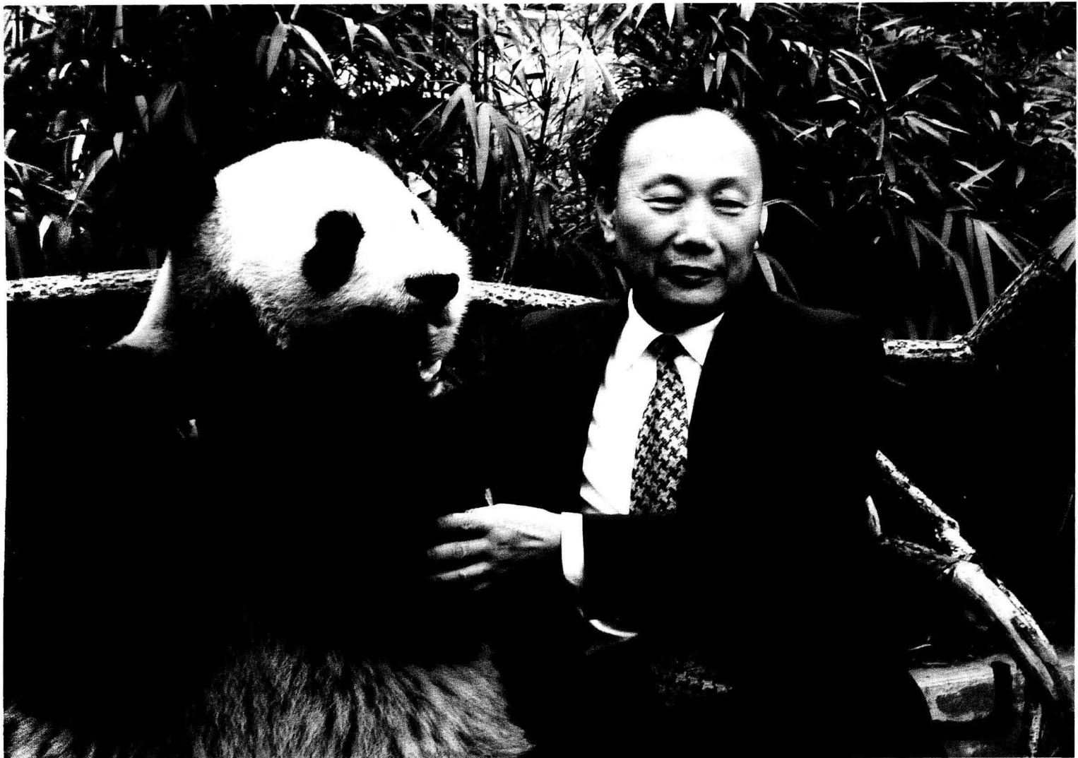
赵学敏与赠台湾大熊猫“团团”“圆圆”合影留念