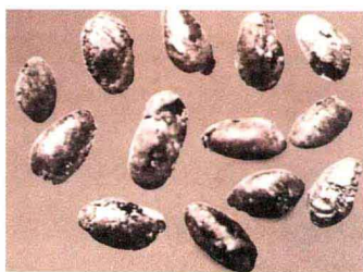
皂角树遗址出土的炭化古植物果实