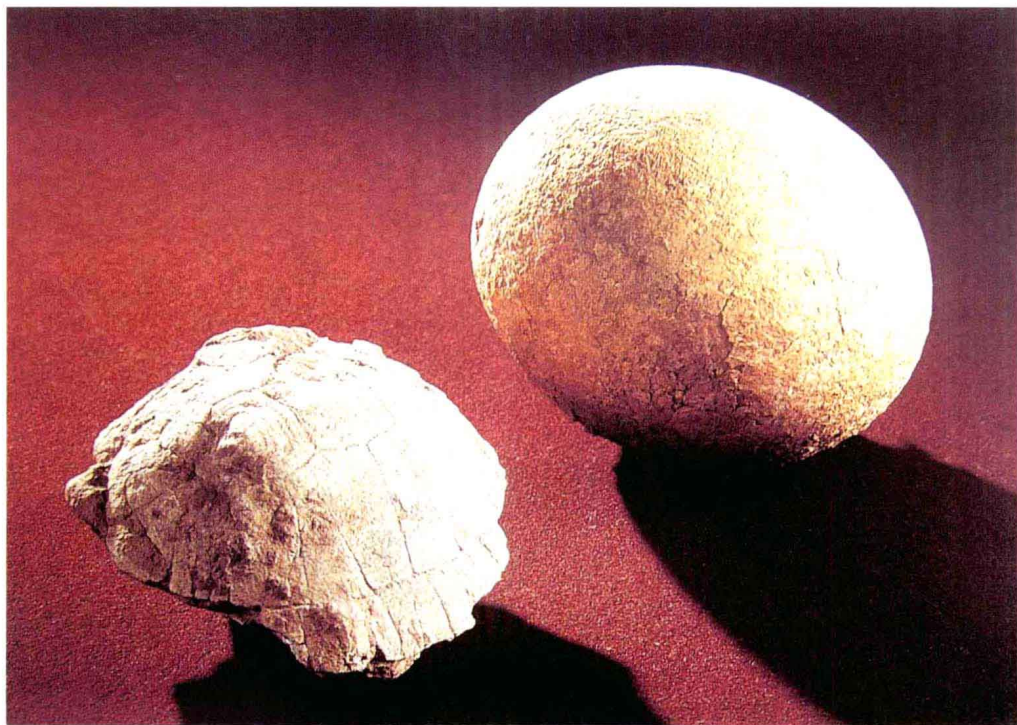
鸵鸟蛋与海龟化石

经学者研究整理，《夏小正》这本仅有400余字的历书中，记录了洛阳盆地为核心区域的夏代的“物候”动植物64种。植物27种。其中木本植物9种：柳、梅、杏、桃、桑、杨、桐、枣、栗等；草本植物16种：韭（韭菜）、芸（芸香）、缟（莎草）、菘（菘菜）、繁（白蒿）、识（龙葵）、王茗（土瓜）、幽（狗尾草）、瓜（甜瓜）、蓝蓼（蓼蓝）、兰（泽兰）、苇（芦苇）、苹（浮萍）、苳（扫帚草）、荼（苦苣）、鞠（菊花）、卵蒜（山蒜）等。动物37种。其中有鸟类：雁、雉、鹰、鸪、鸡、燕、仓庚（黄鹌）、鴛（鹤鹑）、鸛（伯劳）、丹鸟（锦鸡）、白鸟（白鹭）、雀（麻雀）、黑鸟（乌鸦）、弋（鸢）等14种；哺乳类：田鼠、獭、羊、马、狸、鹿、熊、罴（棕熊）、貂（大熊猫）、貉、鼬、鼪（黄鼬，俗称黄鼠狼）、豺、麋等14种；昆虫类（昆虫纲）：螿（蟋蟀）、蚕、蝉、浮游、蚂蚁等13种；此外还有鱼类的鲟（白鲟），爬行类的鱓（鼃，俗称扬子鳄），软体类的蛤、蜃，两栖类的蜃（雨蛙）等等。上述《夏小正》记录的动植物仅仅是与气候变化有影响并且可以被用来确定日期和季节、安排农事，以其直观、朴素、生动、通俗而为普通百姓所喜闻乐见的部分，而且由于当时科学水平的限制或者其他原因，对其中的一些动植物的记录不具体，如鹿，则是哺乳纲鹿科动物的通称，其实种类很多，如麋、麝、梅花鹿、水鹿、