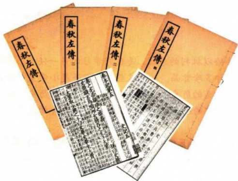
《春秋左传》《史记》书影