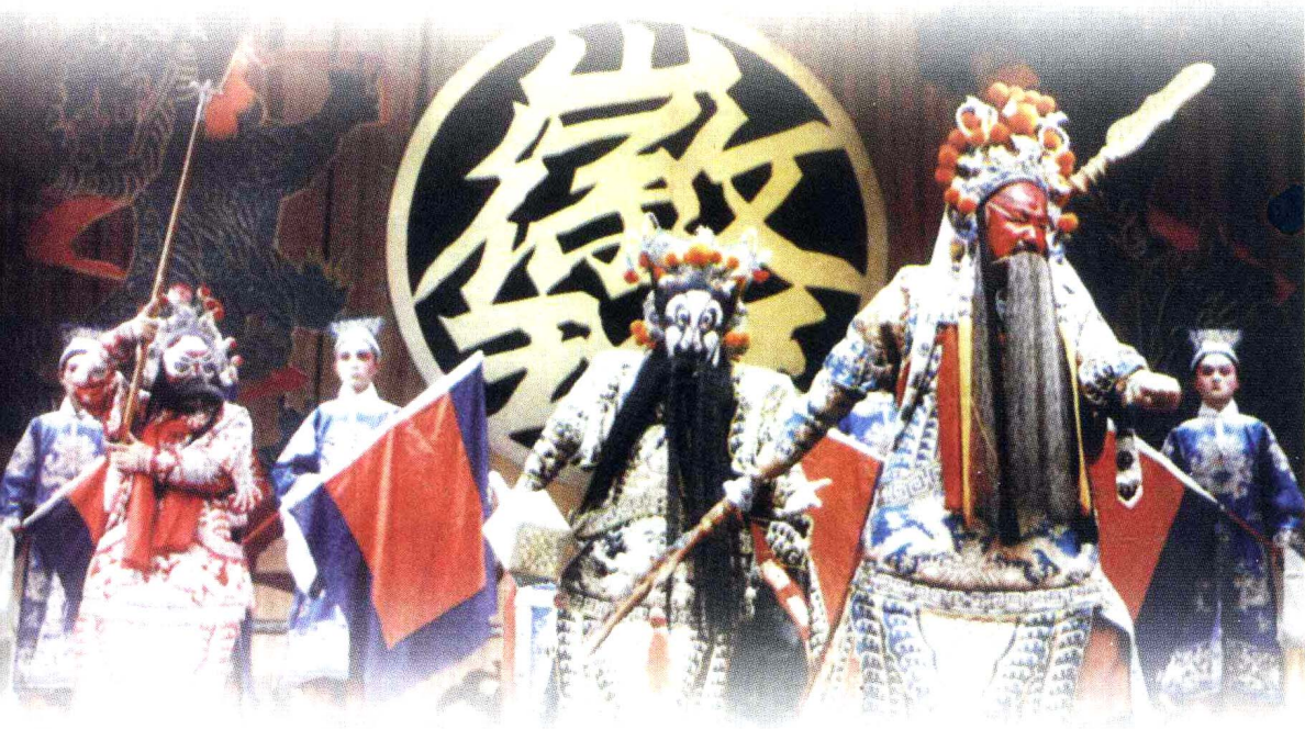
安徽省徽剧团演出的折子戏之一《水淹七军》，叙述三国时期的一次水上战役

戏曲常采用历史人物、典故、重大历史事件等作为表现题材。掌握戏曲的基本知识，提高戏曲的鉴赏能力，对于加深中华民族传统文化的认识有着重要作用。