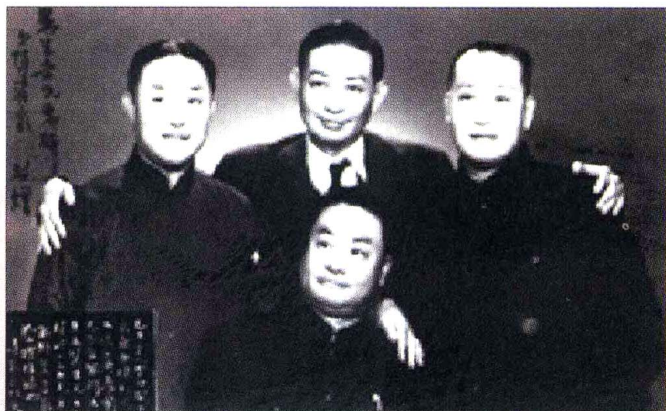
四大名旦 前为程砚秋，后左起：尚小云、梅兰芳、荀慧生