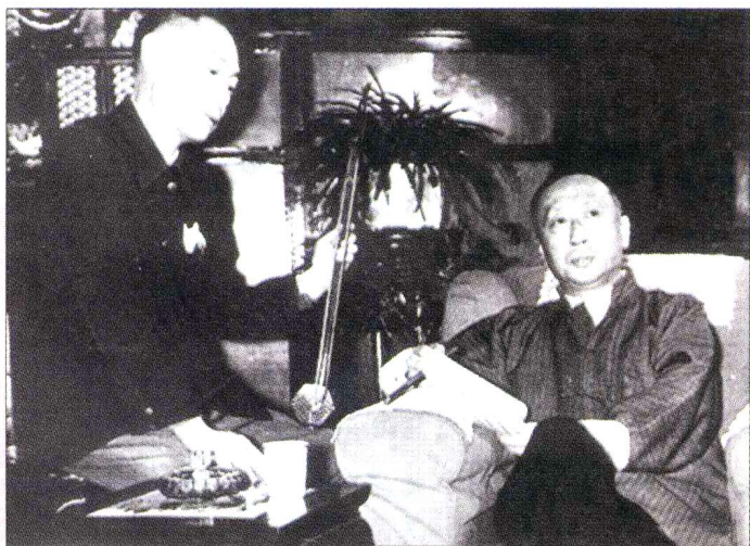
京胡大师李慕良与京剧大师马连良（右）在研究唱腔与配乐

戏曲音乐的发展有着悠久的演变历史，融民歌、曲艺、歌舞、器乐等多种音乐成分为一体，最终形成了自身独特的艺术形式和风格，是我国传统文化中的瑰宝。