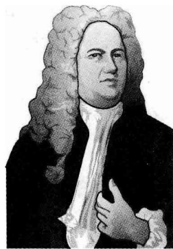
亨德尔 (1685 ~ 1759)

亨德尔一生写了32部清唱剧，其中2/3的曲子都是在1737年他52岁中风发作后才完成。人们认为在他病倒后对于信仰变得更加虔诚，因而投注更多的心力于清唱剧的创作，但也有人认为是他潦倒之前一连串歌剧事业的失败所导致的结果。事实上，亨德尔之前的确是以歌剧作曲家的身份而家喻户晓，所作的歌剧数量也比清唱剧来得多（46部），只是现在的演出较少。不过，正是这样的亨德尔，所写出来的清唱剧虽说是宗教音乐却富含戏剧性，大多数的曲目也较为通俗，就连我们也能听懂作品。此外，也许因为他的作品大多是在剧场演出而不是教会，所以他的清唱剧也被称为剧场上的清唱剧。其中《弥赛亚》虽然普遍认定为戏剧性较少的作品，但以“哈利路亚”大合唱为首的这19部巨作，依旧深深地响彻在每位聆听者的心中。