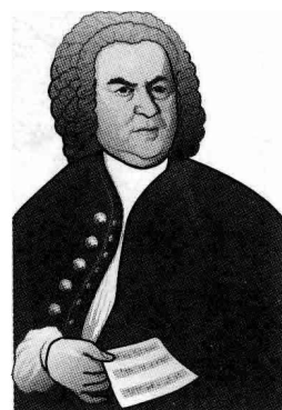
巴赫 (1685 ~ 1750)

《勃兰登堡协奏曲》共有 6 首，于 1721 年 3 月完成总谱。就像它原本题名的“各种乐器所作成的协奏曲”一样，6 首都分别是由不同的乐器所作成，其中最著名的就是以长笛、小提琴和大键琴这些独奏乐器所组成的第五首。因为全曲给人活泼开朗的气氛，也可以说是巴赫的作品中最容易听到的一首。