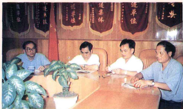
团结进取的领导班子