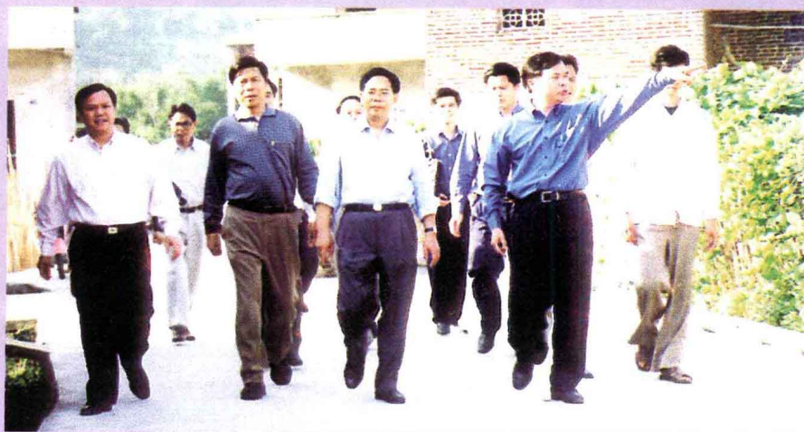
市委书记 陈均伦（前左 三）视察广宁 村镇建设