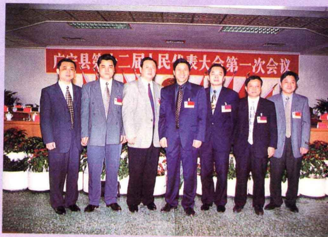
县人民政府县长、副县长合影