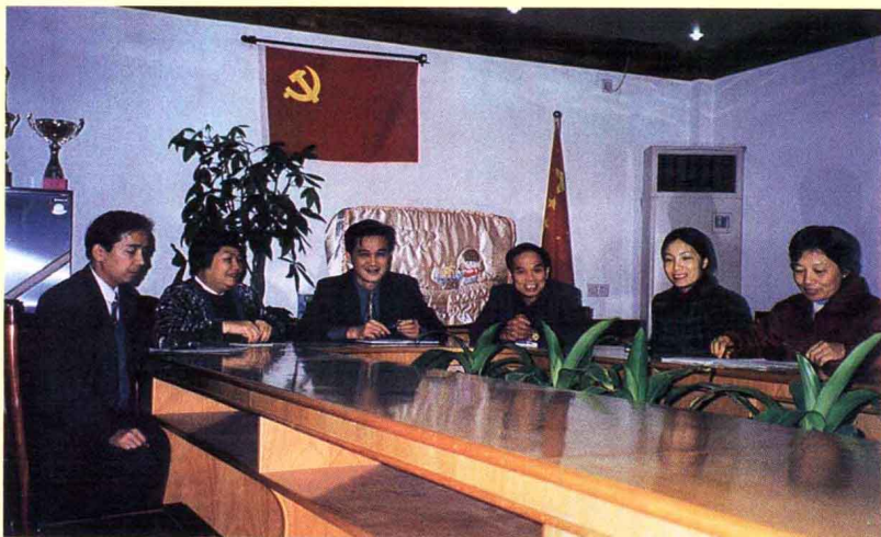
团结务实的领导班子