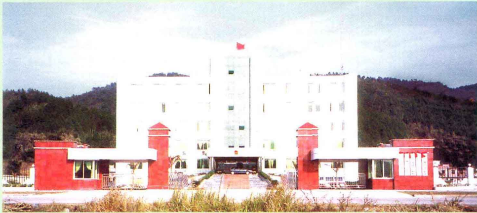
镇委、镇政府办公大楼

石涧镇位于辖6个村委会和2人口13619人。面公里，有山地5.17049亩，其中水该镇认真抓好粮是稻谷生产，逐面积和塑盘育秧推广规范化栽培、1997至1999年连年亩产“吨谷镇”力发展“三高”农交通便利的地理