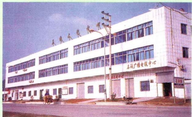
镇文化、广播电视中心