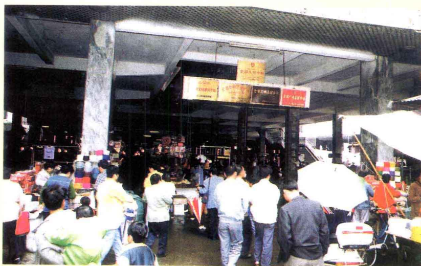
市场成交活跃、购销两旺