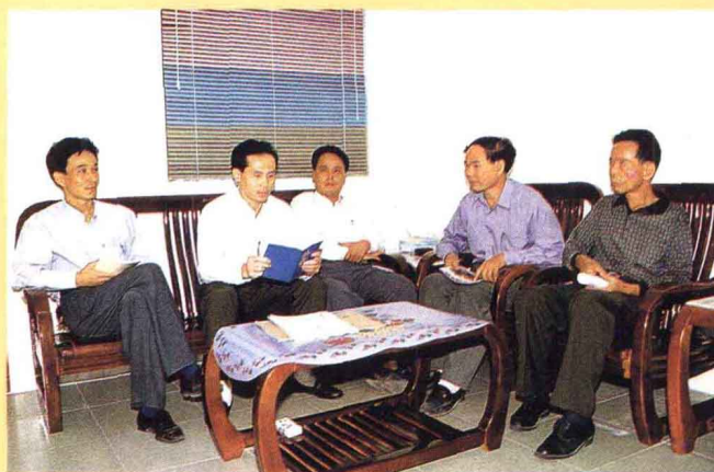
局领导在研究工作

广宁县公路局下设办公室、财务股、生产股、机械股、征稽所、路政站、工会等7个股室和25个道班，担负着广宁县境内省养公路（省道5条、县道7条、乡道2条）330公里的养护、改造、管理和全县汽车养路费征收任务；成立了“肇庆新宁公路有限公司”和“肇庆新江公路有限公司”，下辖长塘、春水、江积3个收费所，经营管理县境内S263（连大）线和S264（石禄）线二级水泥公路；拥有一支技术力量雄厚、机械设备先进的工程施工队伍，