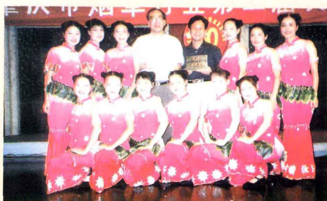
企业文化多姿多彩