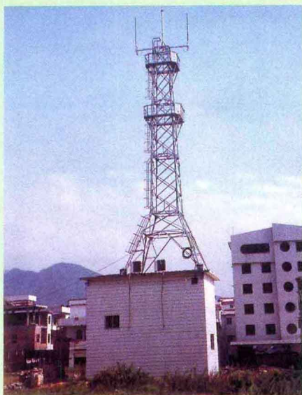
有线电视前端接收塔

潭布镇委、镇政府带领全镇广大干部群众开拓进取，大力发展生产，优惠的政策和良好的投资环境，积极做好招商引资工作，加快私营经济发展步伐，使经济保持健康、协调、稳定发展。1998年新办项目8个，引进项目6个。抓好现有水电站巩固、挖潜工作，加强生产管理，落实生产责任制，组织满负荷生产，提高经济效益。在抓好粮食生产的基础上，发展“三高”农