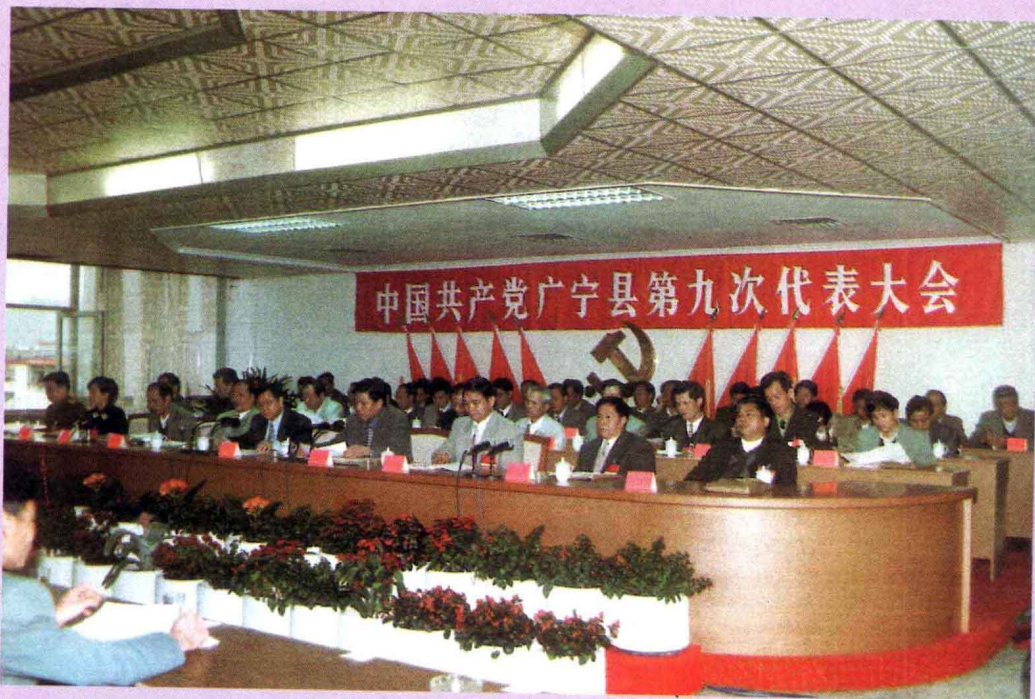
1998年2月25至28日，中国共产党广宁县第九次代表大会召开