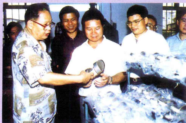
副省长汤炳权（左三）到广宁外资企业指导工作