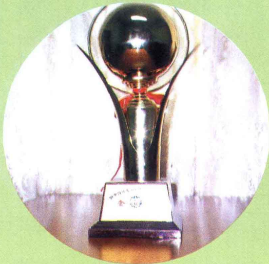
'99中国竹文化节国际竹业博览会金奖奖杯