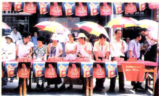
开展卷烟促销活动