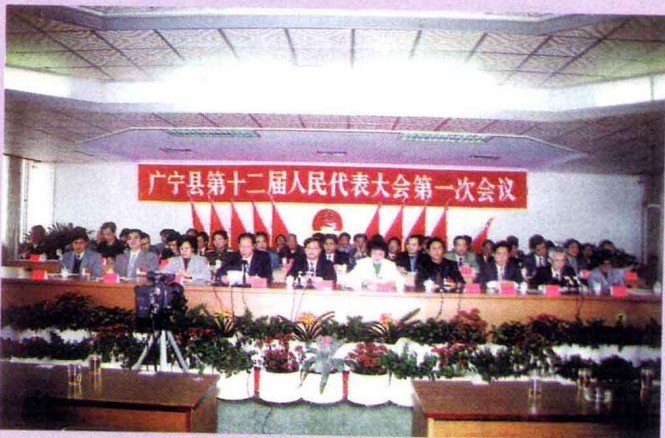
1998年3月3日至7日，广宁县第十二届人民代表大会第一次会议召开