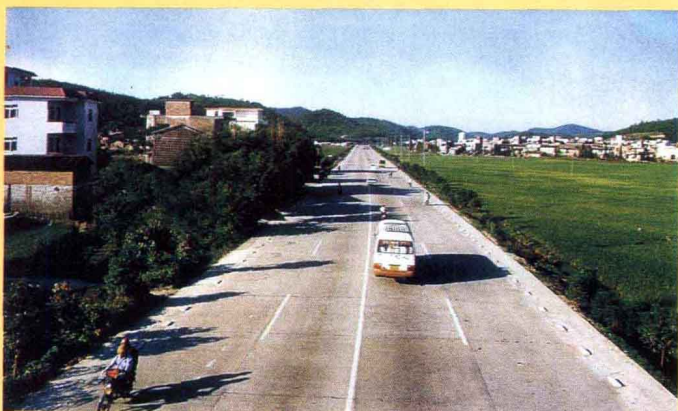
省道连大线广宁路段