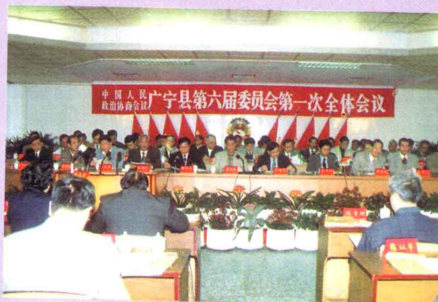
1998年3月2日至5日，中国人民政治协商会议广宁县第六届委员会第一次全体会议召开