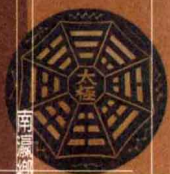
南瀛總士總情事錄