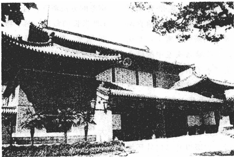
中南海仪鸾殿（今怀仁堂）

经国家文物管理部门批准，1980年6月15日，清西陵管理处对崇陵地宫进行了保护性清理。墓葬破坏严重，专家进行了精心清理。墓葬清理完毕后，再次予以封闭。为了今后研究之用，清西陵管理处的专家，将光绪皇帝、隆裕皇后的头发及部分尸骨和遗物带出，保存于库房之中。这是一个有远见卓识之举。他们的这个超前而果断的决策，为百年后破解光绪帝死因之谜，立了头功。