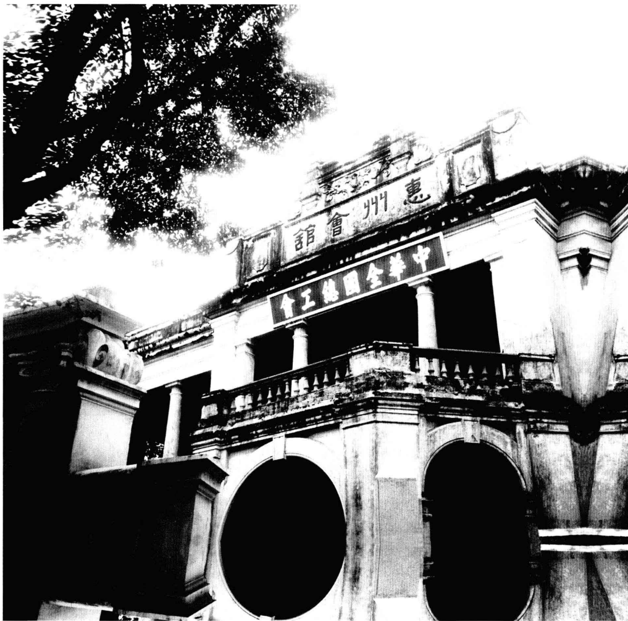
中华全国总工会旧址

1925年5月，中国共产党在广州召开了第二次全国劳动大会，成立了中华全国总工会。会后不久就爆发了五卅运动，把全国大革命推向高潮。1925