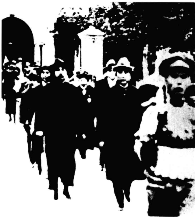
孙中山步出国民党“一大”会场