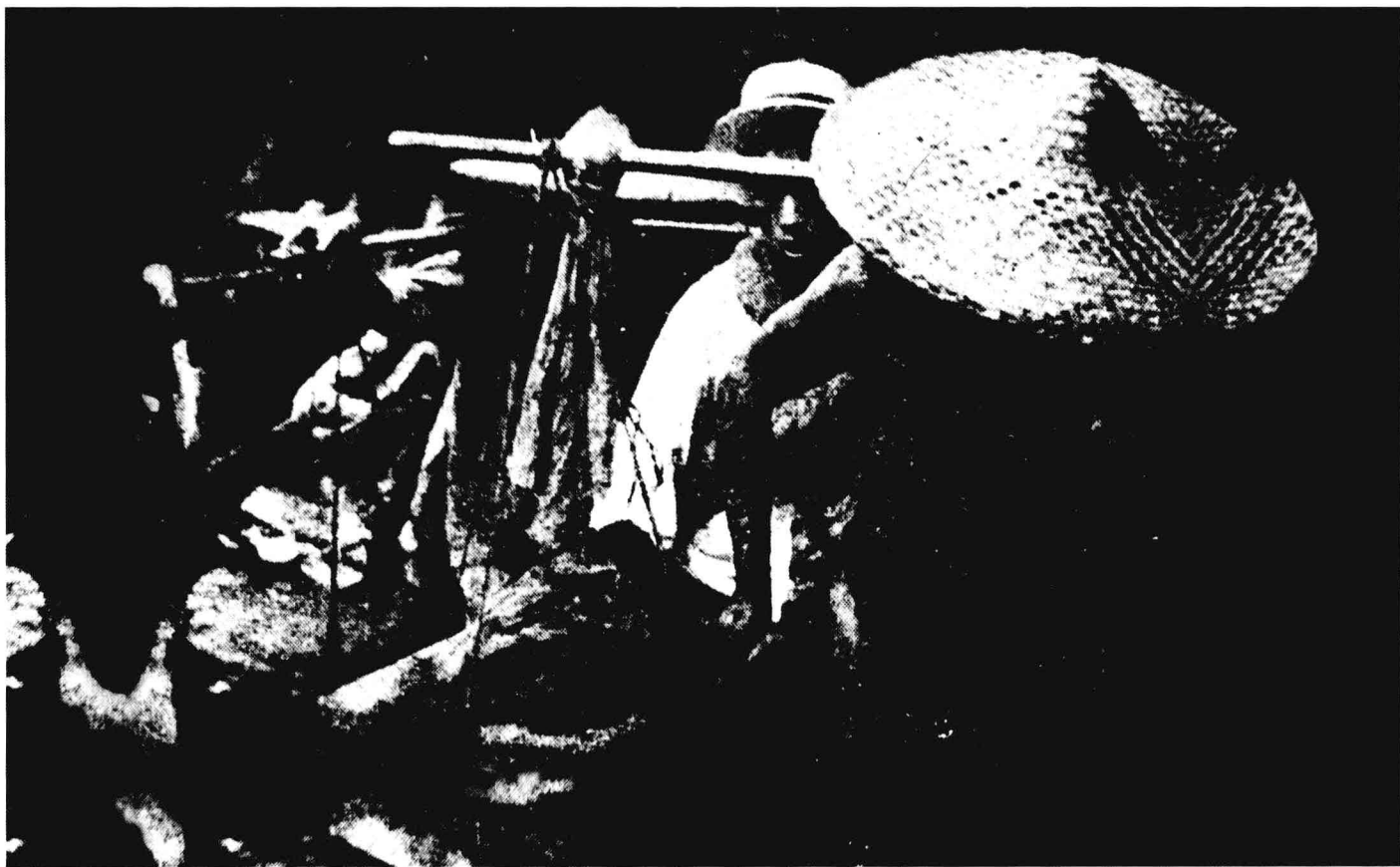
工农运输队支援北伐