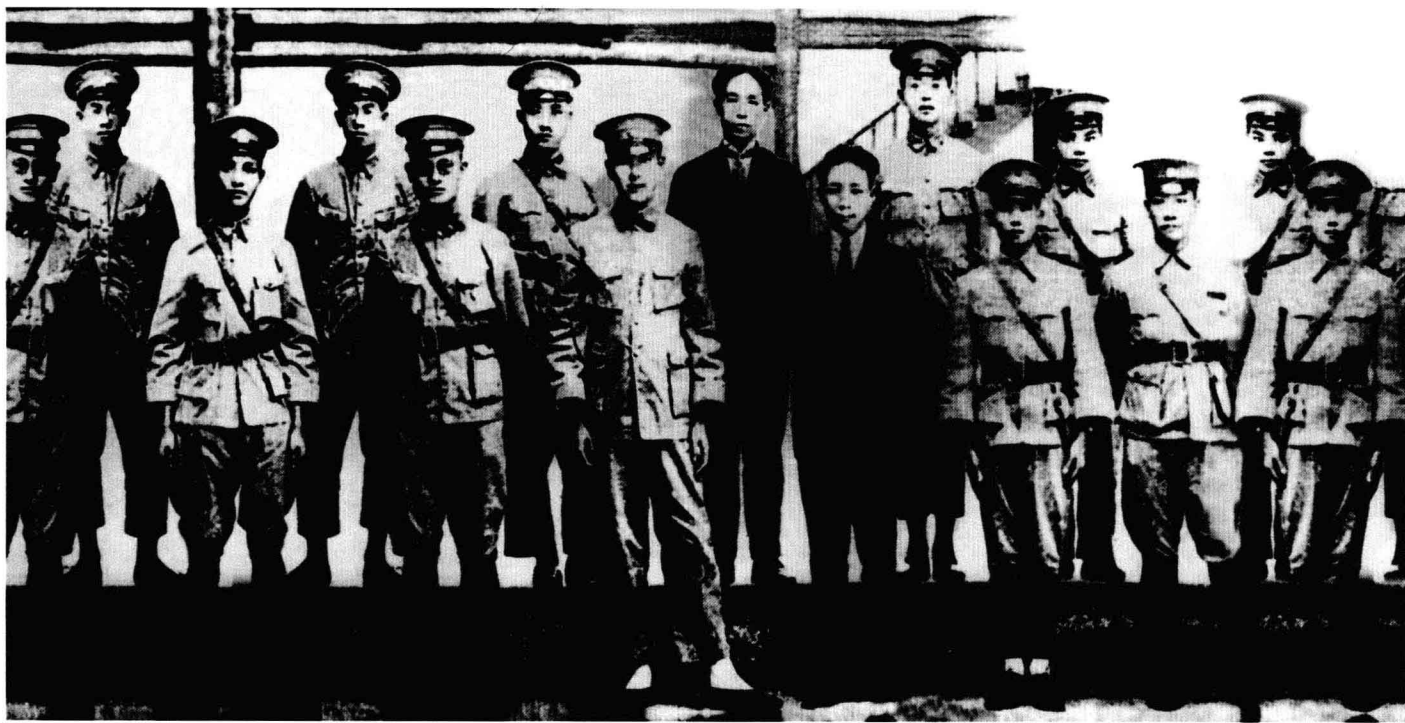
黄埔军校政治部工作人员合影

1924年5月，国共两党合作在广州创办了黄埔军官学校，培养了大批军事、政治骨干。1926年7月1日，国民政府发表《北伐宣言》，9日国民革命军出师北伐。北伐