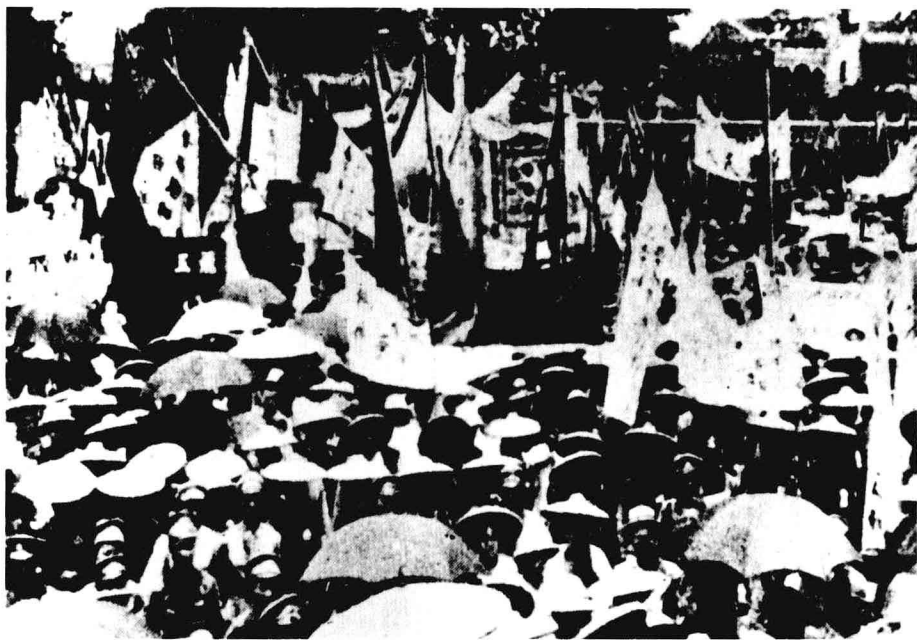
国民革命军出师北伐

军在广大工农群众密切配合下，先后占领长沙、武汉、南昌、福州、杭州、南京、上海。北伐战争是一场伟大的反帝反封建的革命战争，严重地动摇了帝国主义和封建军阀的反动统治，为革命进一步发展开辟了广阔的前景。