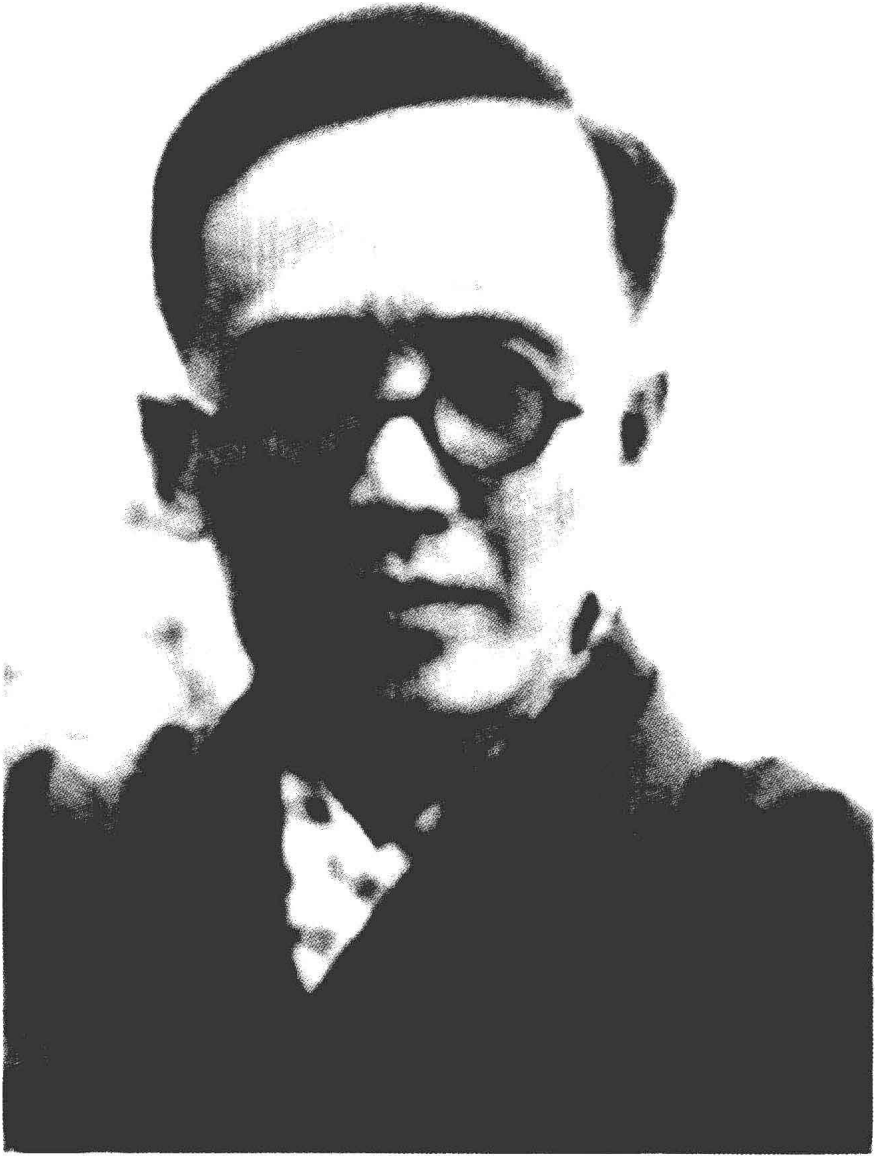
一九三三年在日本