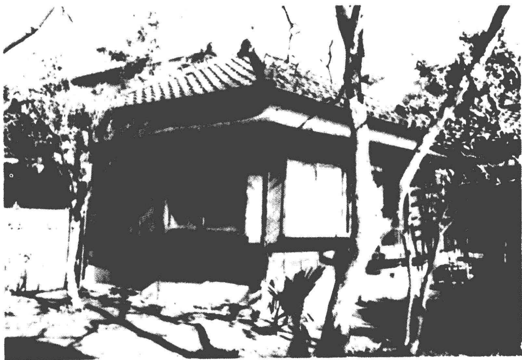
日本须和田旧居外景 (作者于一九二八年—一九三七年在此居住)